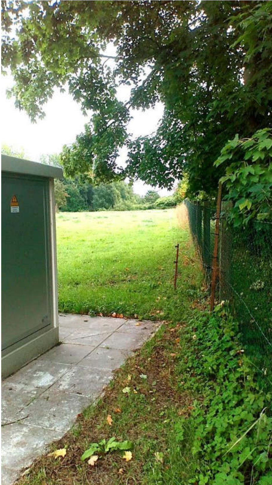
Bild 15_114_17-Trafo_Blick SO