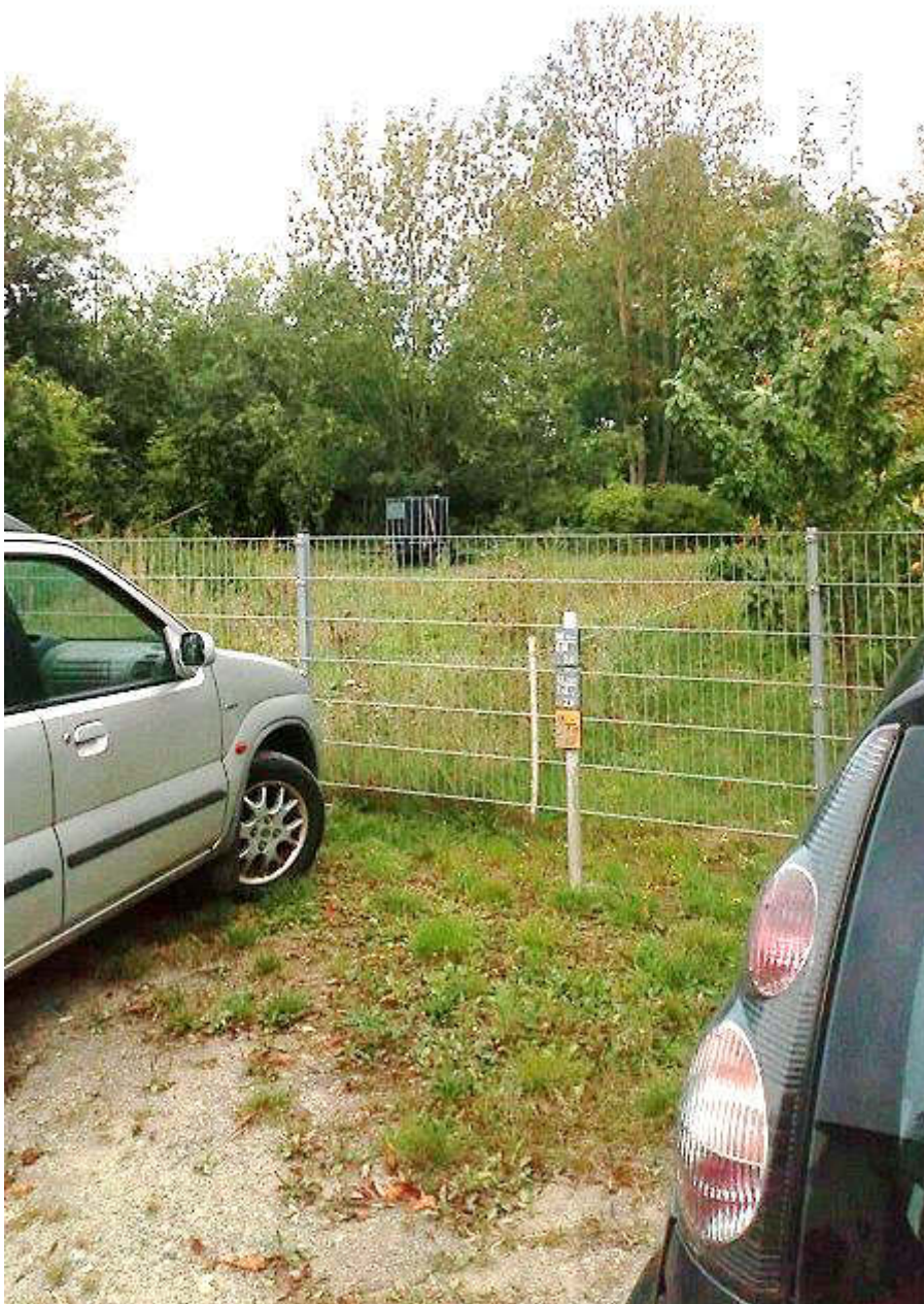
Bild 2_Zaun südl an Gadebuscher Str