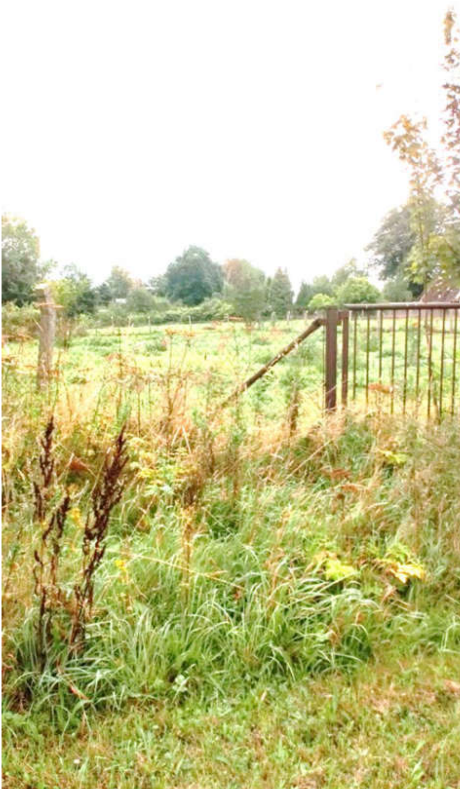
Bild 10_Tor-NW-Ecke 114_16