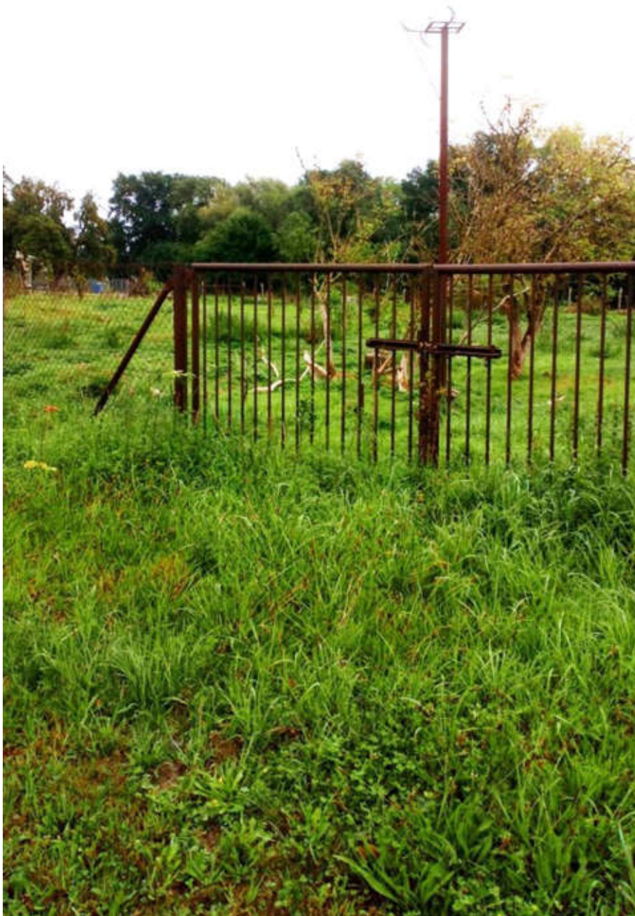
Bild 9_Tor_NW-Ecke 114_16