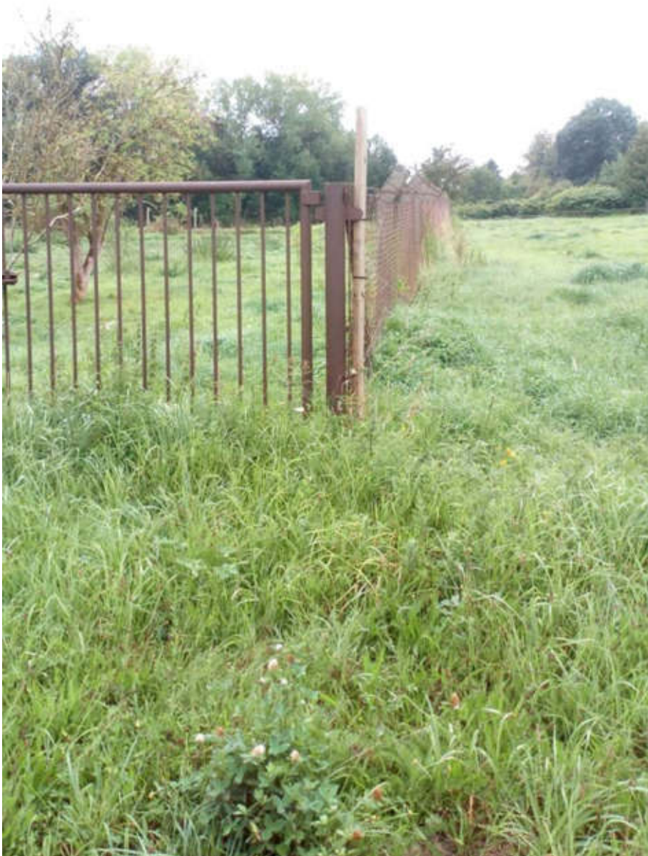
Bild 8_Tor in NW-Ecke v 114_16