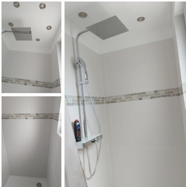
Bad unten 2