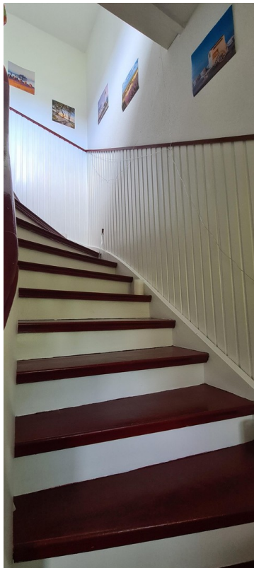
Treppe nach oben