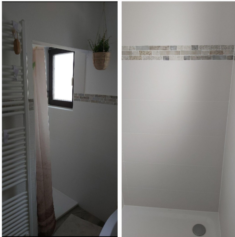
Bad unten 3