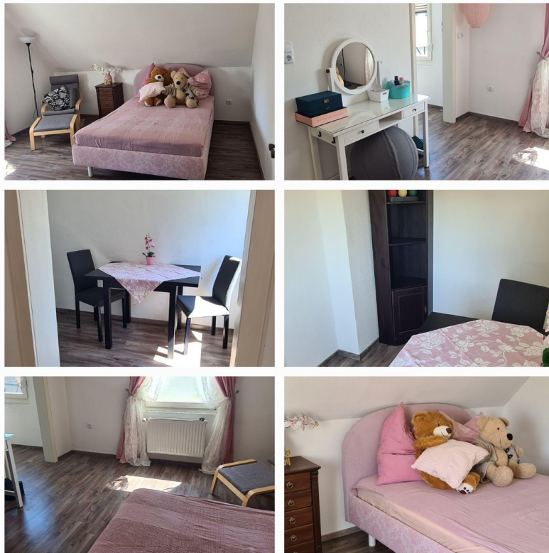
Schlafzimmer 1 oben