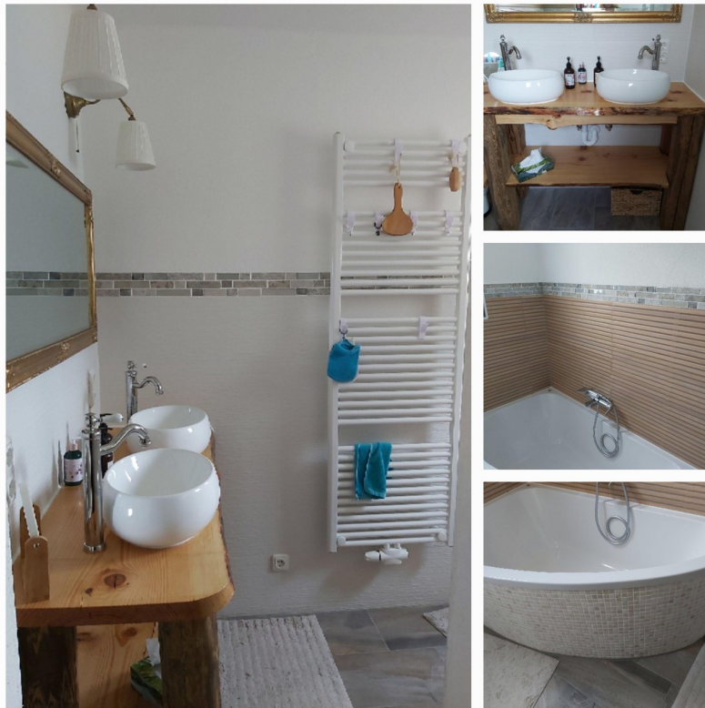
Bad unten 1