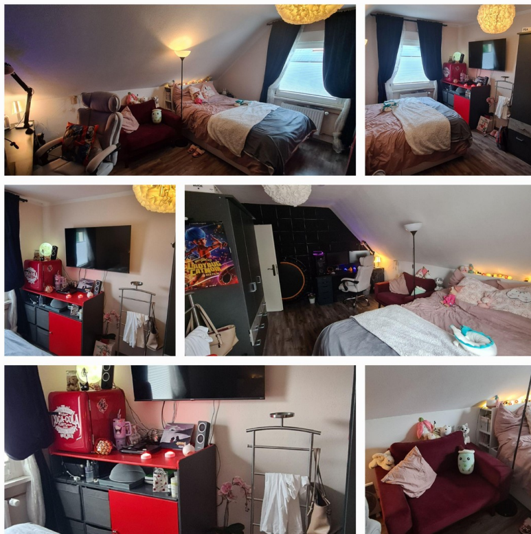
Schlafzimmer 2 oben