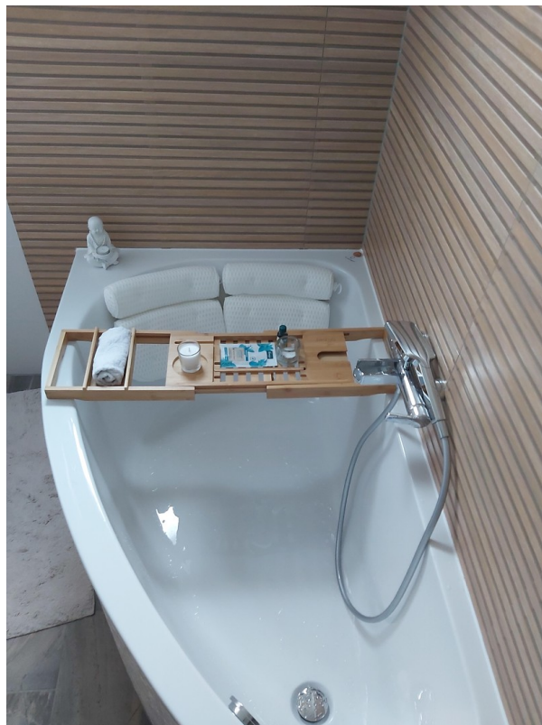
Spa-Badewanne Bad unten