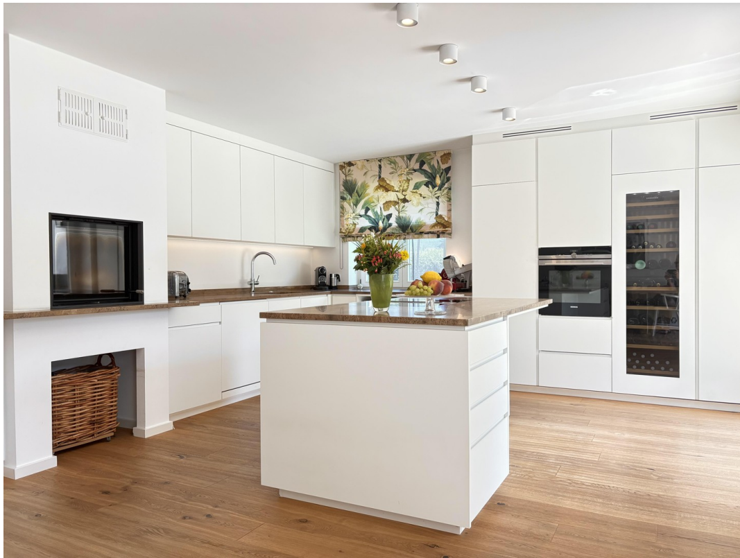
Wohnküche Bild 2