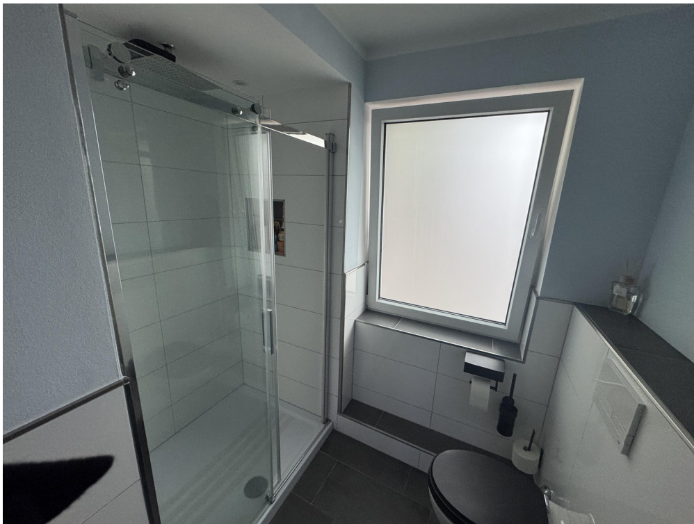
Bad mit großer Dusche