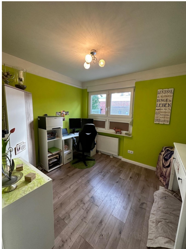
Zimmer 2: heute Büro