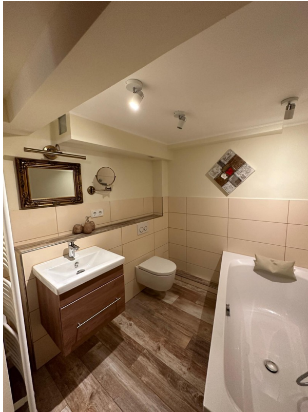
Bad mit Badewanne im Keller