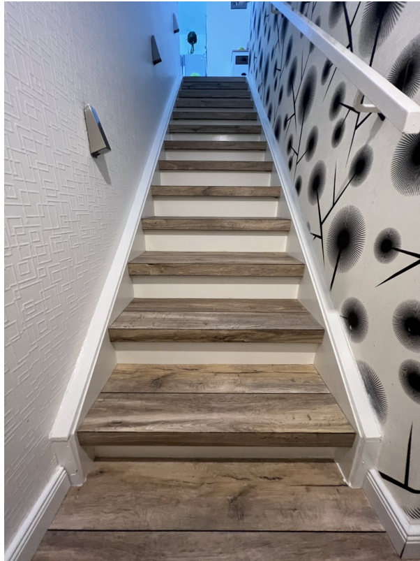
Kellertreppe vom Fachmann