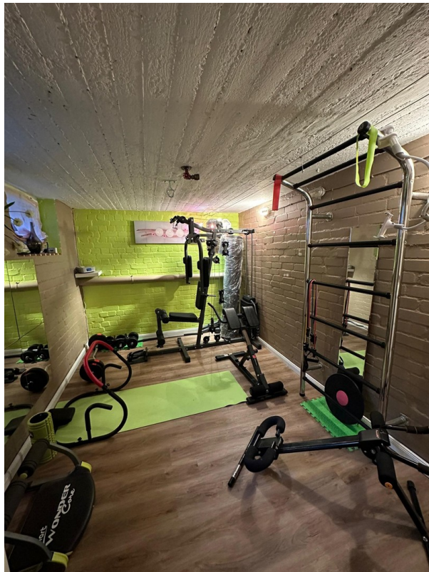
Fitnessraum im Kellerbereich