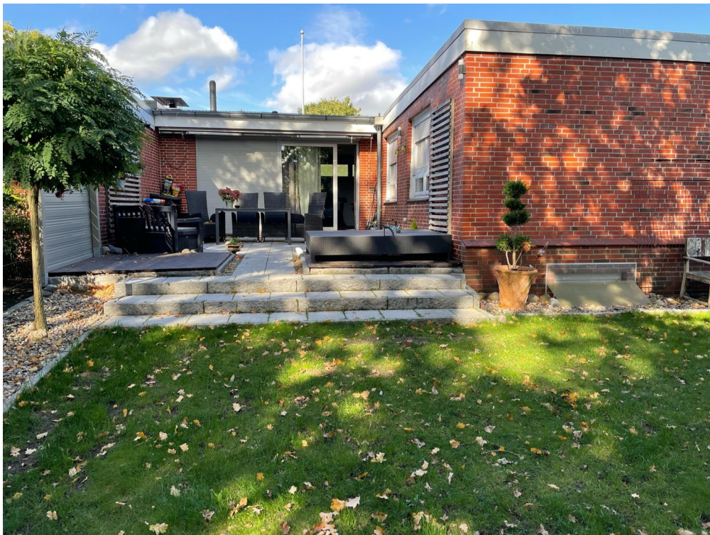
Schöne sichtgeschützte Terasse