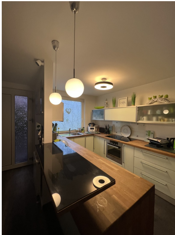
moderne & offene Küche