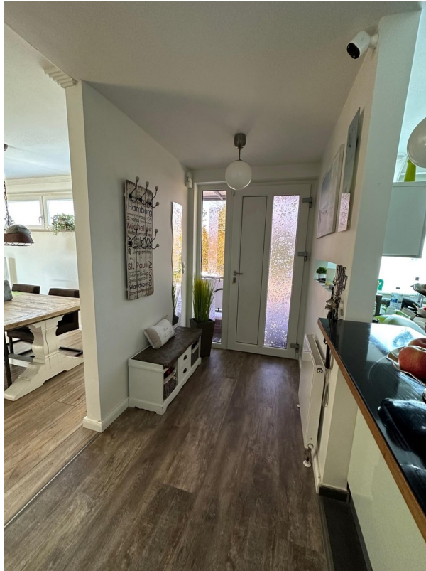
Flur vorderer Bereich