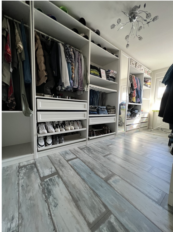
Zimmer 1: heute Ankleide