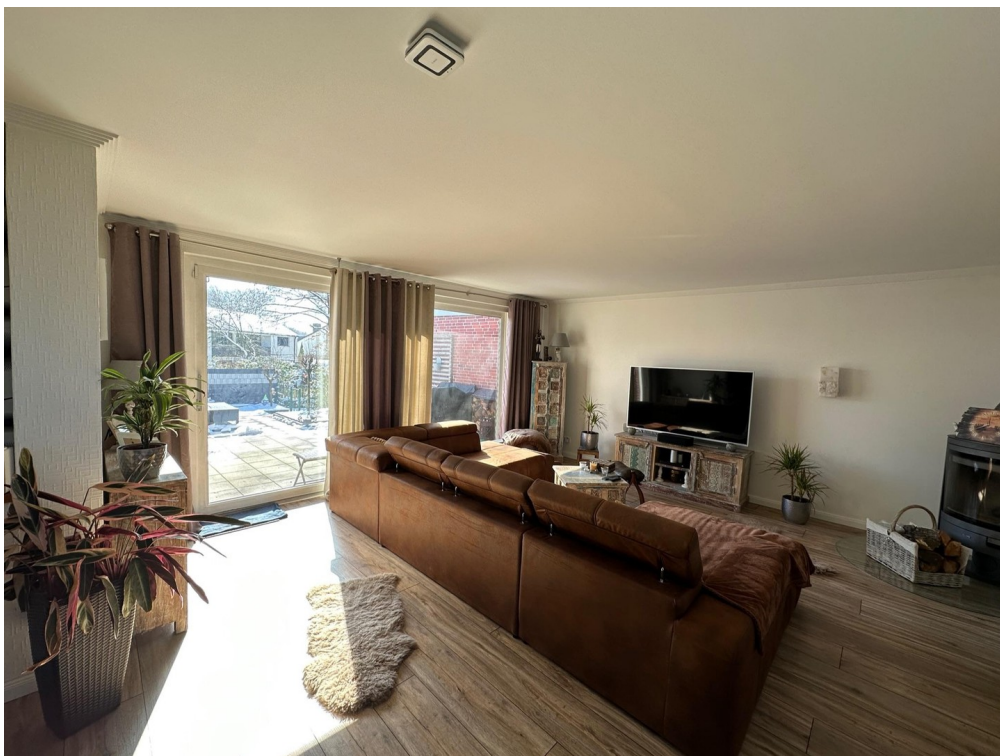
Wohnbereich mit großem Fenster