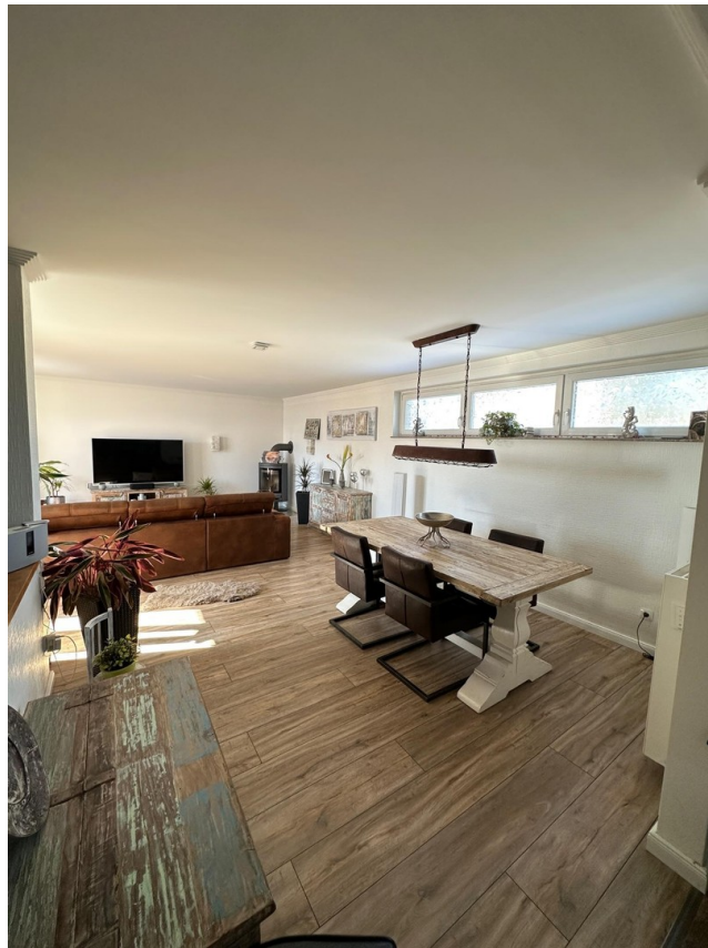
großzügiger Wohn- & Essbereich