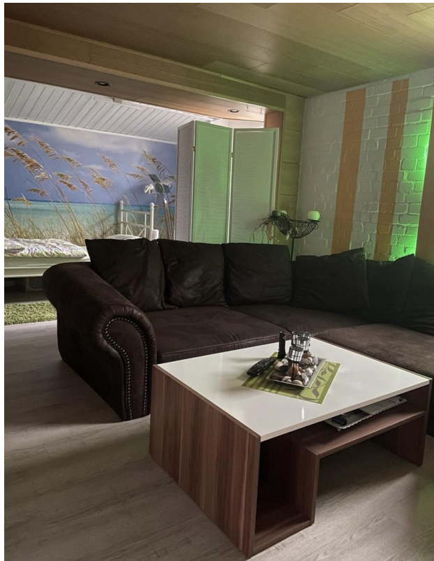
großes Gästezimmer im Keller