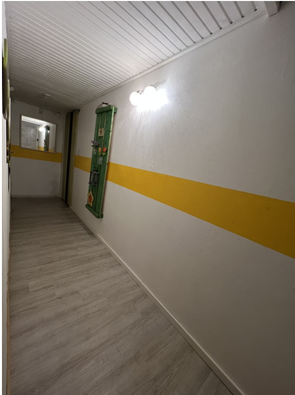
Flur im Kellerbereich