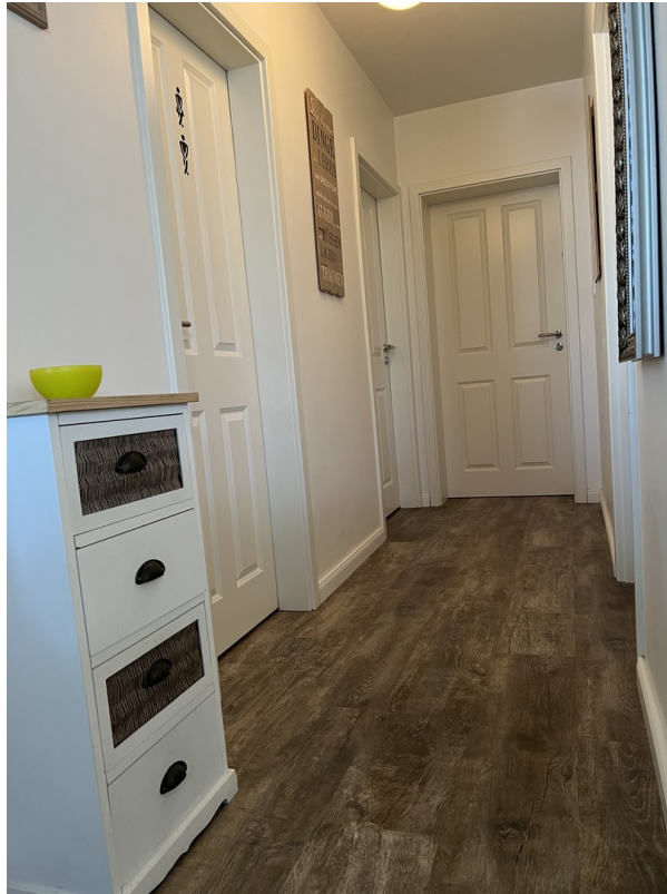
Flur hinterer Bereich