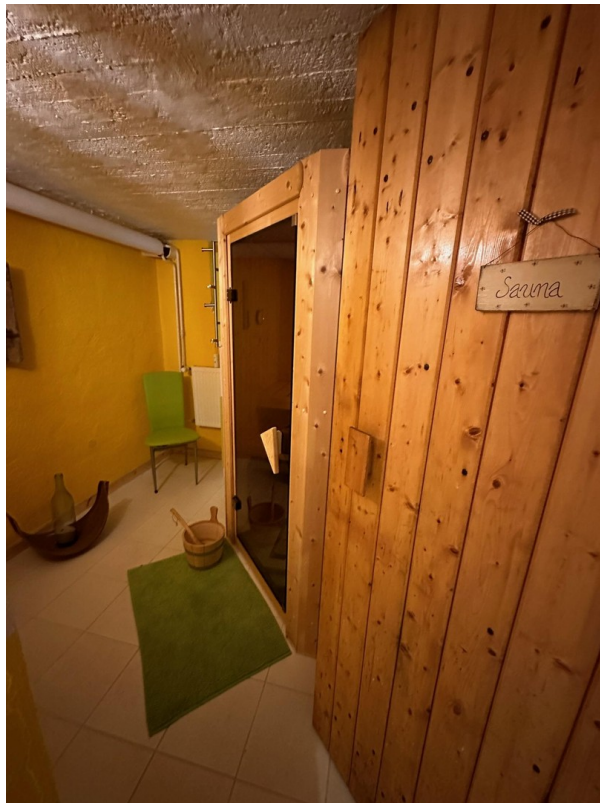
Sauna im Keller