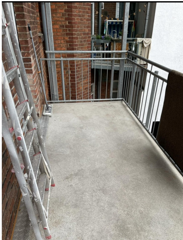
Balkon an der Küche