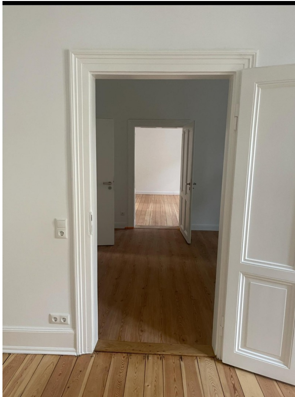
Blick aus dem Büro