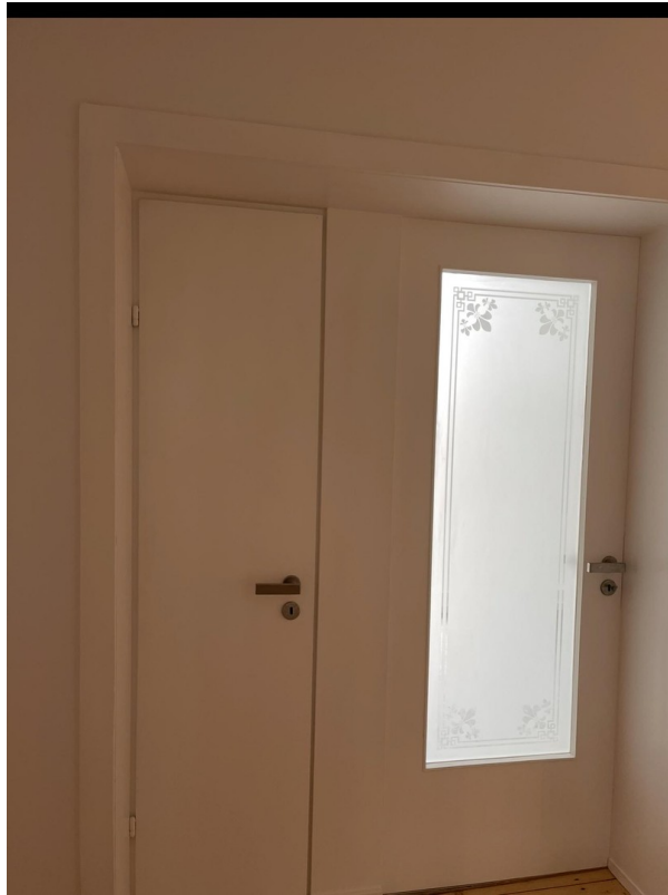
Vorratskammer u. Tür zur Küche