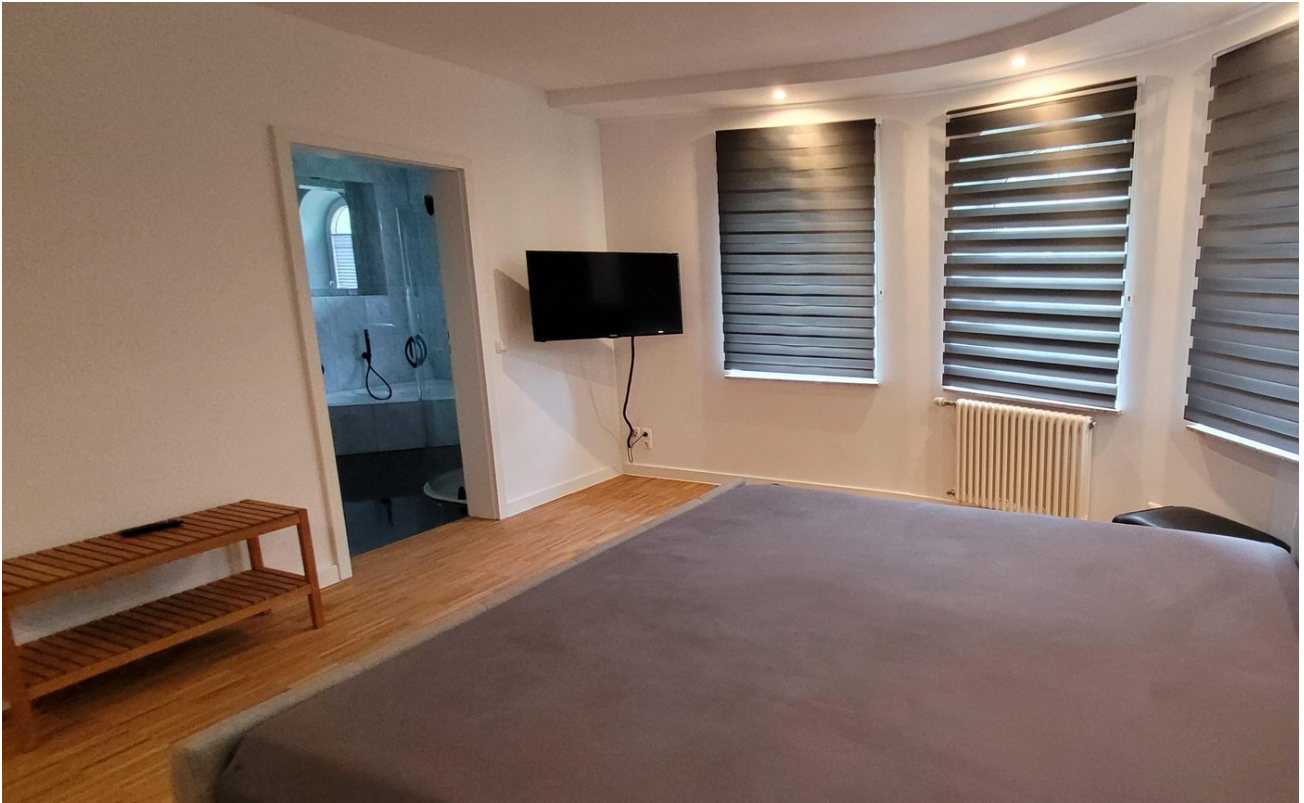
Zimmer EG 2