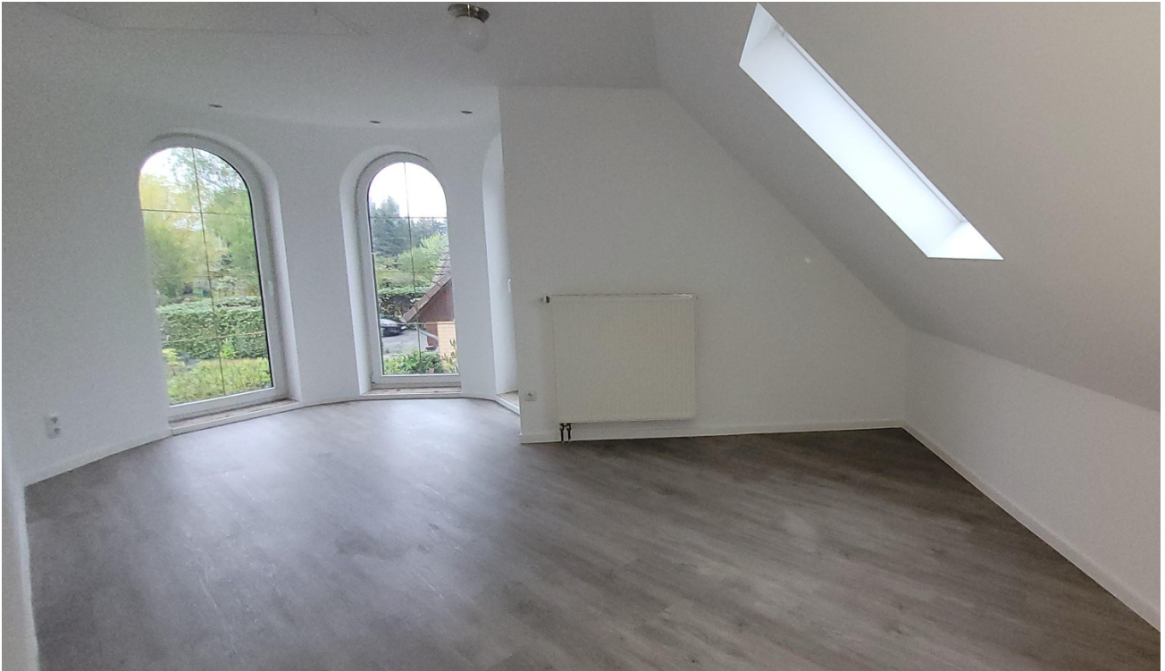
Zimmer 3 OG