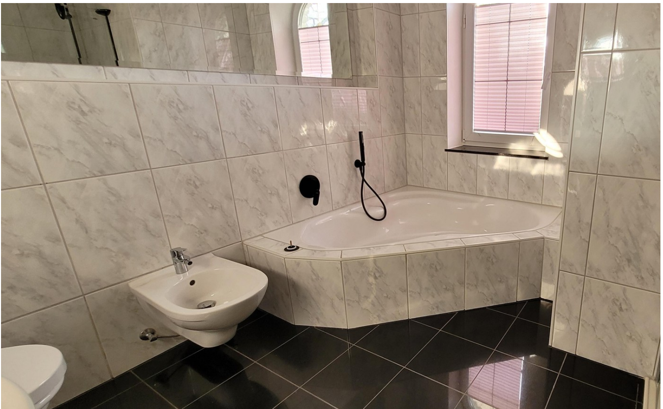
Vollbad EG 1