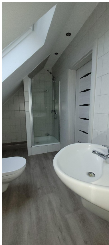
Duschbad OG 1