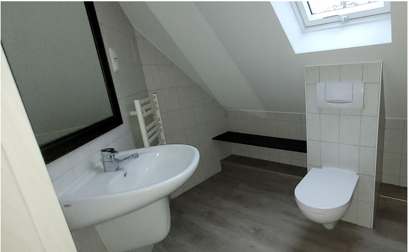
Duschbad OG 2