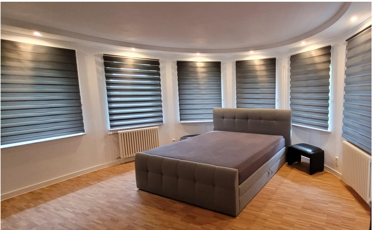
Zimmer EG 1