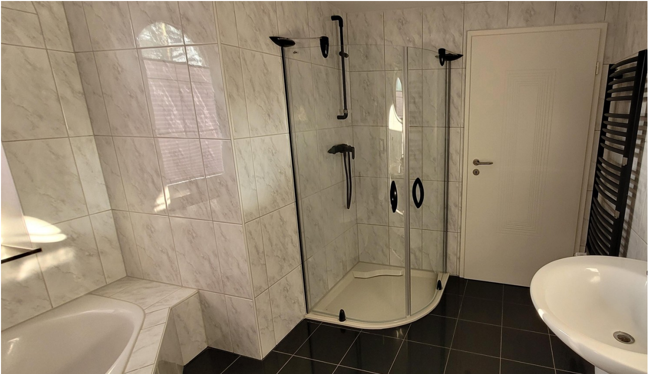
Vollbad EG 2