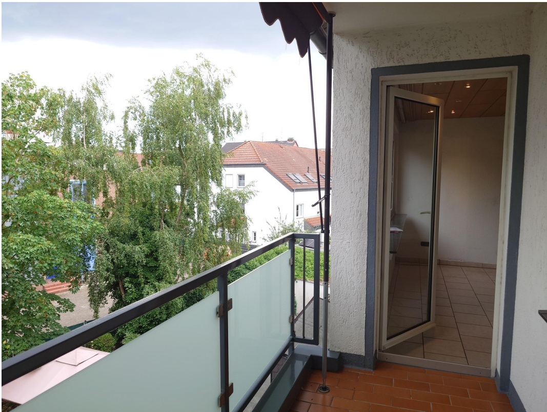
Balkon Blick ins Wohnzimmer