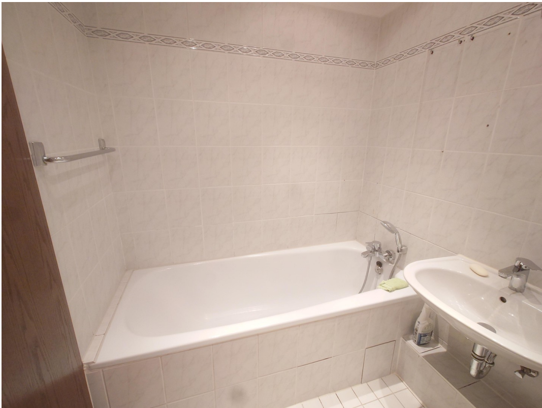
Badezimmer Bild 1