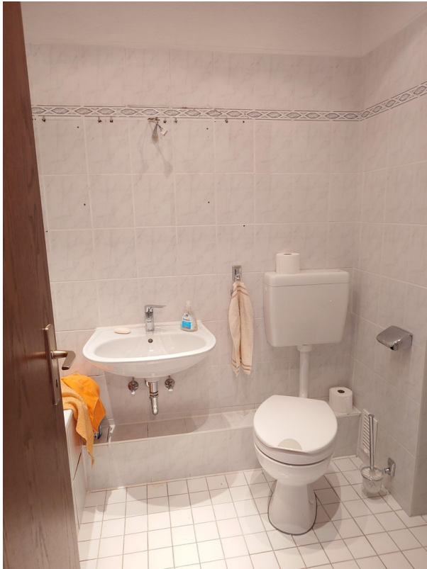
Badezimmer Bild 2