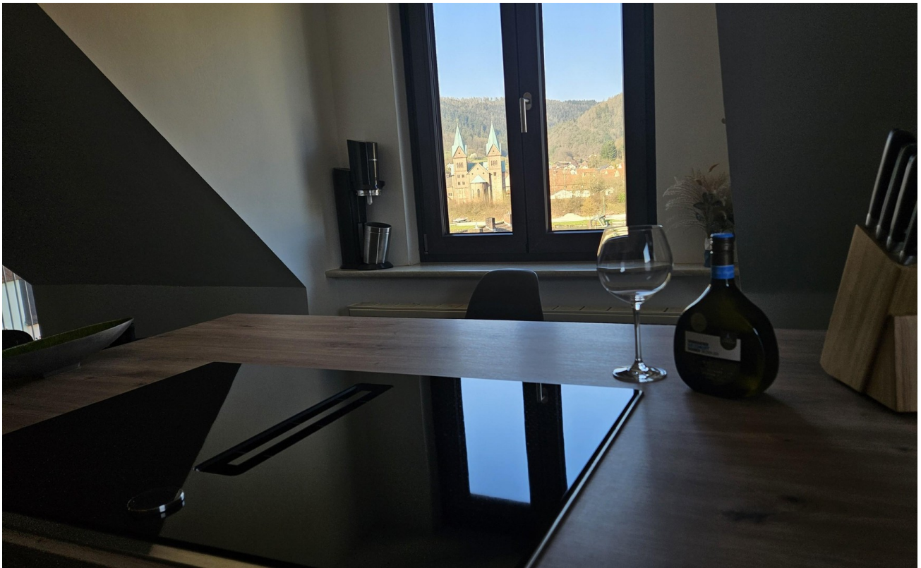
Kochen mit Mainblick