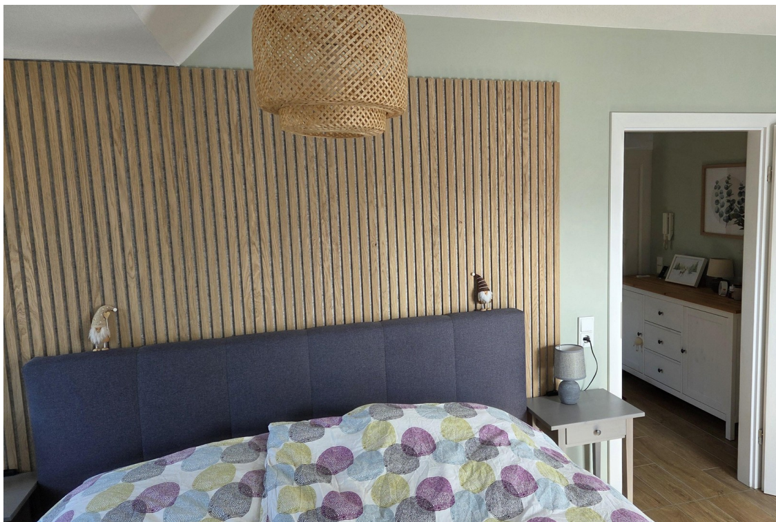
Schlafzimmer mit Mainblick