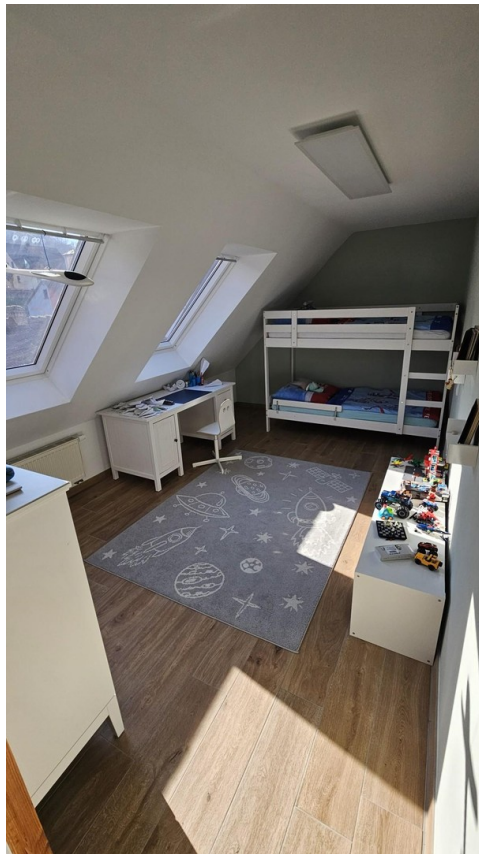
Kinderzimmer mit Dachfenster