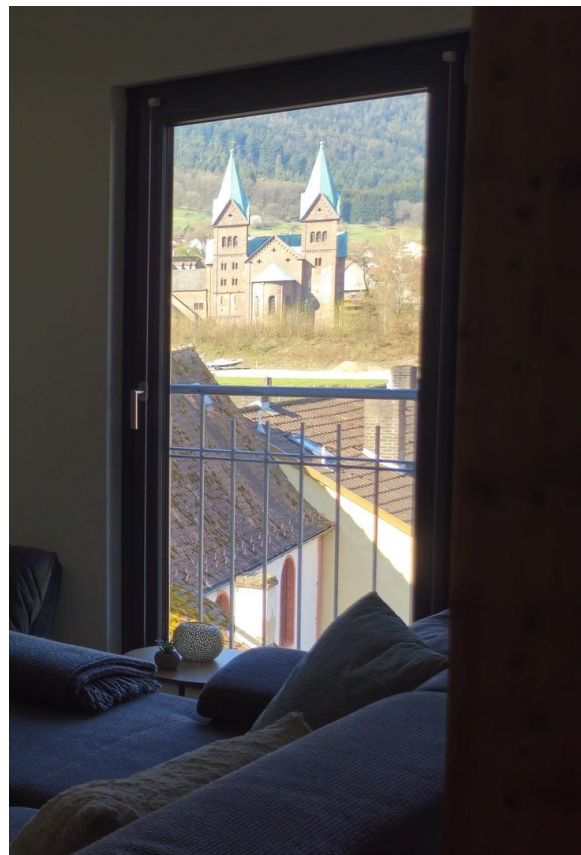
St. Michael und St. Gertraud