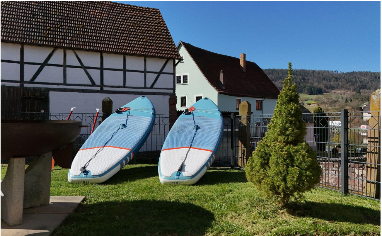
ab aufs Wasser