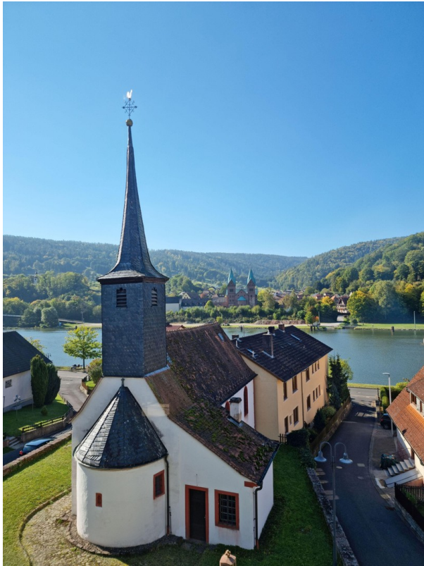
Mainblick vom Sofa