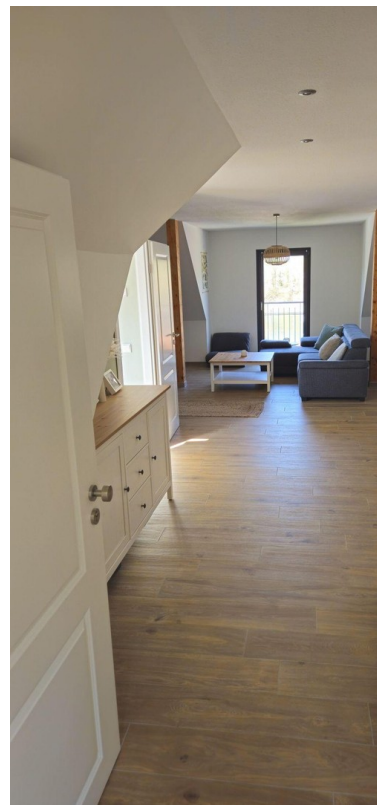
Eingangsbereich mit Mainblick