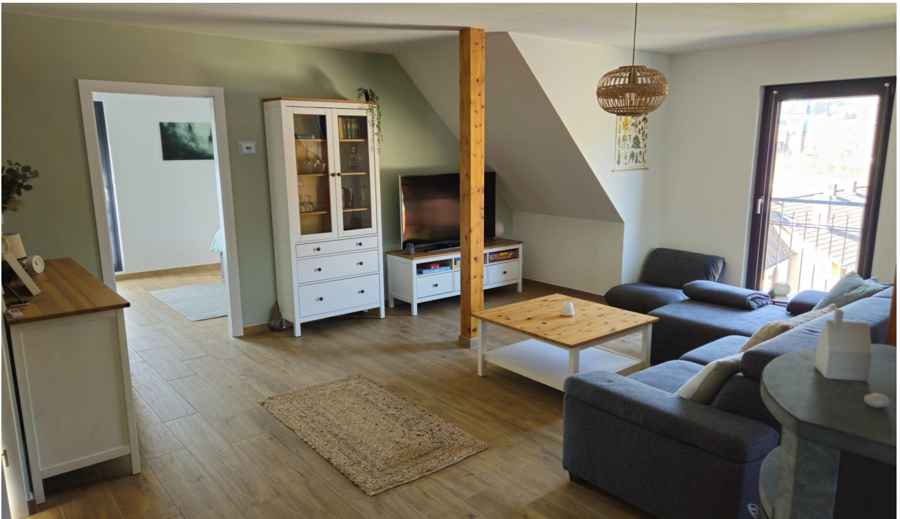
hell und ansprechend