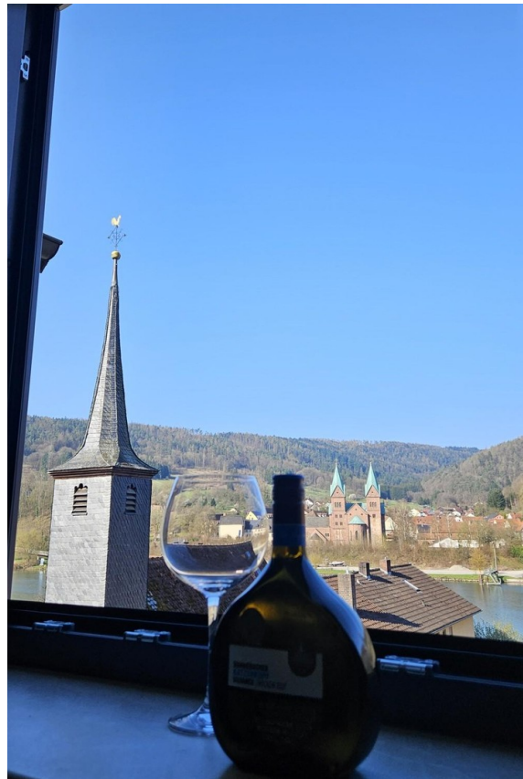
Zeit für Genuss