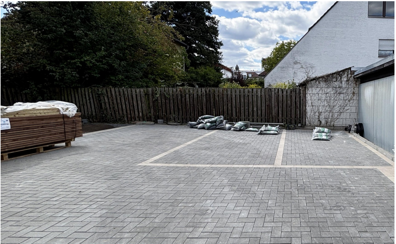
Hinterhof mit Stellplätzen