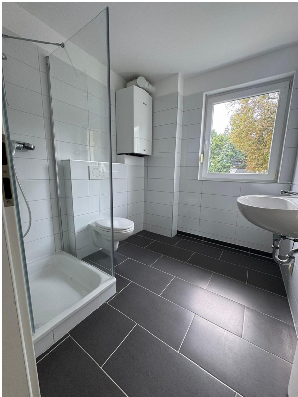
2. Bad mit Dusche und WC