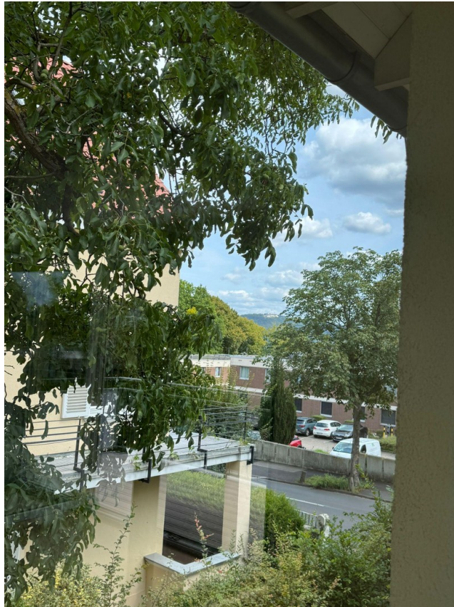
Ausblick auf den Petersberg