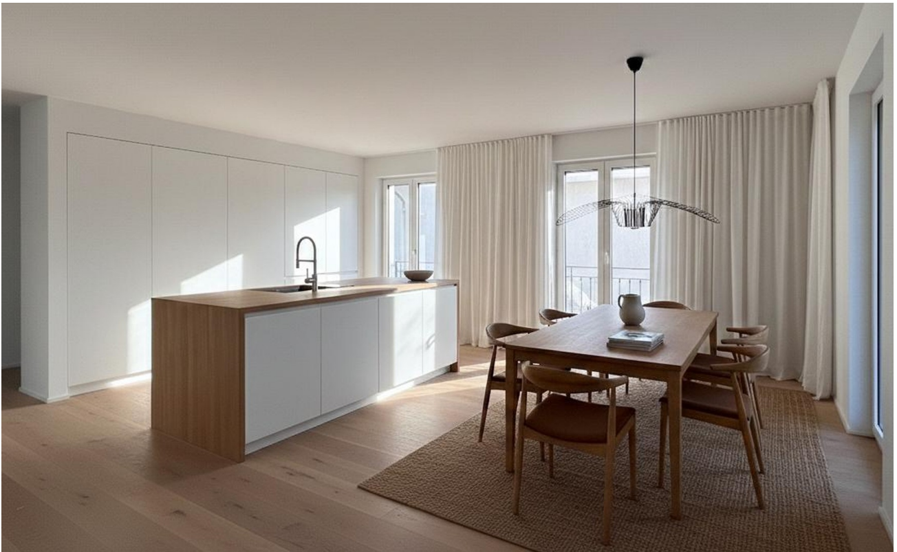
Visualisierung Küche u. Wohnen