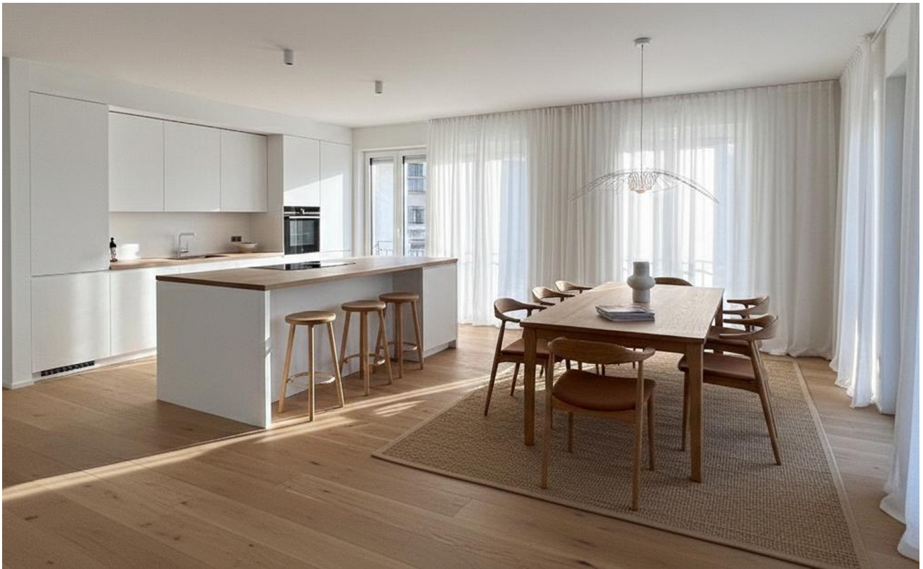
Visualisierung Küche u. Wohnen