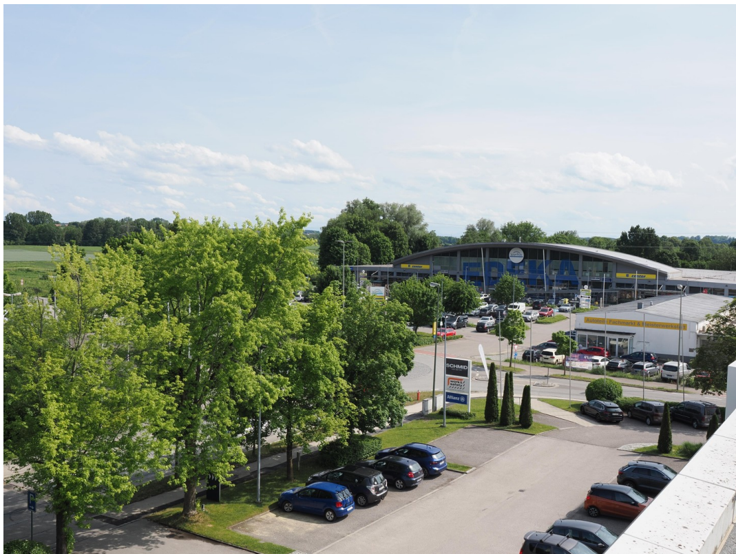
Blick Richtung E-Center