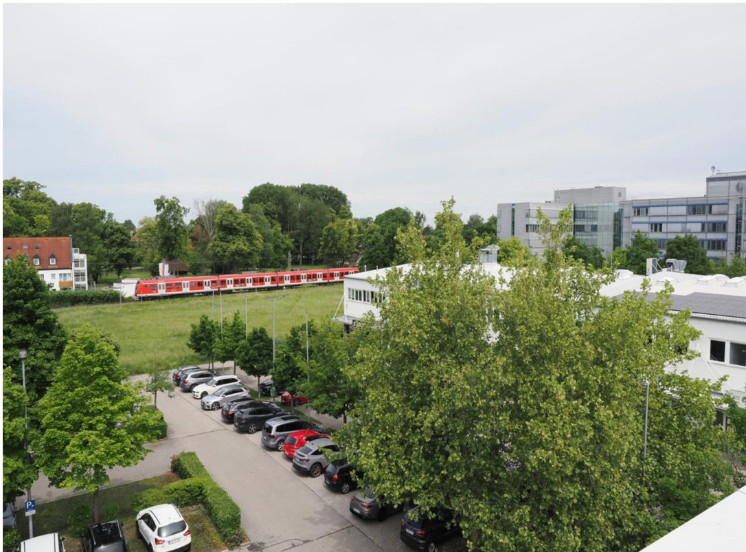
Direkte S-Bahn Anbindung S2