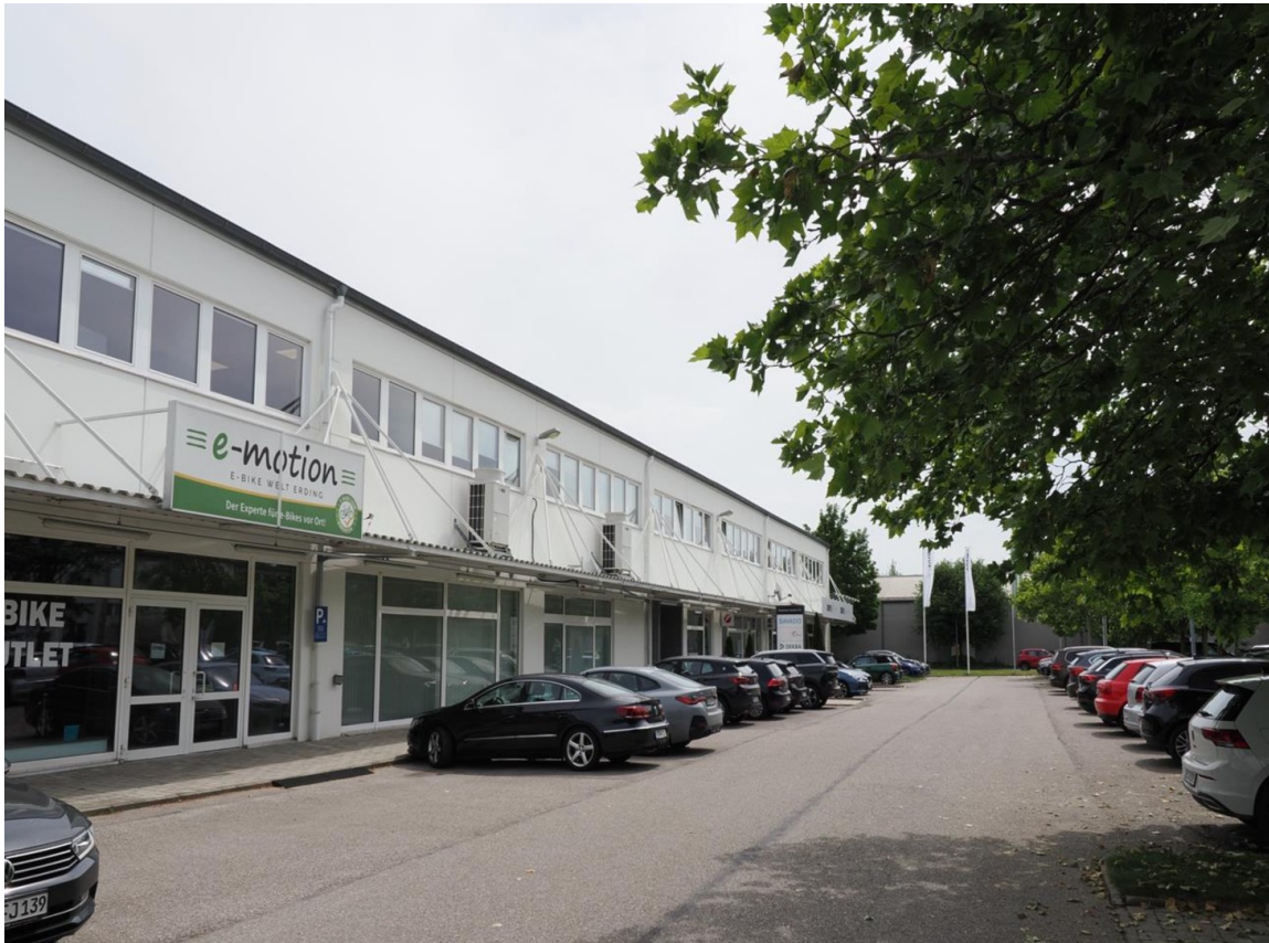
Freie Mietflächen im EG