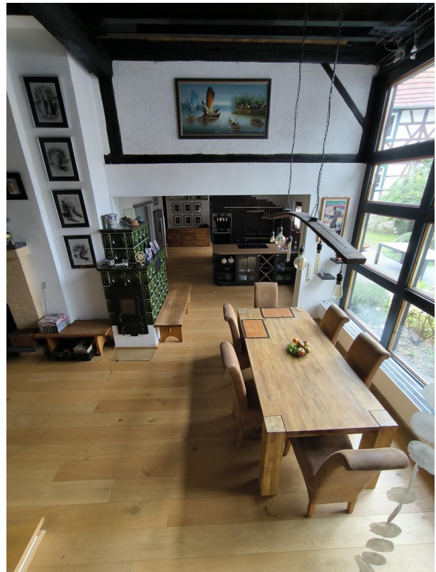
Blick ins WHZ