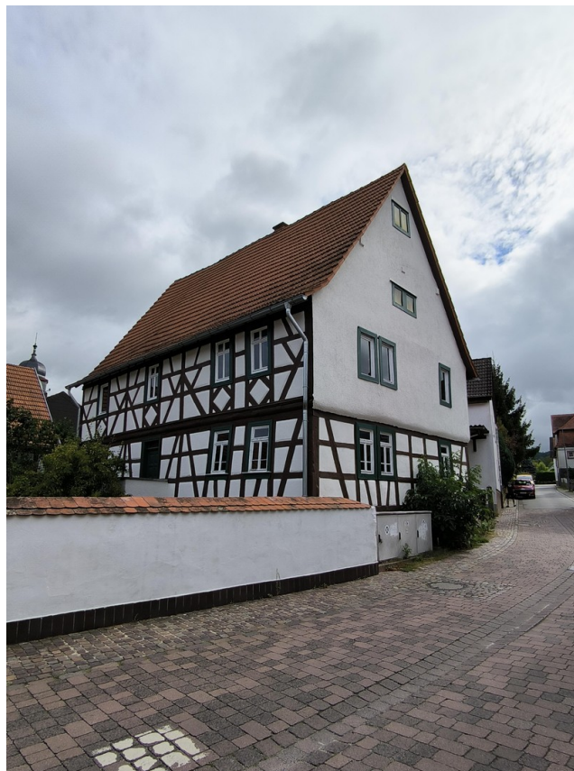
Ansicht 1 Strasse