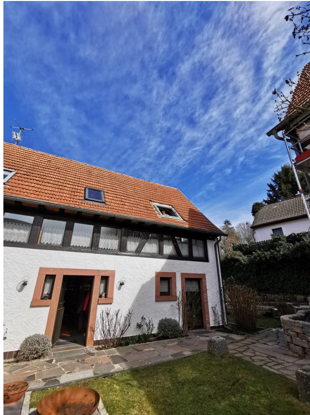
Ansicht Innenhof 4