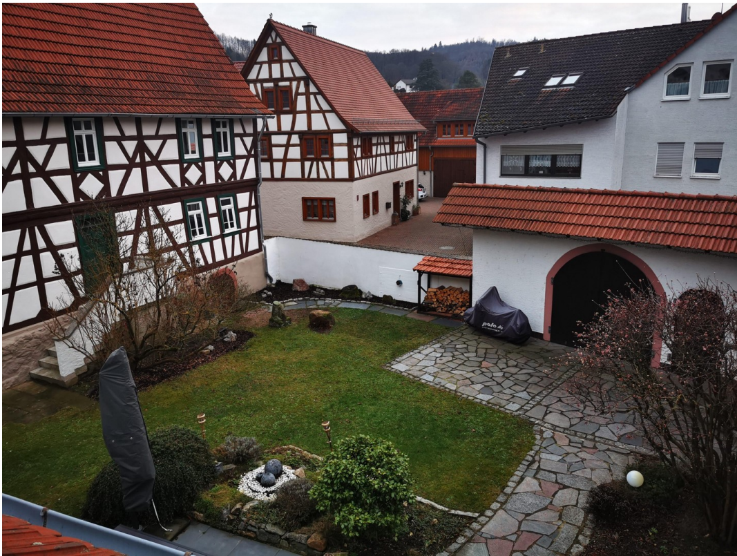
Blick in den Innenhof