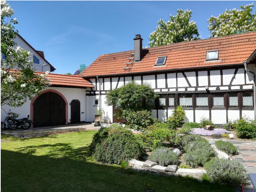
Ansicht Innenhof 2