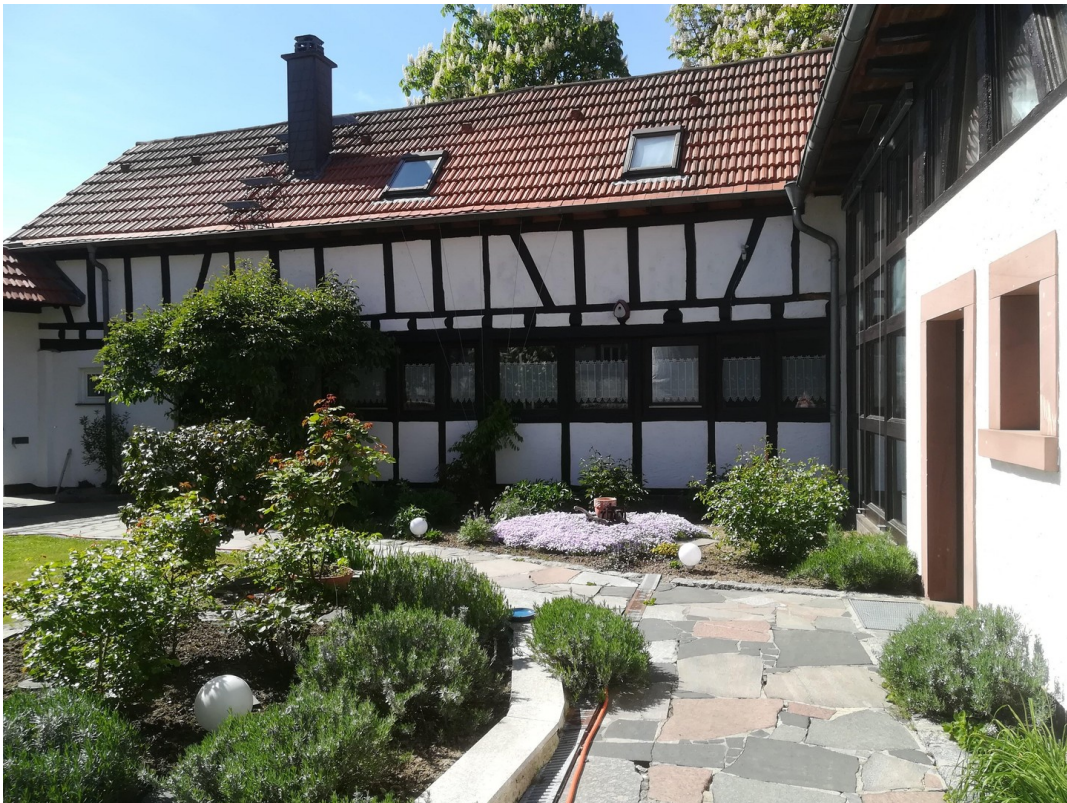
Ansicht Innenhof 3