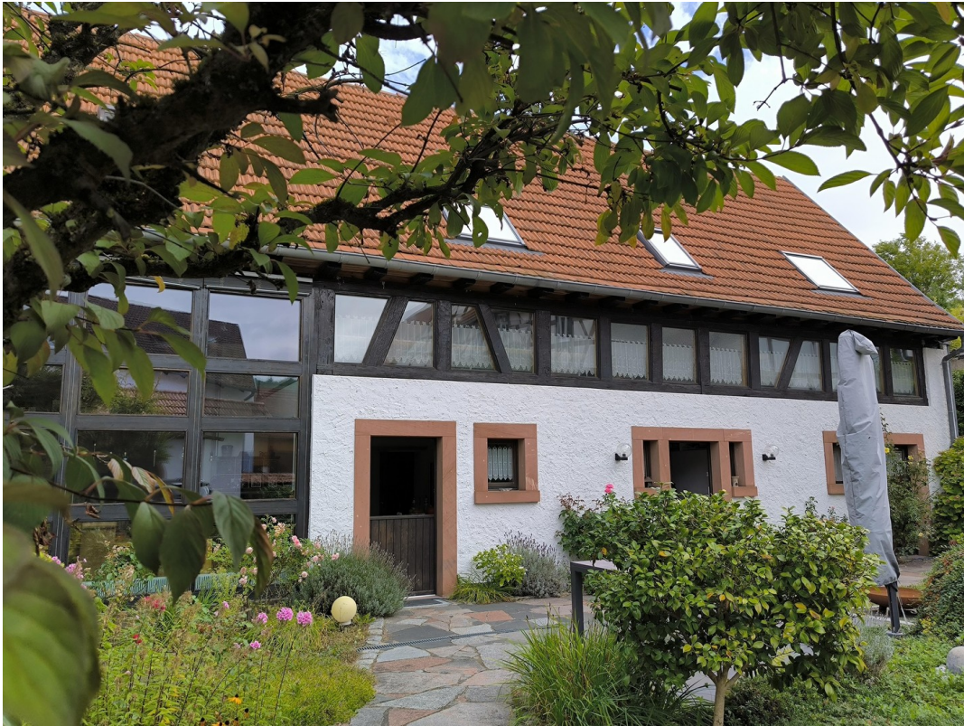
Blick in den Innenhof