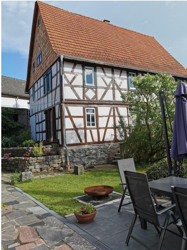
Ansicht Innenhof 5