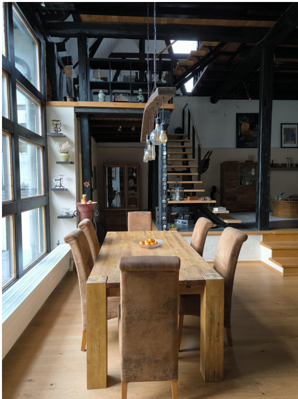
WHZ / Essen