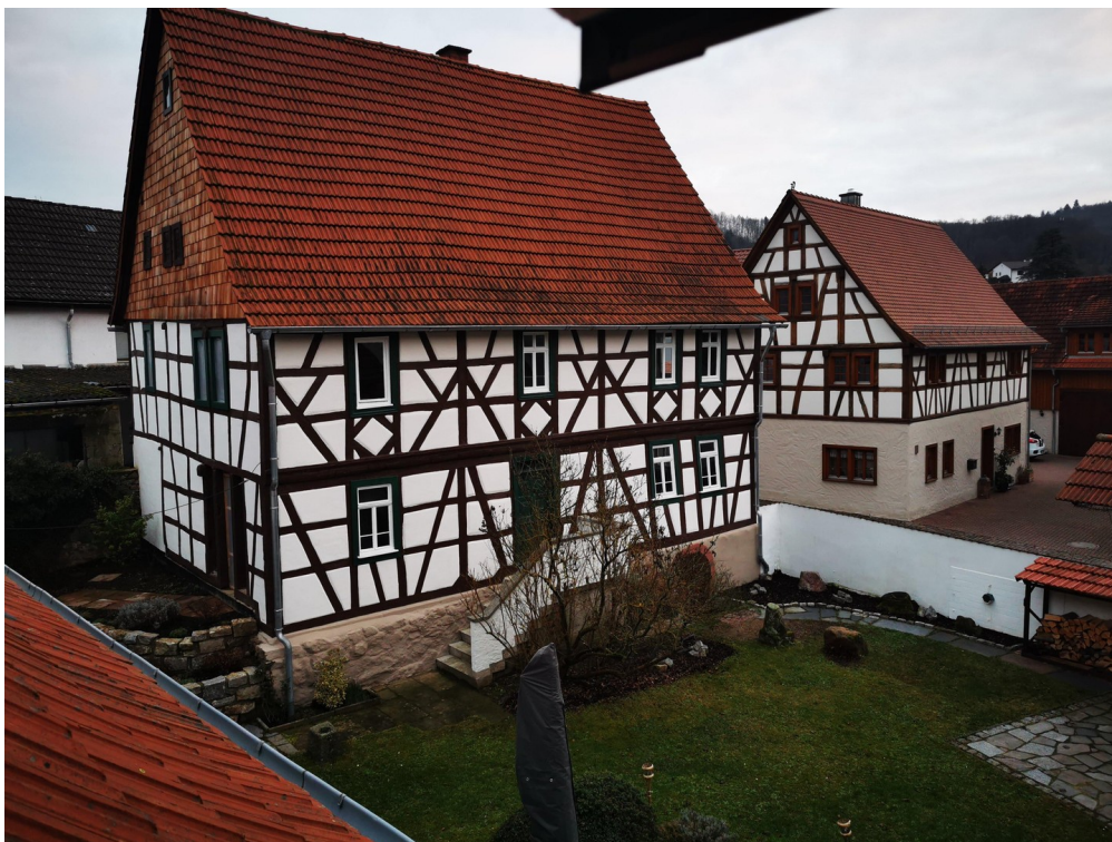
Ansicht separates Fachwerkhaus