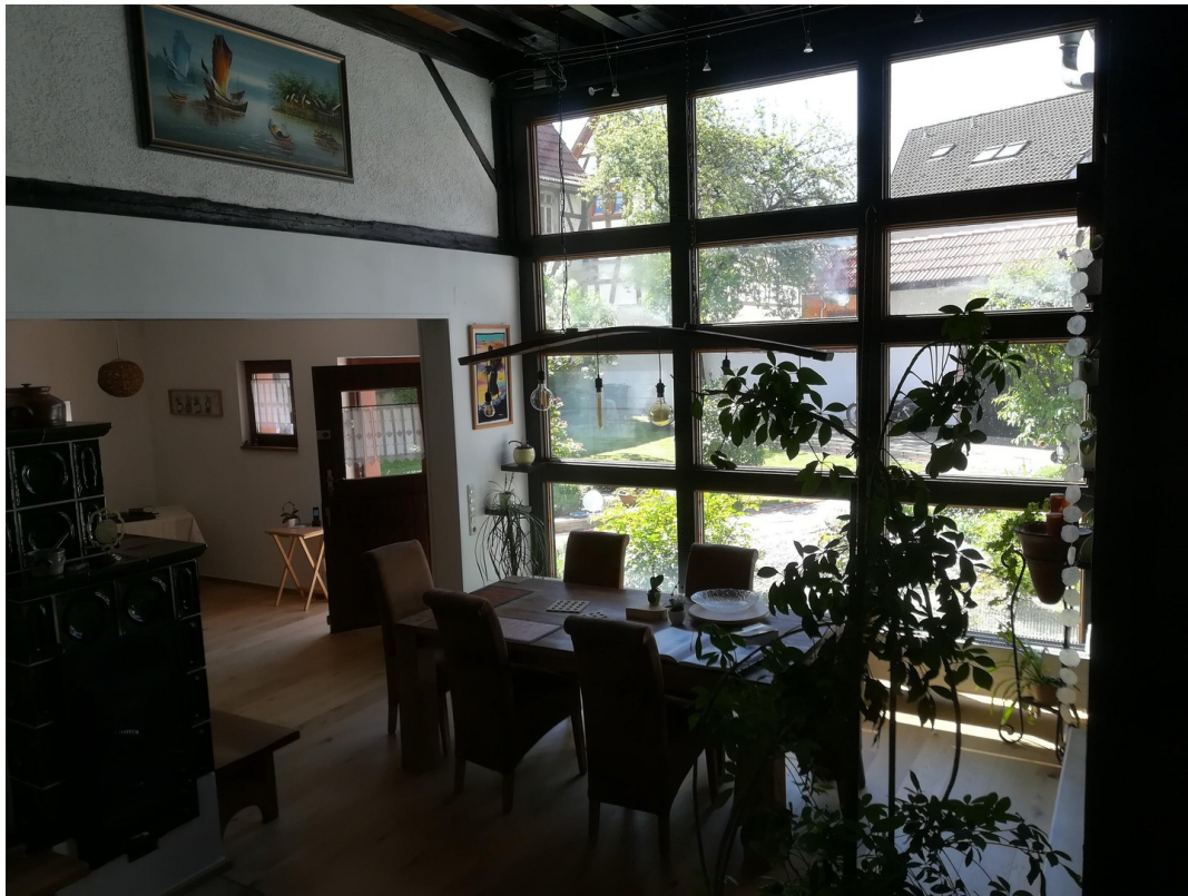
Blick in den Innenhof