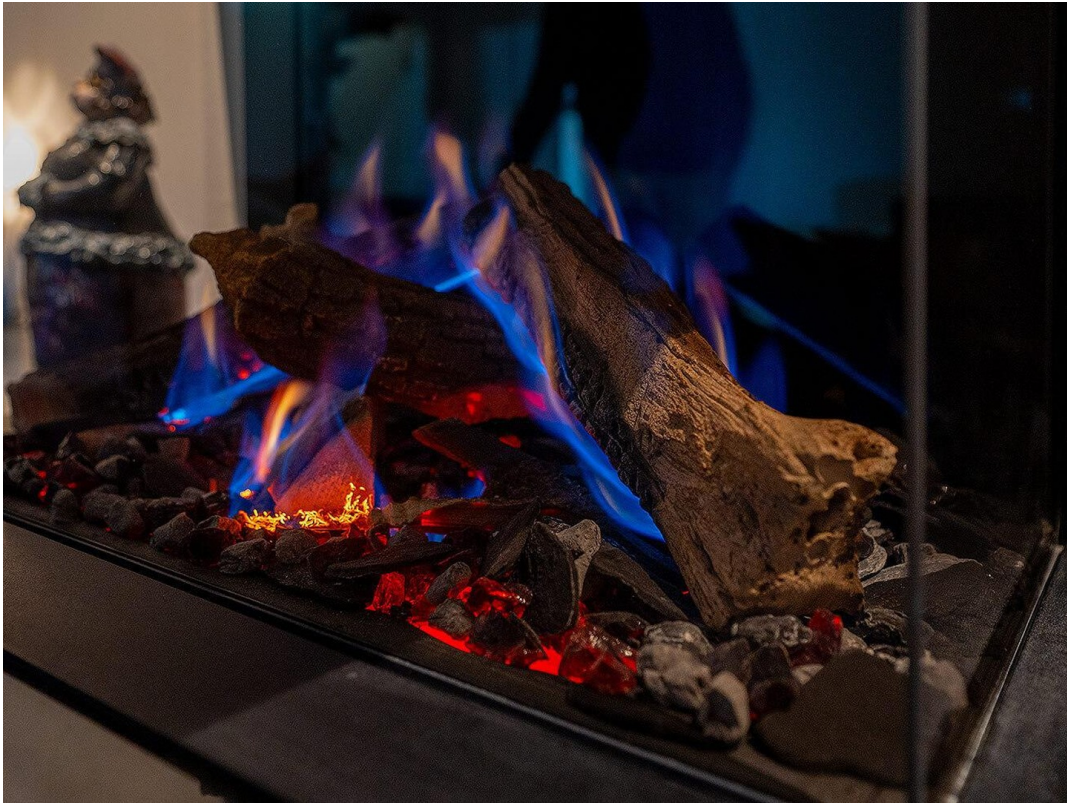
Es wird gemütlich