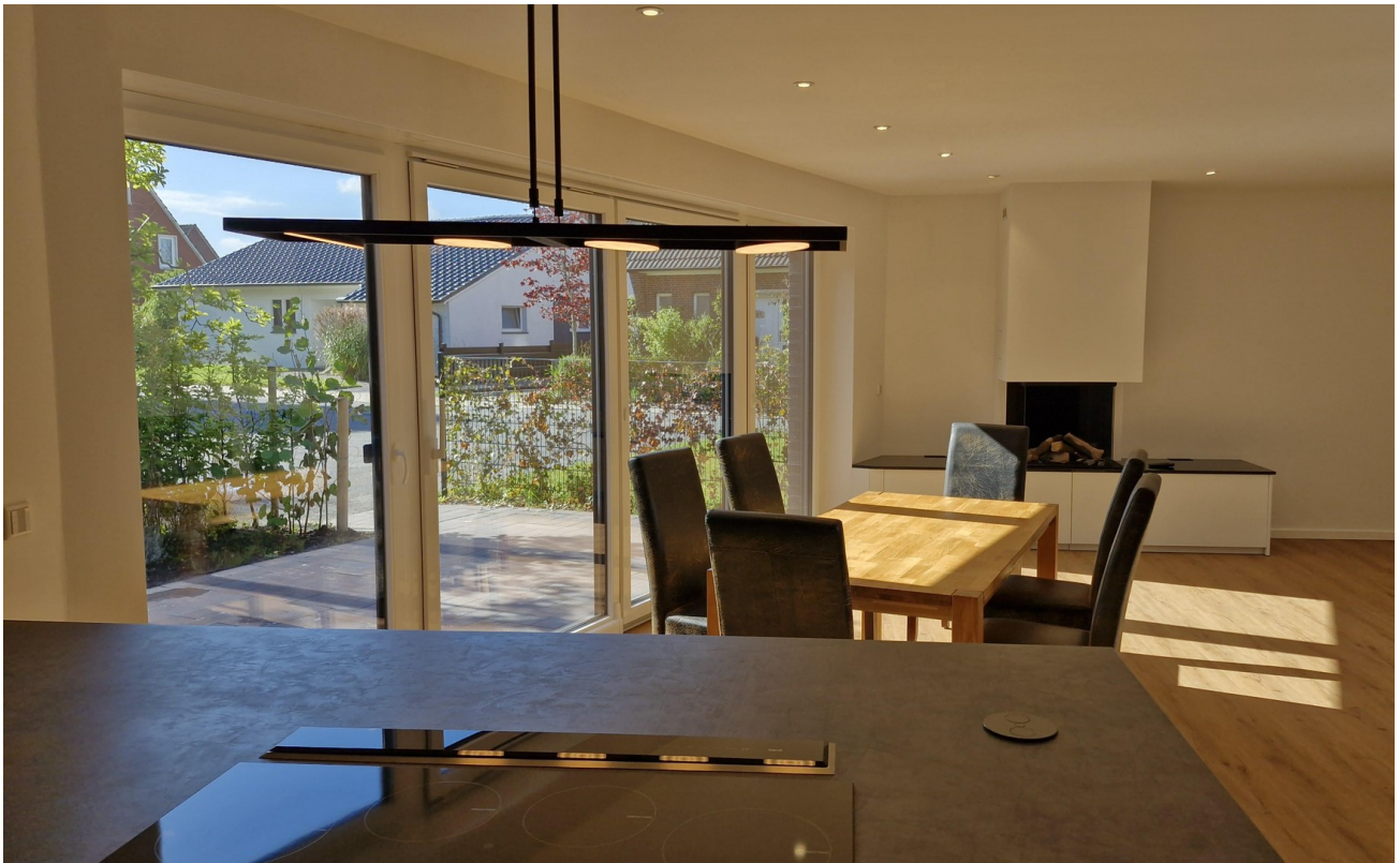
Blick von der Küche