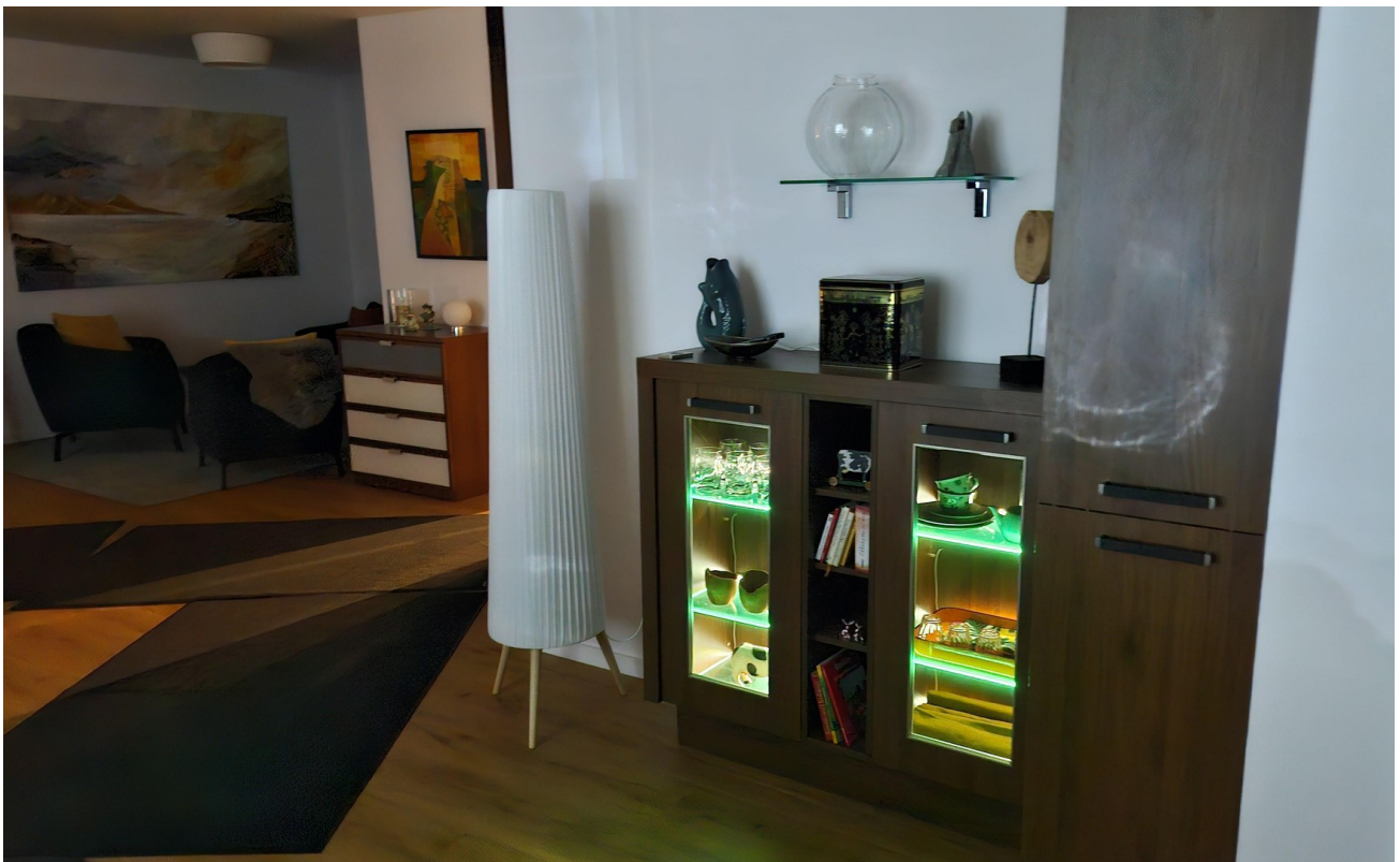
Apothekerschrank u. Anrichte