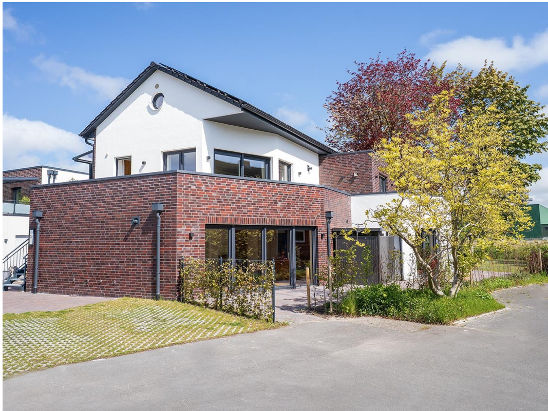
Von vorne mit PKW-Stellplatz