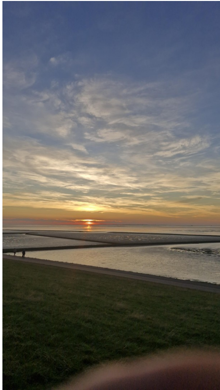
Abendspaziergang am Deich