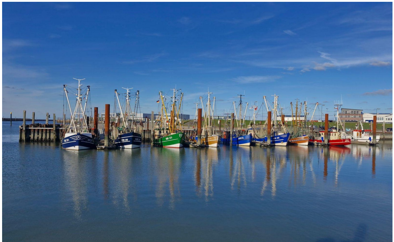
Der Kutter- u. Fährhafen