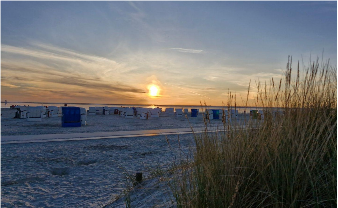
Der Strand ist nicht weit