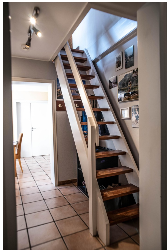
Treppenaufgang zum Dachzimmer