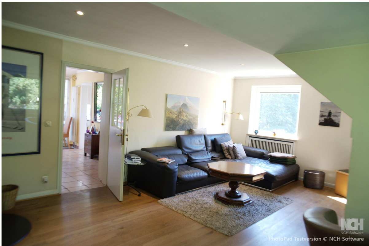
Wohnzimmer Blick Tür