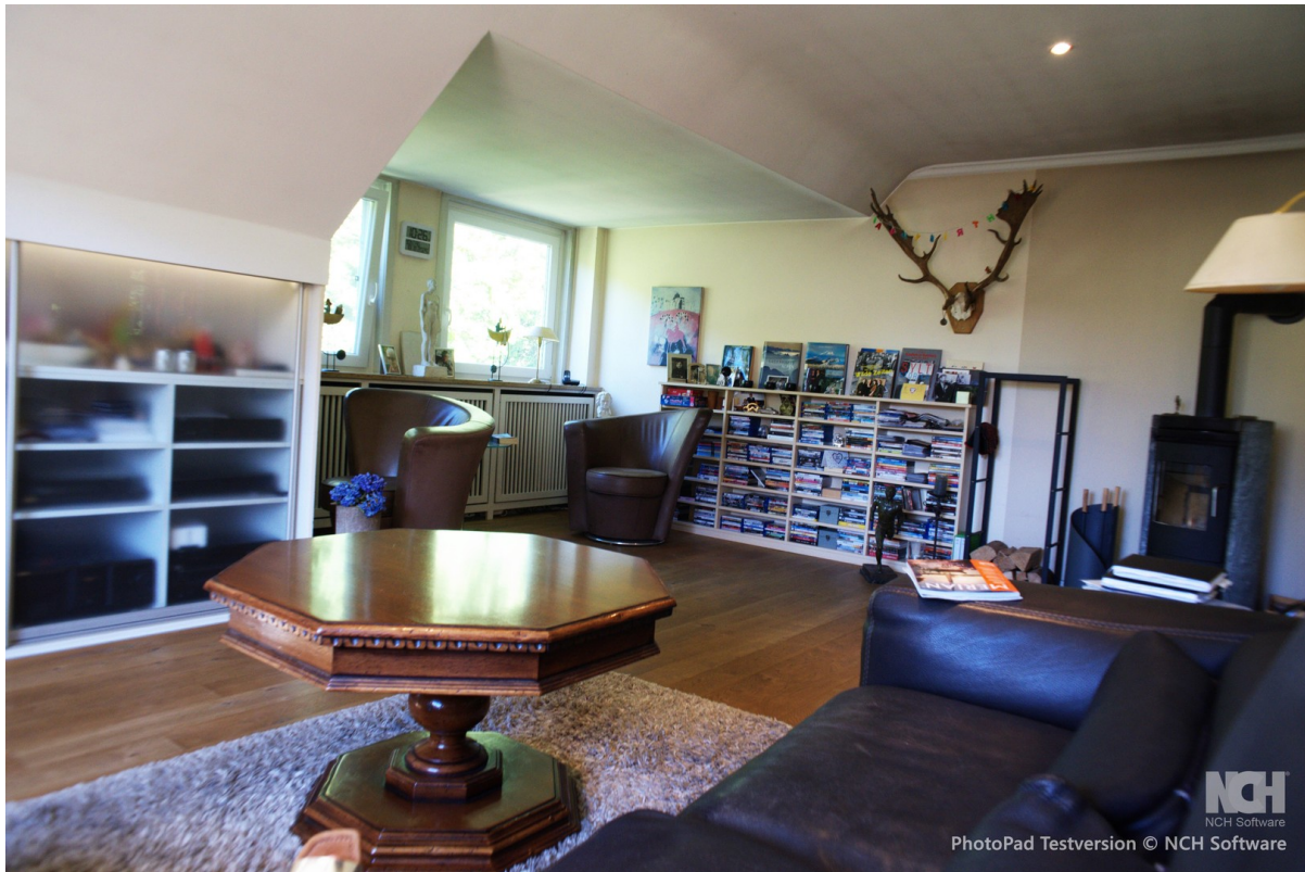
Wohnzimmer Blick Fenster