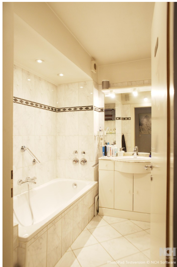
Badezimmer + Dusche