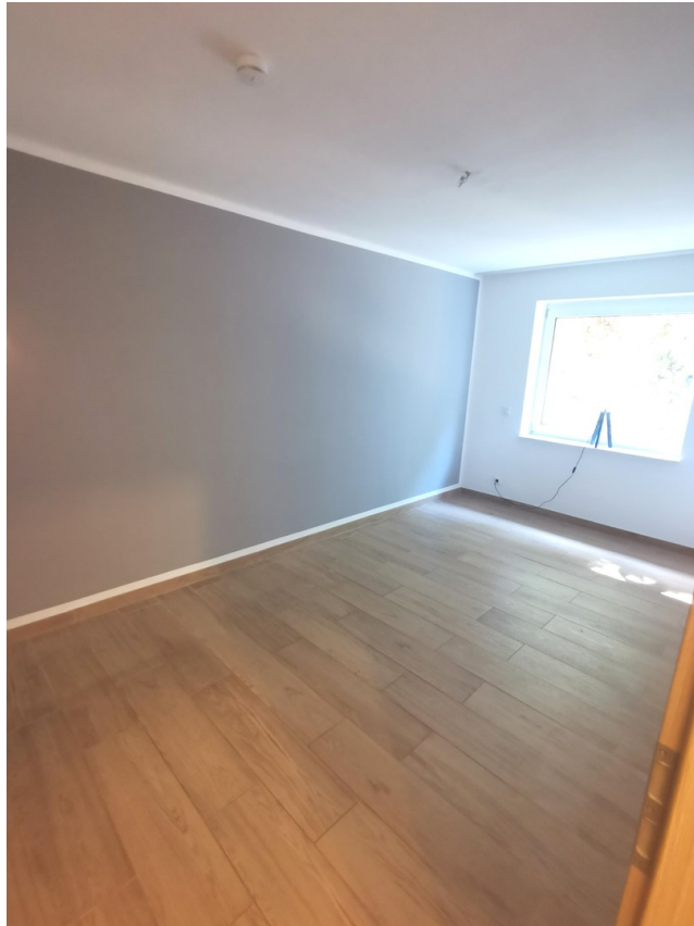
Kind 2 EG.