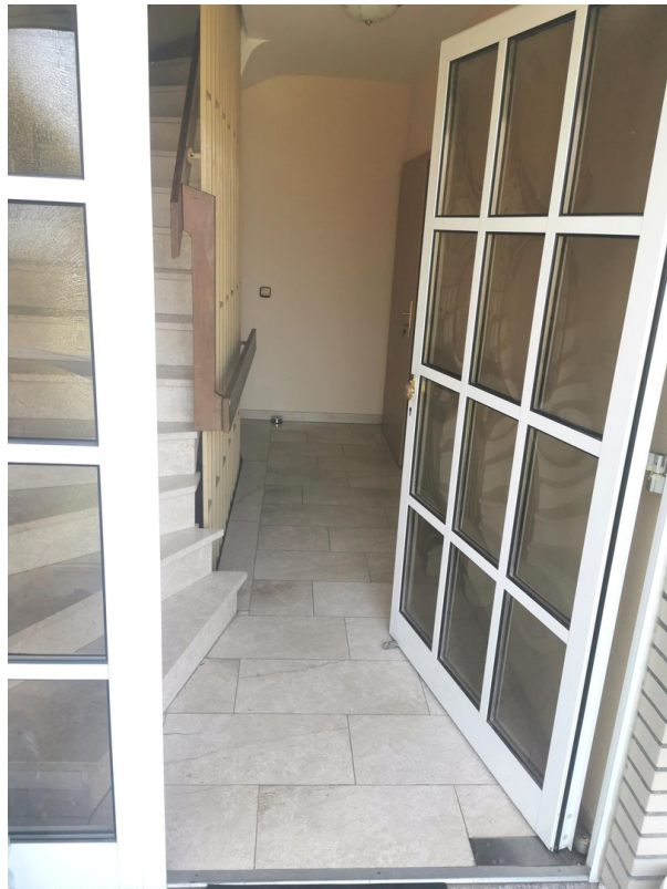
Eingang nach Windfang