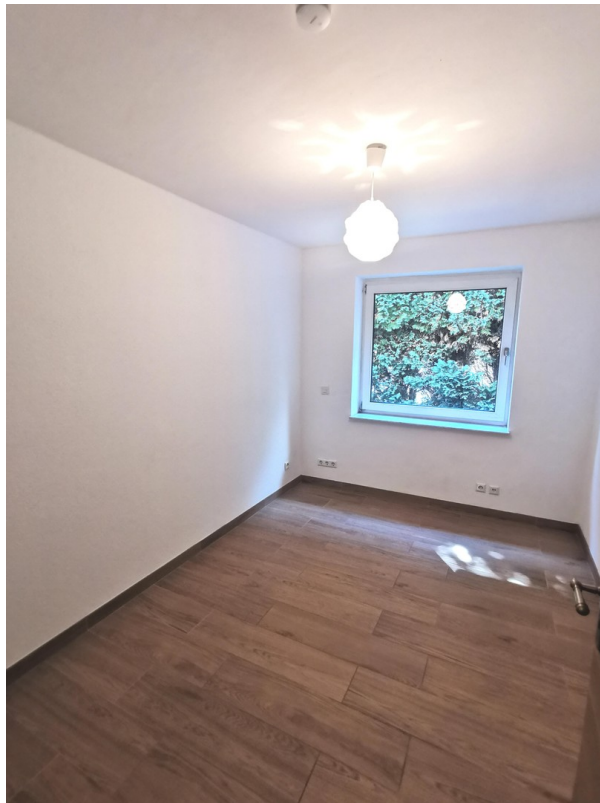
Kind 1 EG.