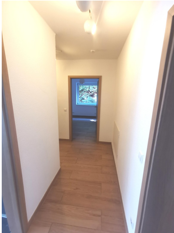
Flur hintere Räume EG.