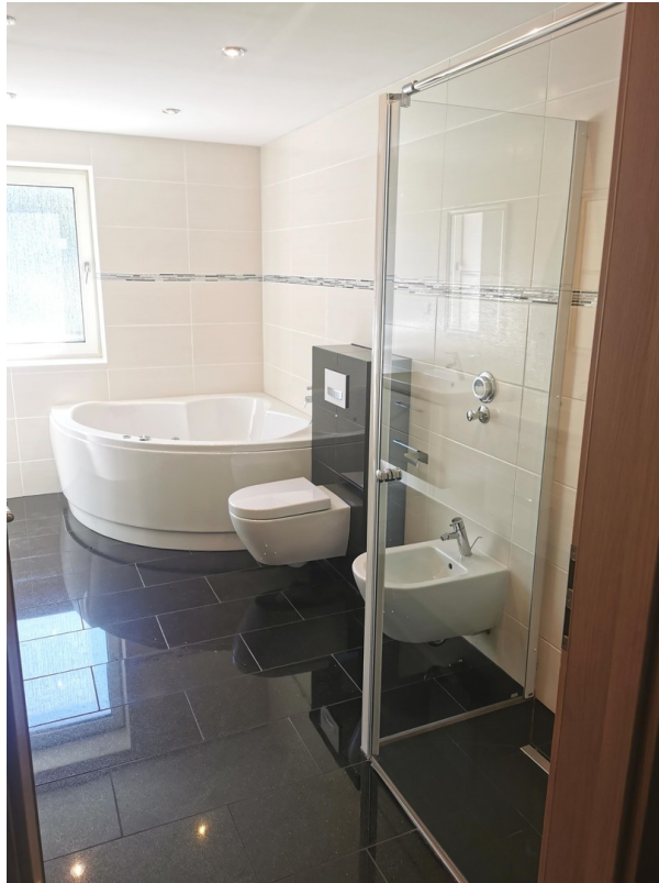
Masterbad Granitboden EG.