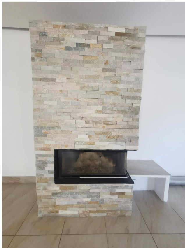
Kamin 10 KW EG.