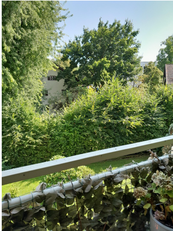
vom Balkon aus