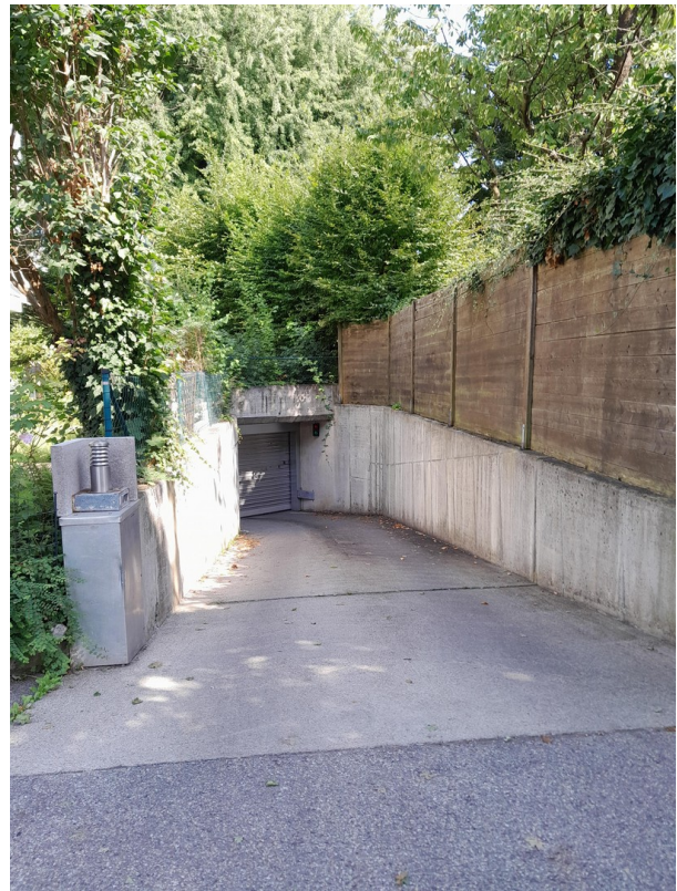
Zufahrt zur Tiefgarage