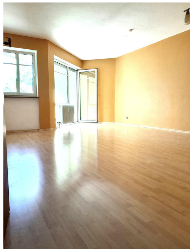
Wohnzimmer mit Balkontüre