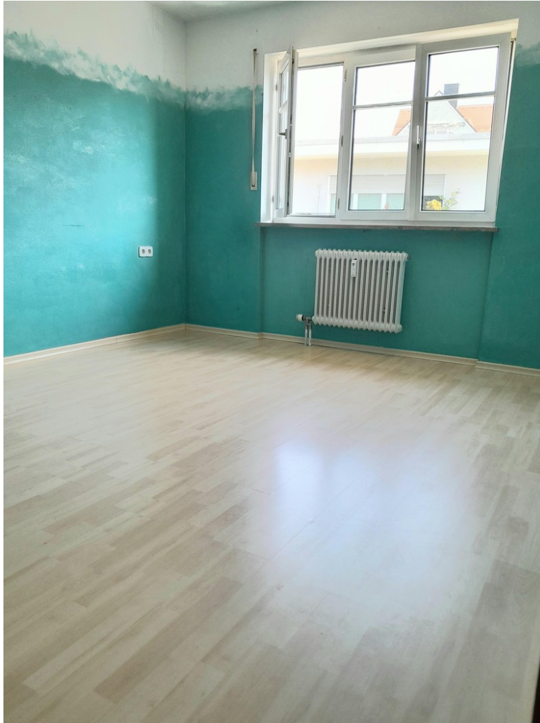
Schlafzimmer, kühle Nordseite