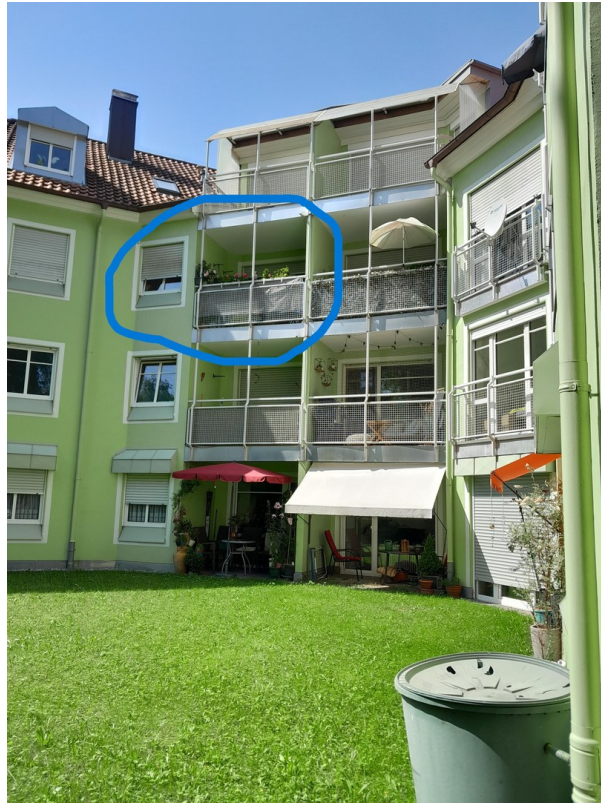
Rückansicht mit Loggia-Balkon