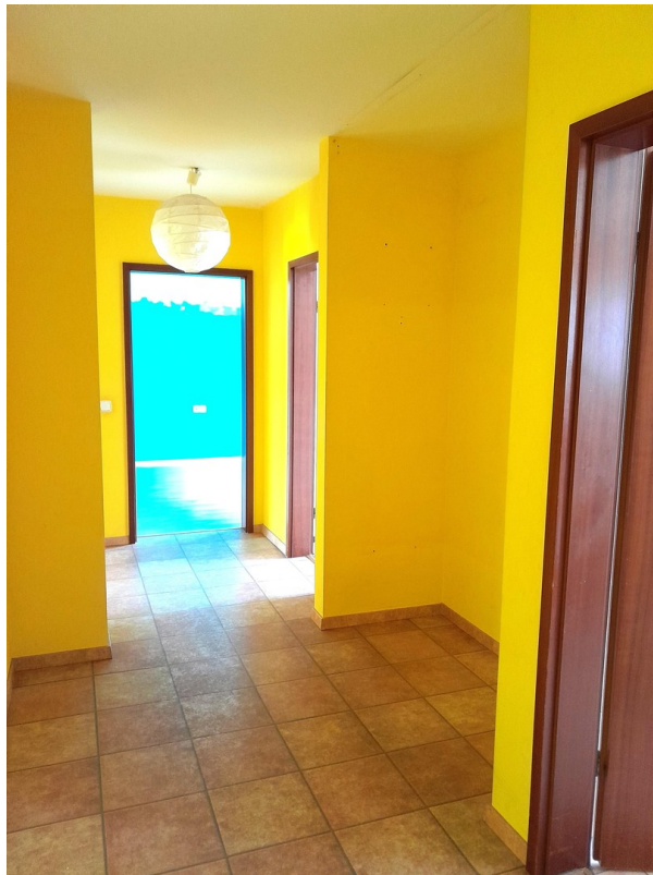
Flur mit Nische