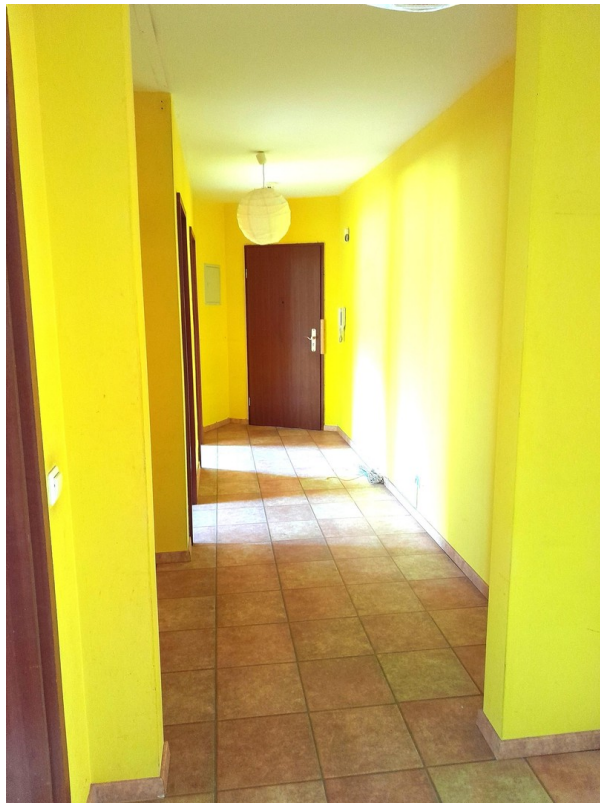
Flur mit viel Platz