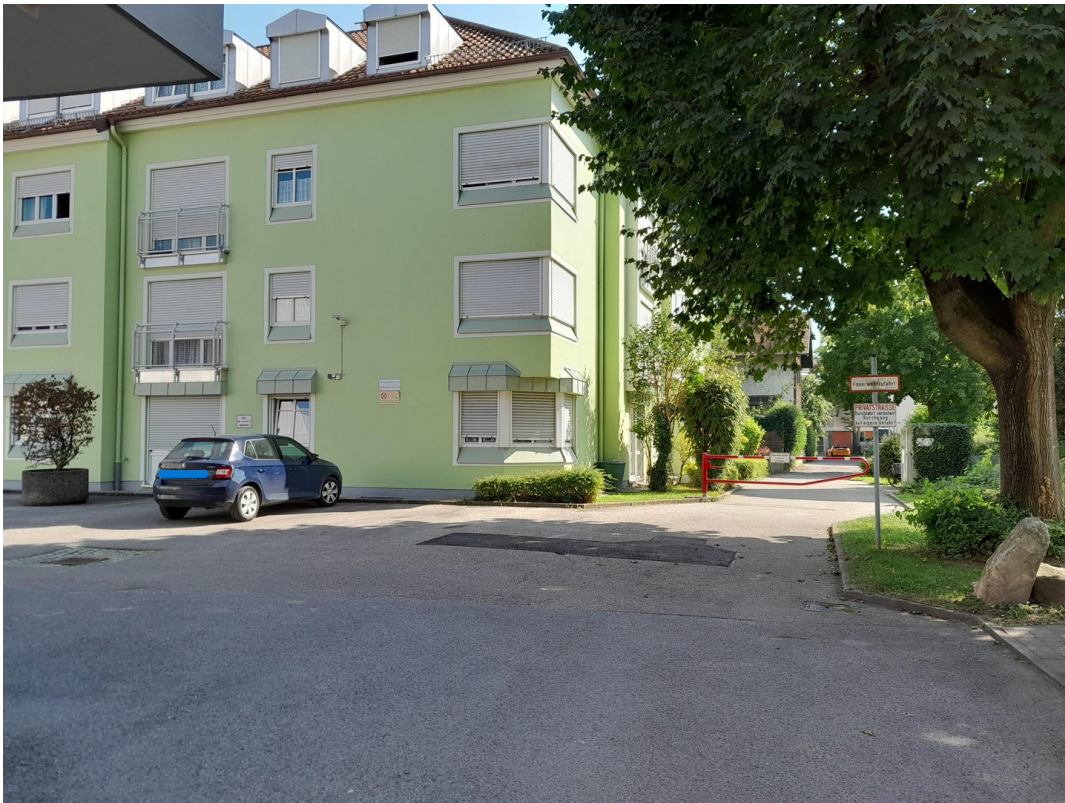
Stellplätze vorm Haus