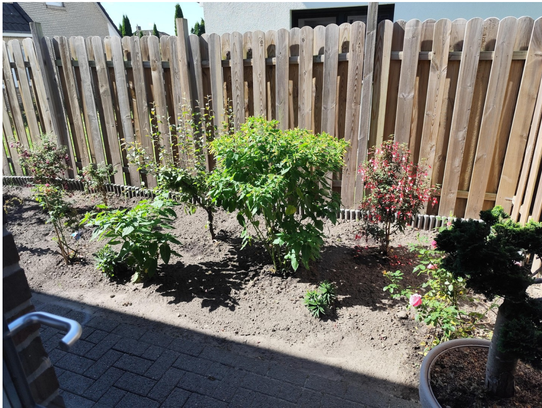
Beet vorm HWR und Küche