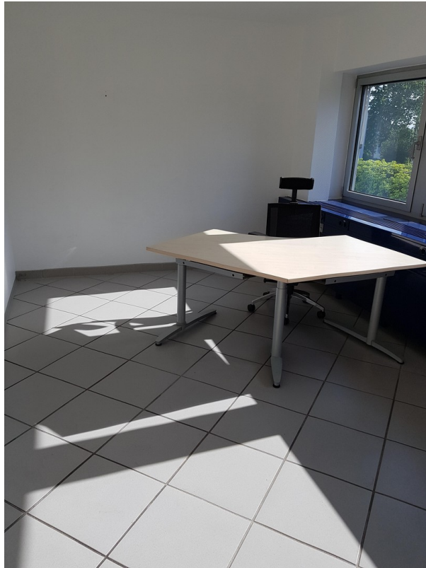
Beispiel Büro 1