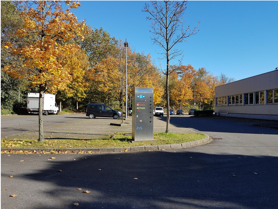
Einfahrt und Parkplätze