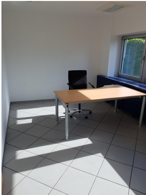
Bispiel Büro 2