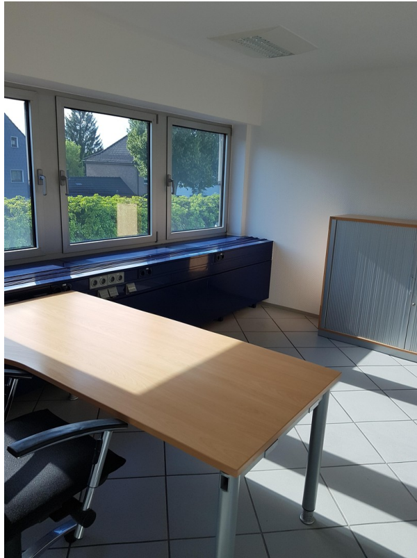
Beispiel Büro 3