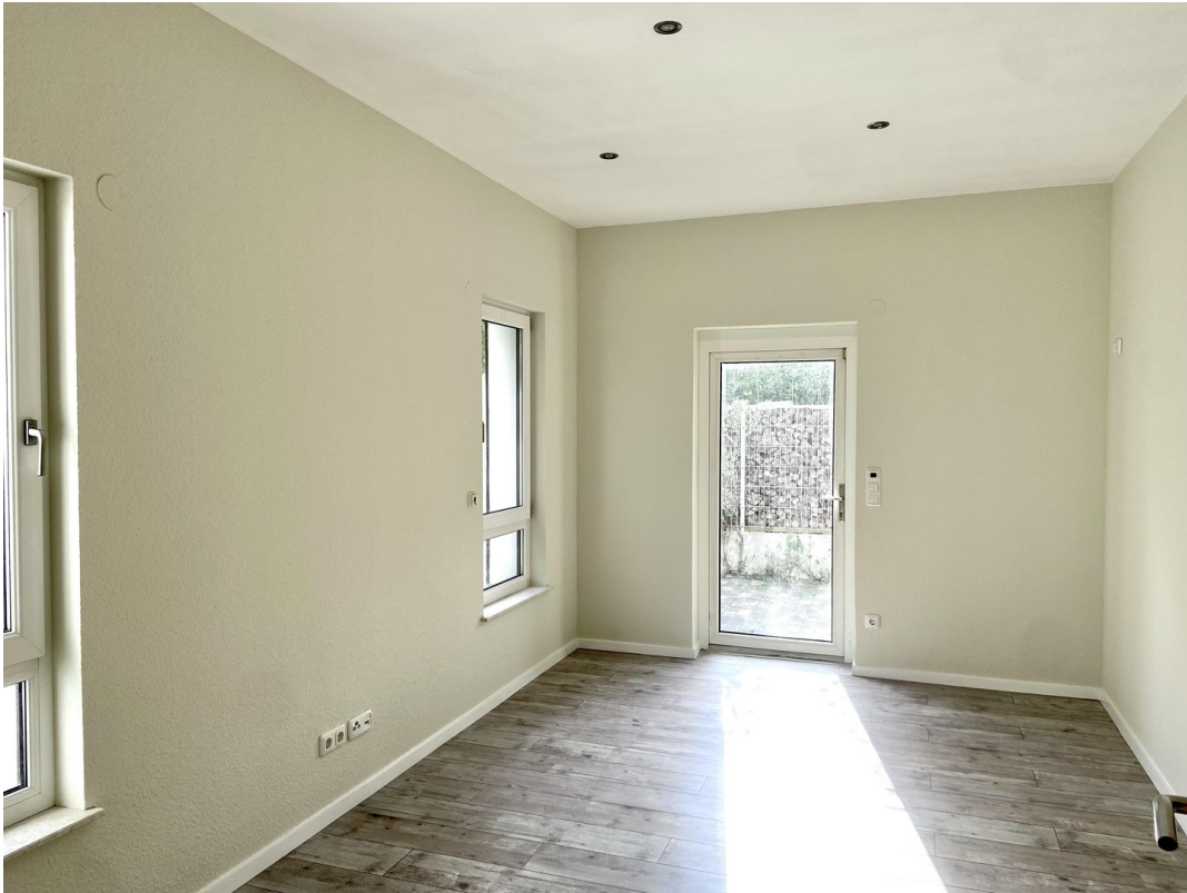
Kzi 2 mit Laminat + Tür Foto 1