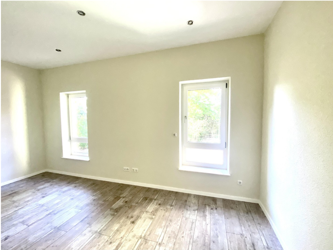
Kzi 1 mit Laminat Foto 1