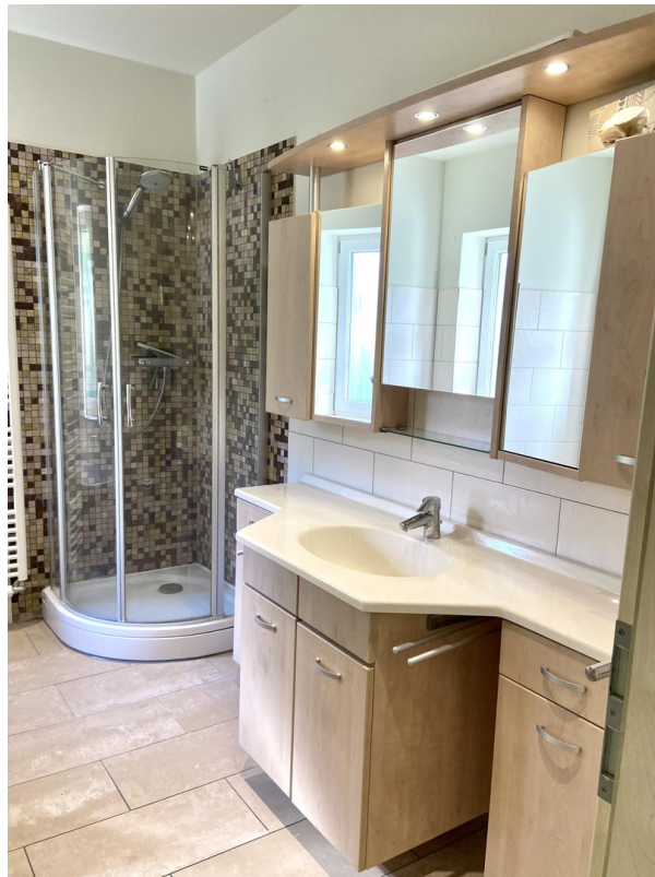
Bad Foto 2