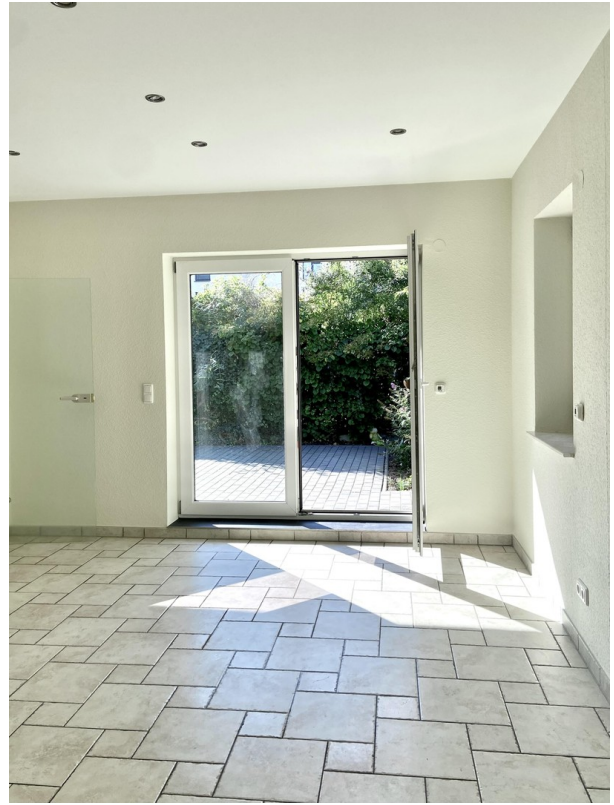
Blick von Küche zur Terrasse