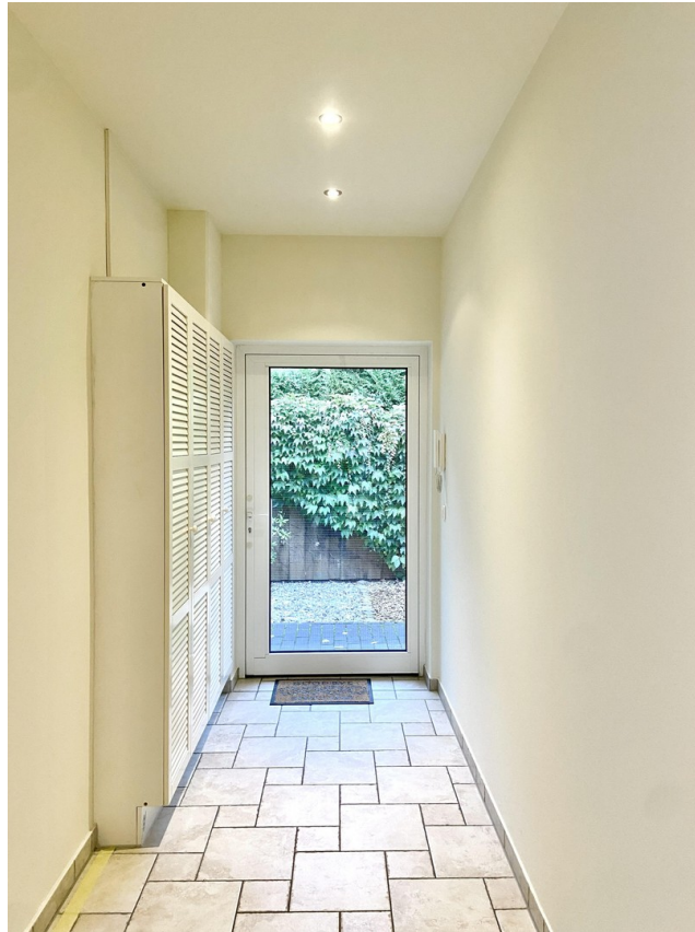
Flur fotografiert v. Küche aus