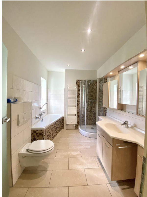
Bad Foto 1