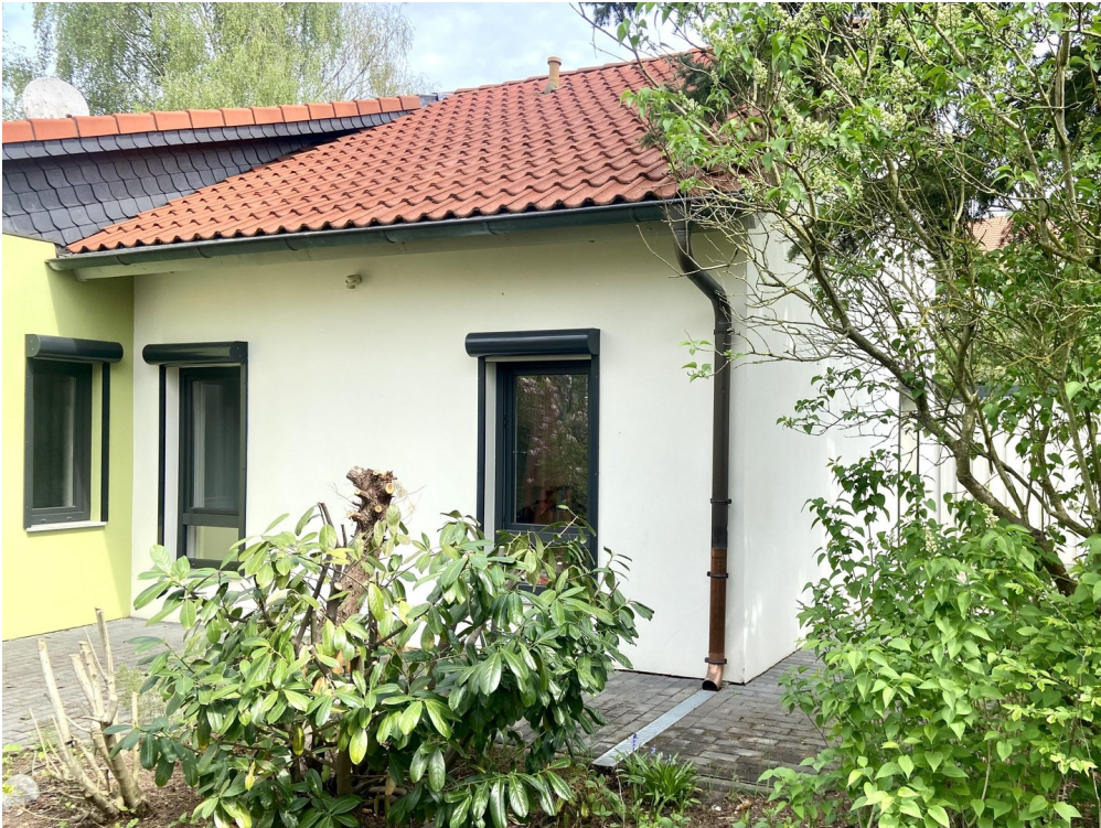
Fenster zu Kzi 1