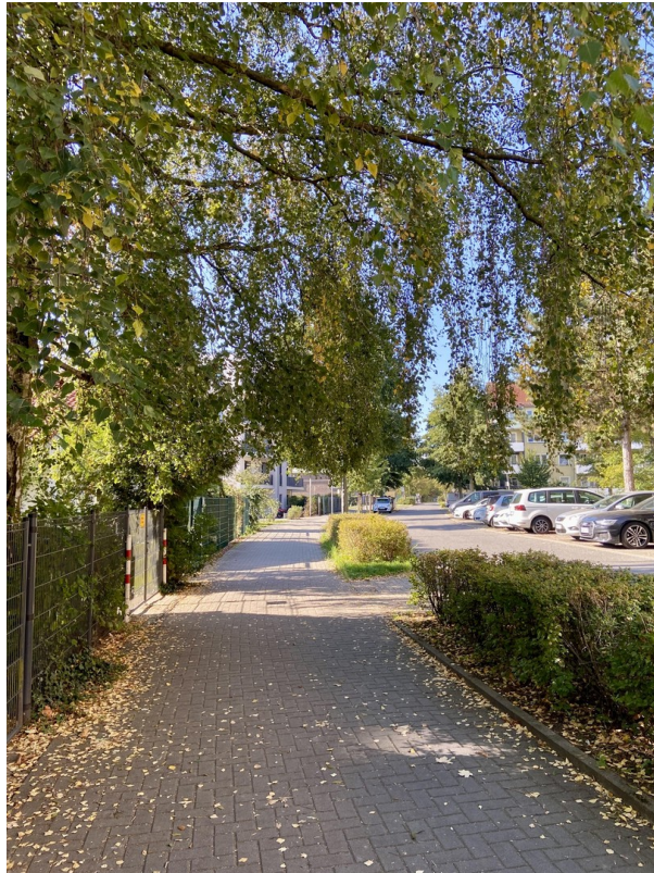
Straße Foto 1