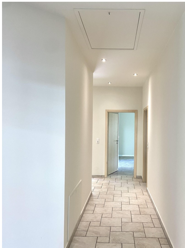
Flur v. WZ aus fotografiert