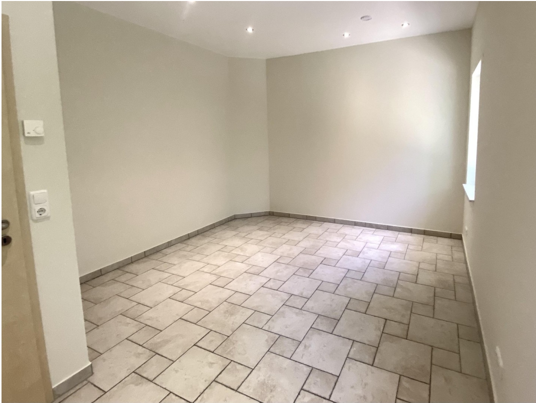
Schlafzimmer Foto 2