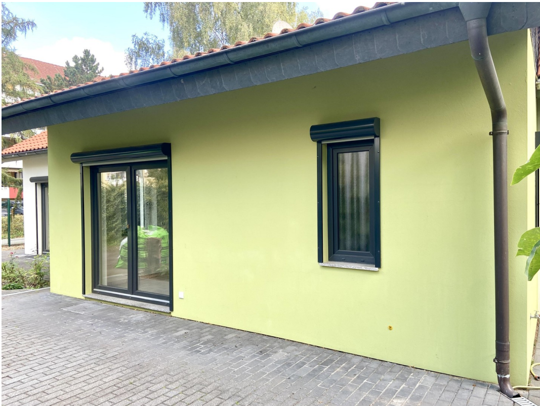
Terrassentür + Fenster HWR