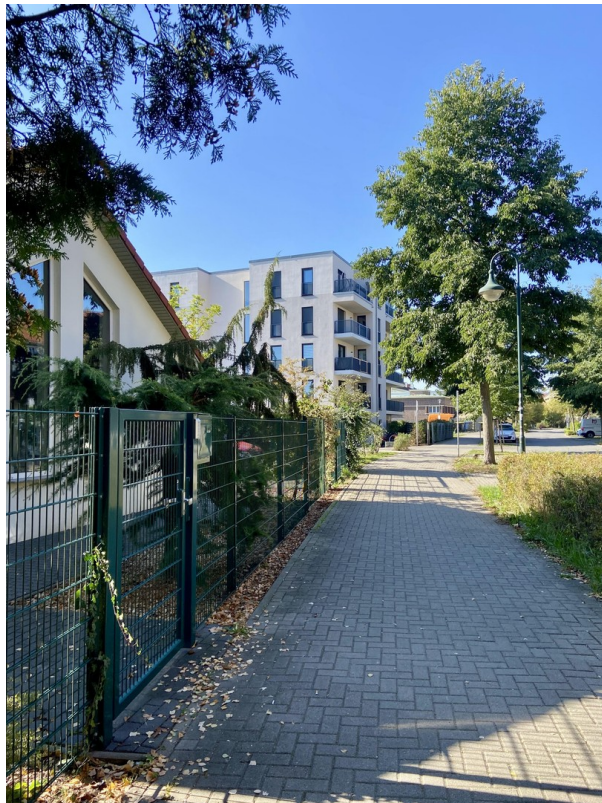
Straße Foto 2