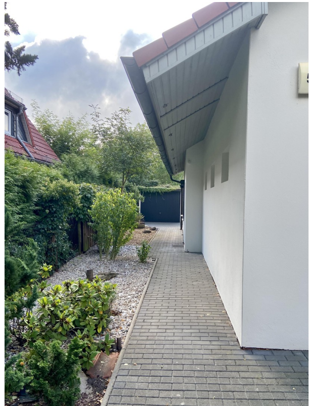
Hausseite li - Weg zur Garage