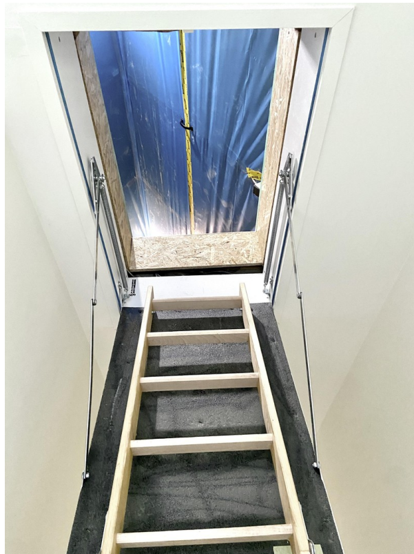
Aufgang zum Dachboden