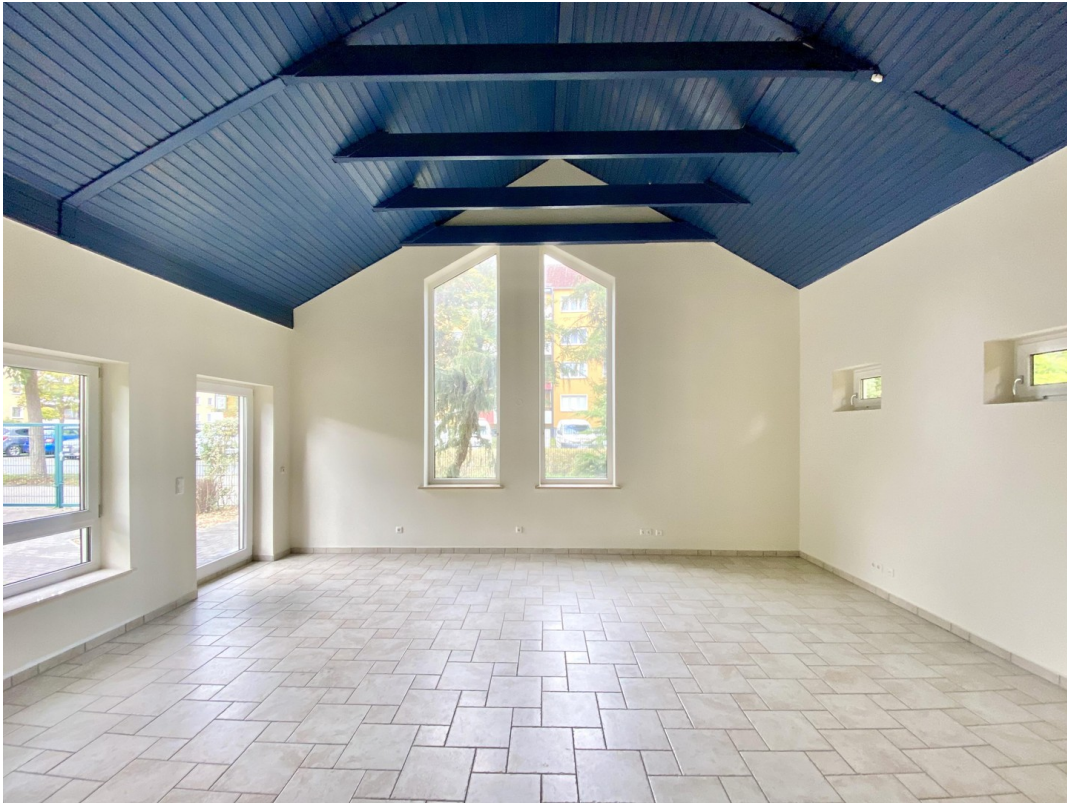
WZ vom Flur aus fotografiert