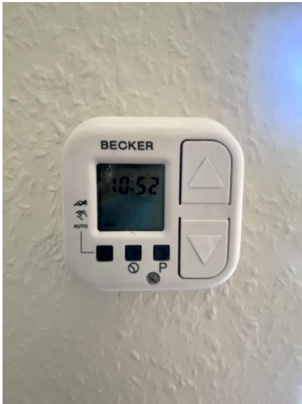
Regler elekt. Rolläden