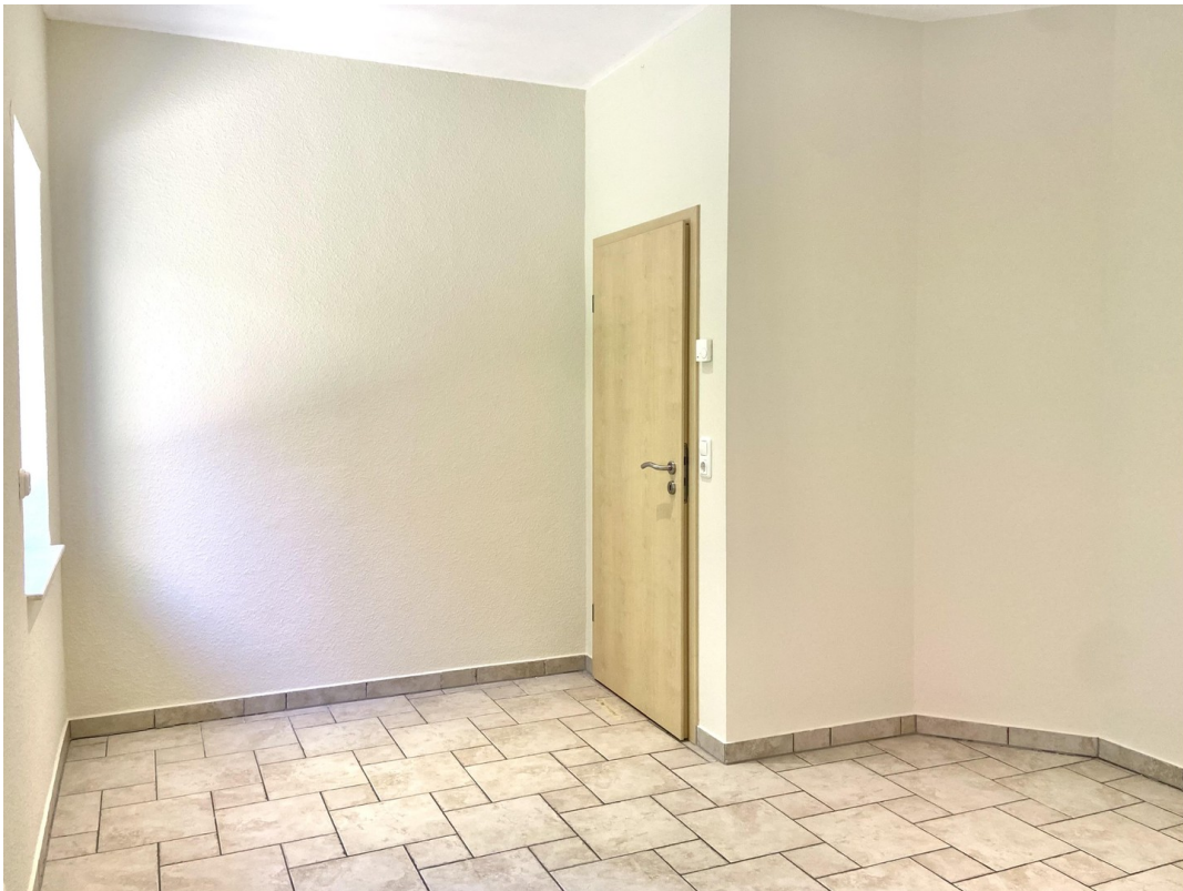
Schlafzimmer Foto 3