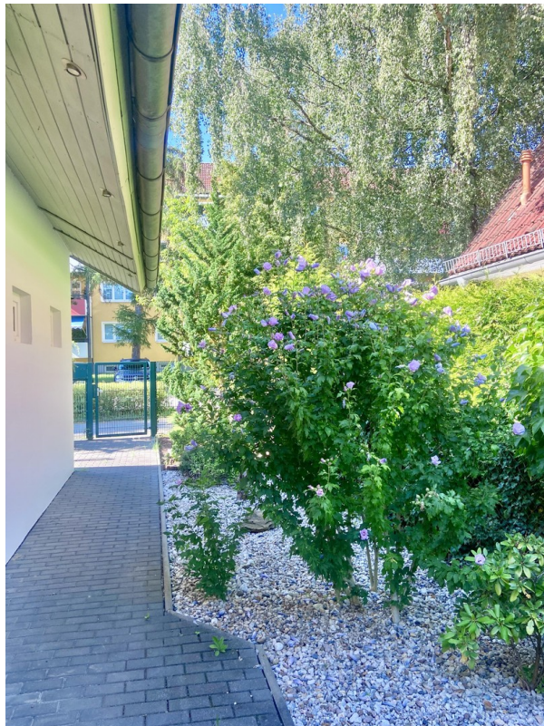
Blick Richtung Garten-Pforte