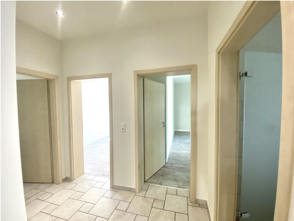
Flur m. Türen zu Bad, Kzi + SZ