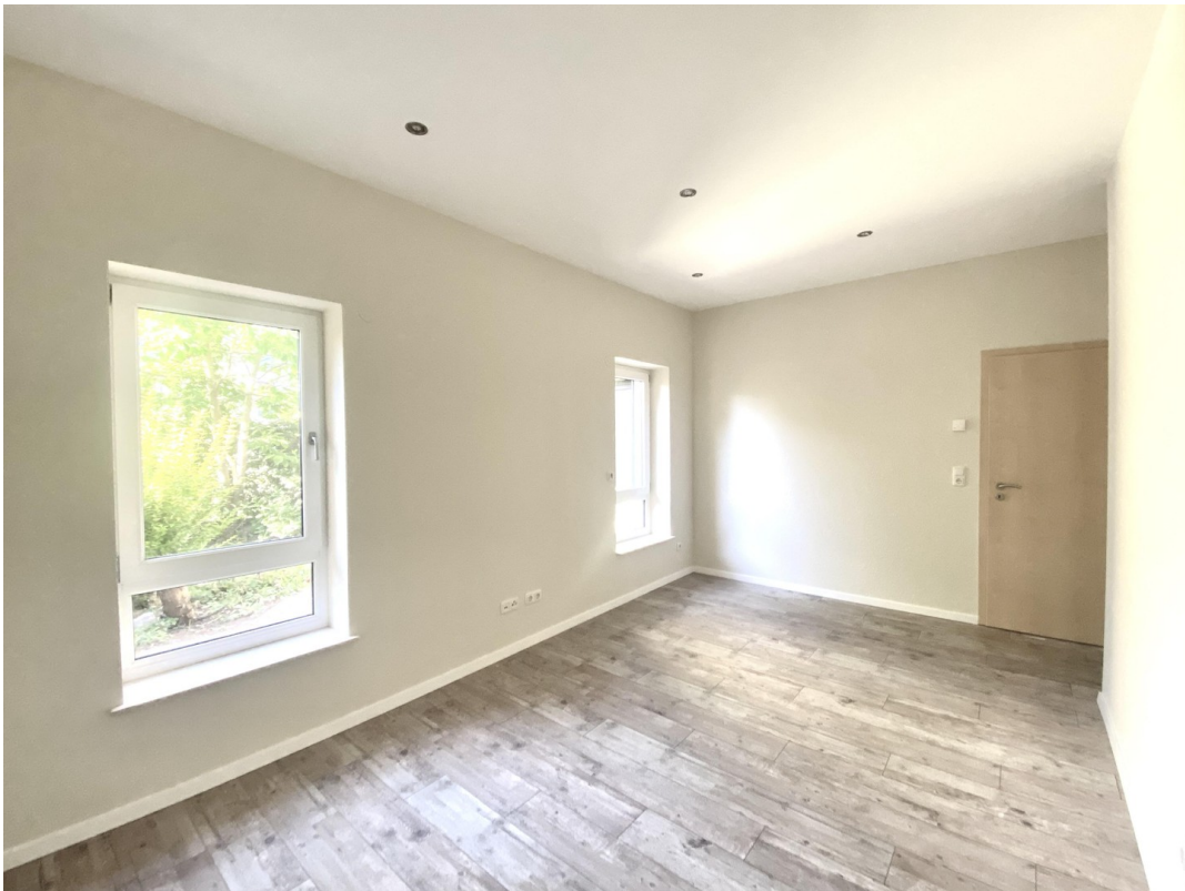
Kzi 1 mit Laminat Foto 2