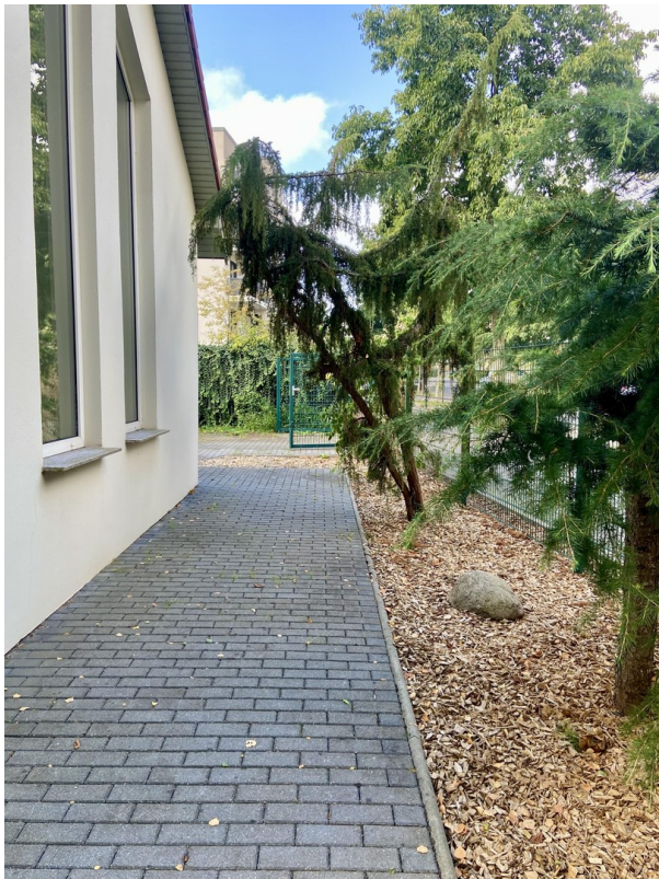
Hausfront zur Straßenseite