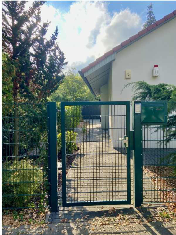
Hausseite li m. Eingangspforte