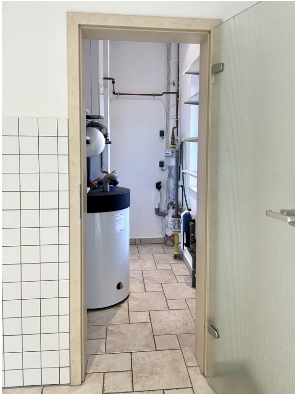
Blick von der Küche zum HWR