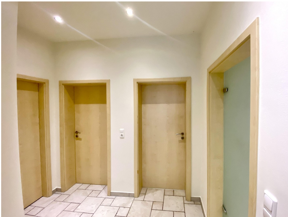
Flur m. Türen zu Bad Kzi + SZ