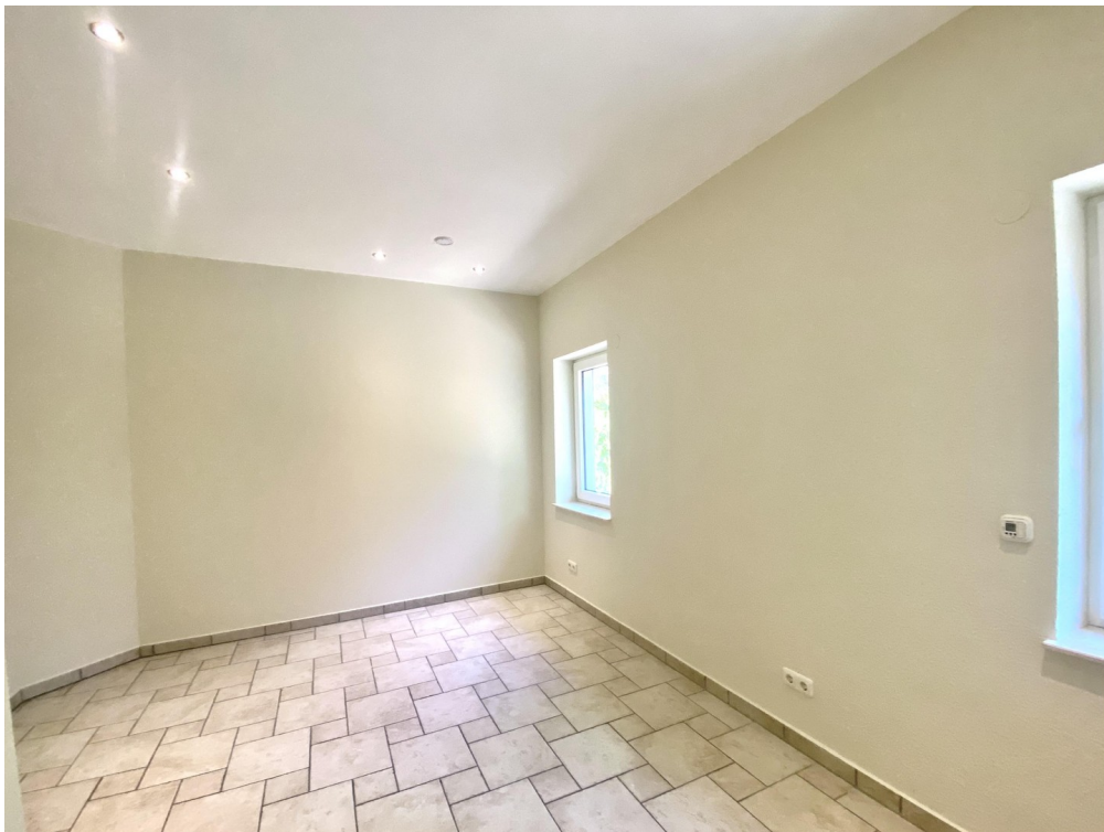
Schlafzimmer Foto 1