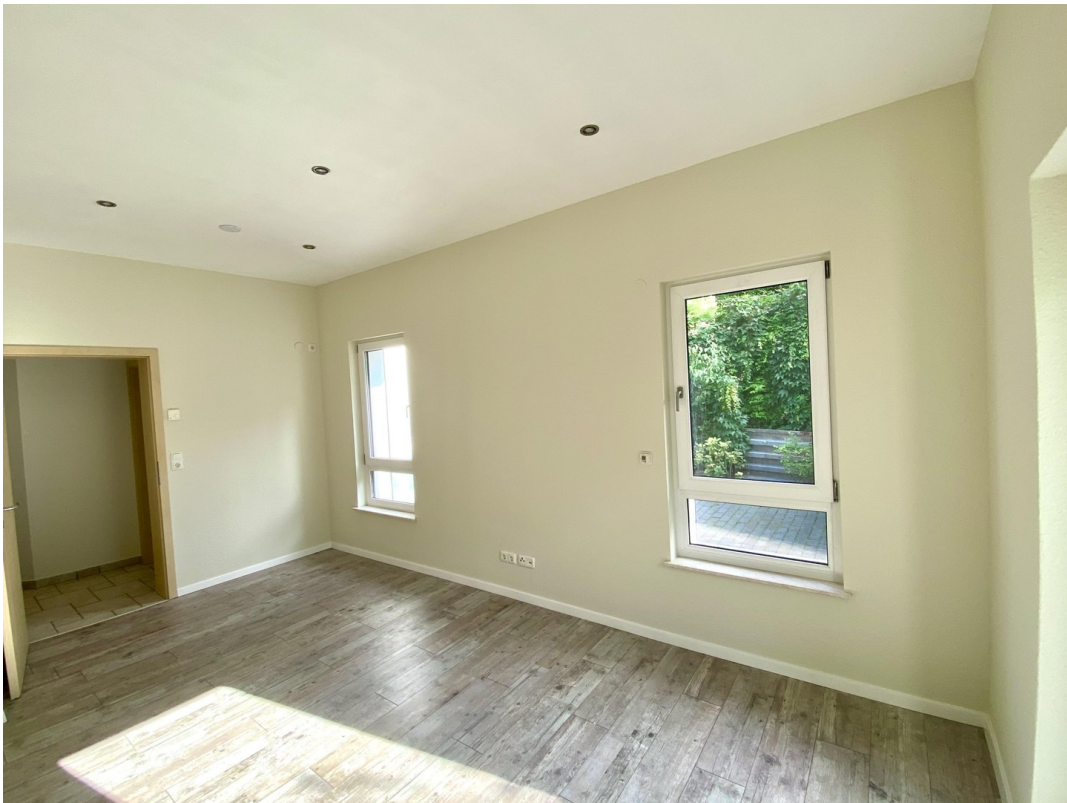
Kzi 2 mit Laminat Foto 2