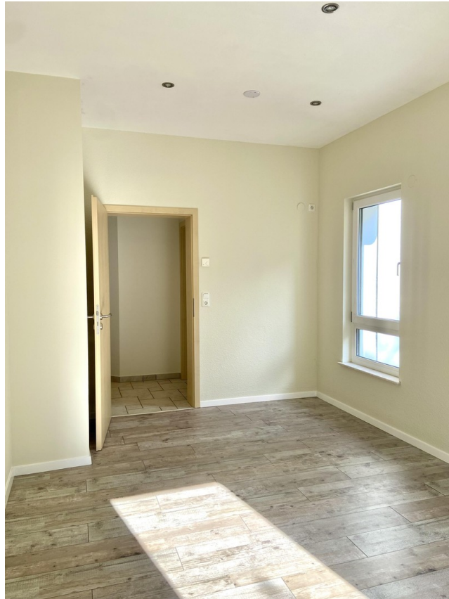
Kzi 2 mit Laminat Foto 3