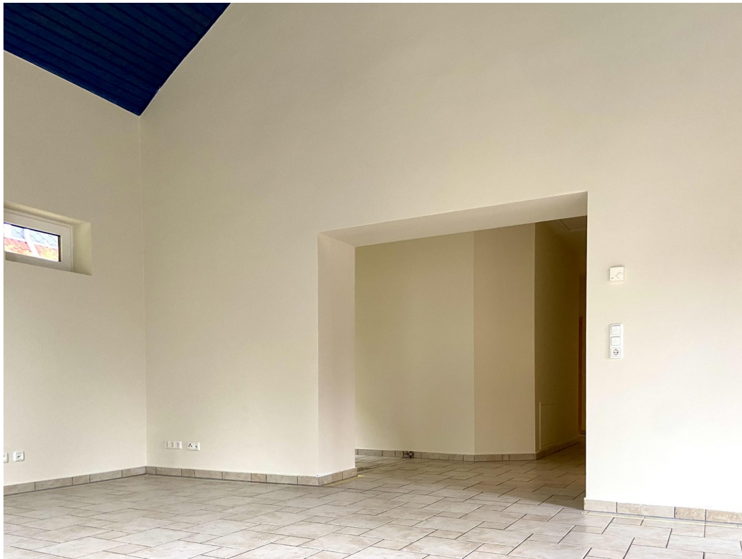
Durchgang v. WZ zum Flur