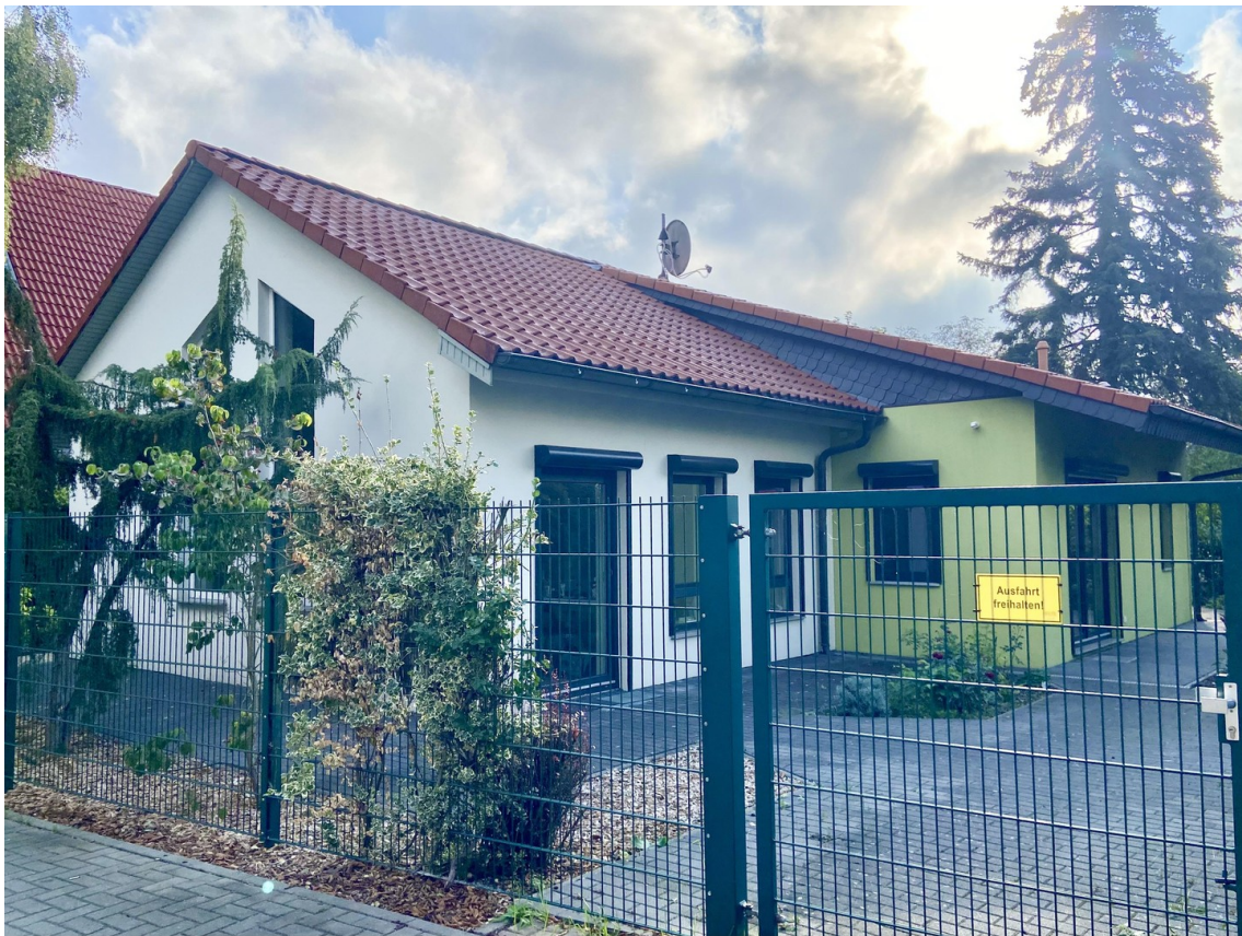
EFH rechte Seite