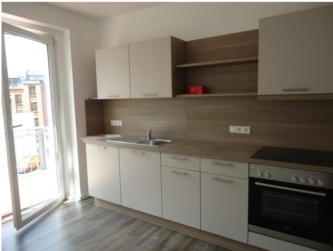
Küche mit Balkon