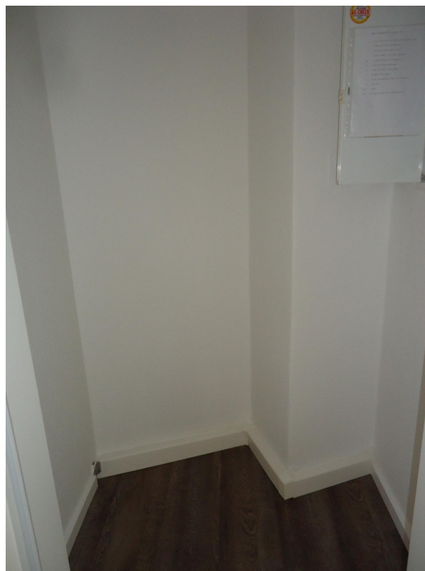
Abstellraum in Wohnung