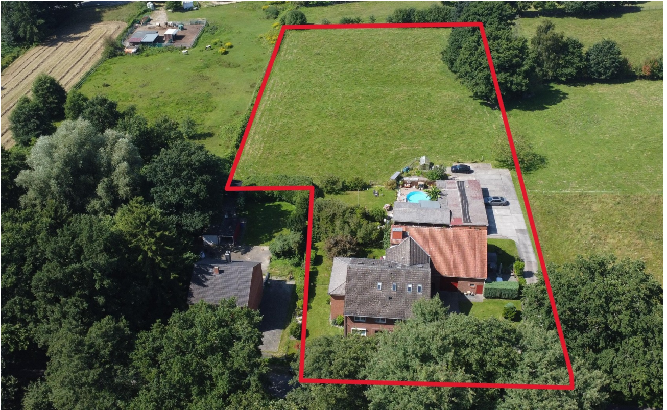
Gesamtes Objekt mit Weide