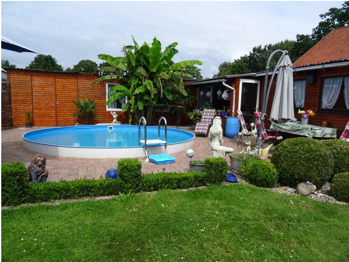
Pool inkl. Solaranlage