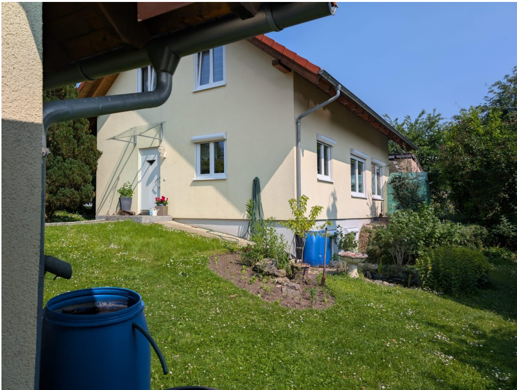
Blick auf Front vom Schuppen