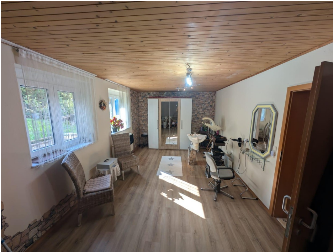
Friseur und Hobbyzimmer