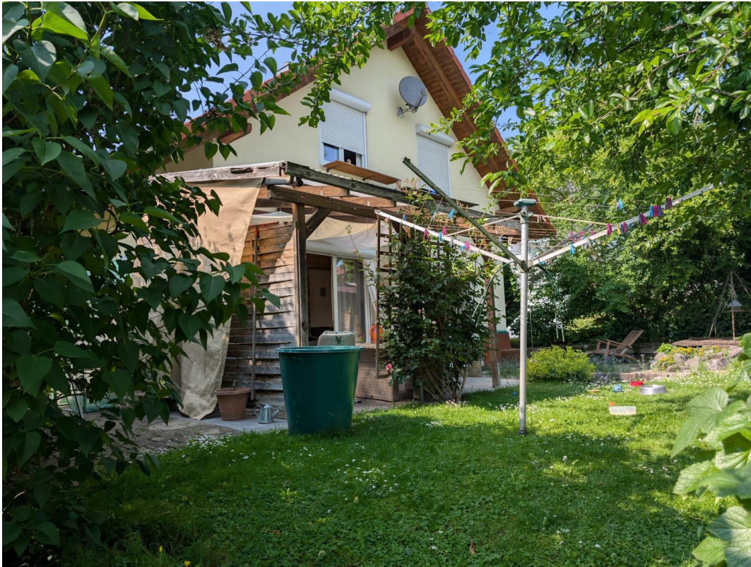
Terrasse und Garten hinter Haus