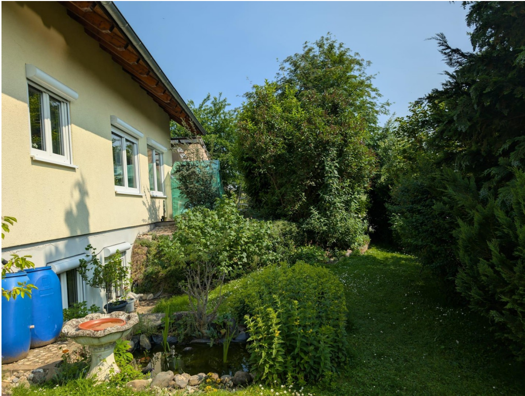
Blick auf Teich und Südseite