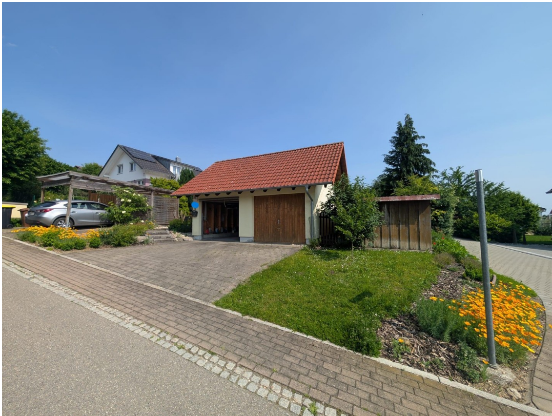
Doppelgarage von Strasse aus