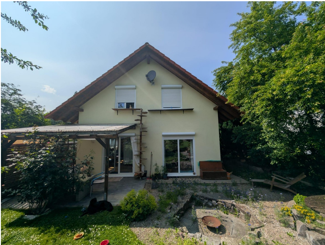
Terrasse und Garten hinter Haus