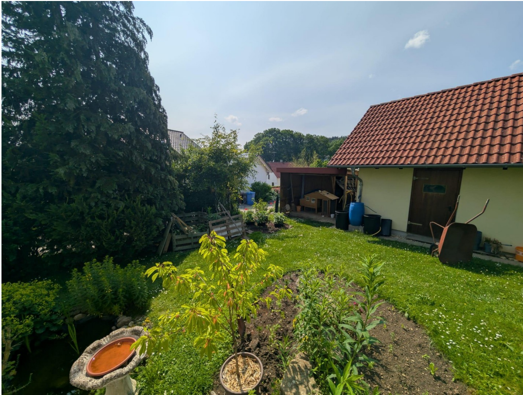
Blick auf Garage und Schuppen