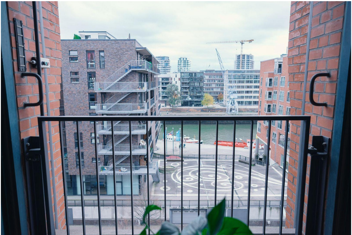
Aussicht Büro Südseite