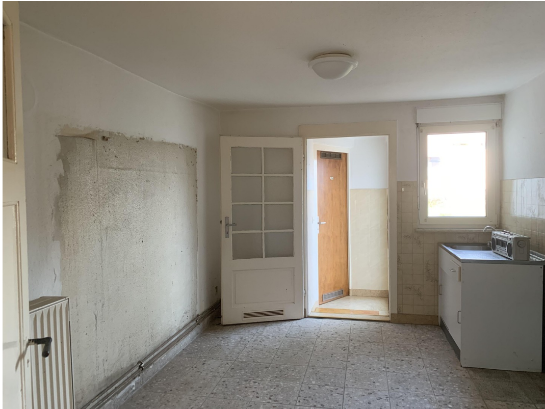
große Wohnküche EG