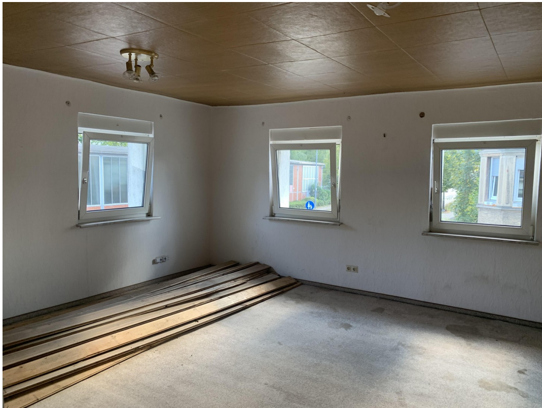
Zimmer 2 EG