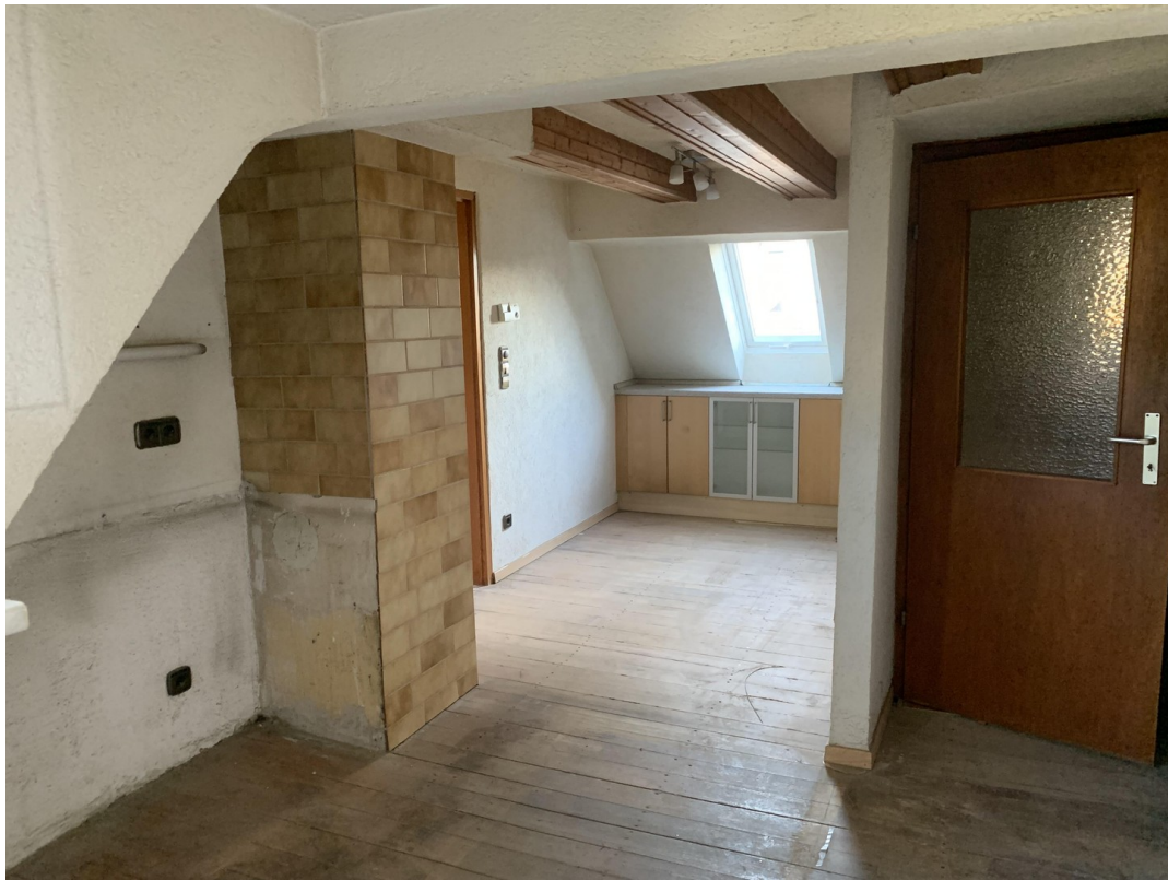
Essbereich Wohnküche OG