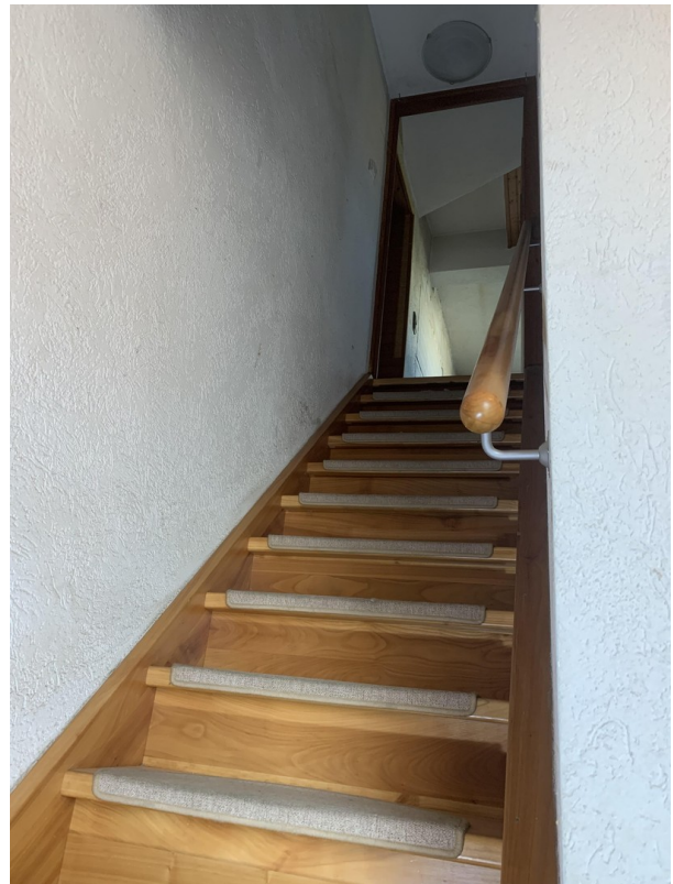
Treppenaufgang zum OG