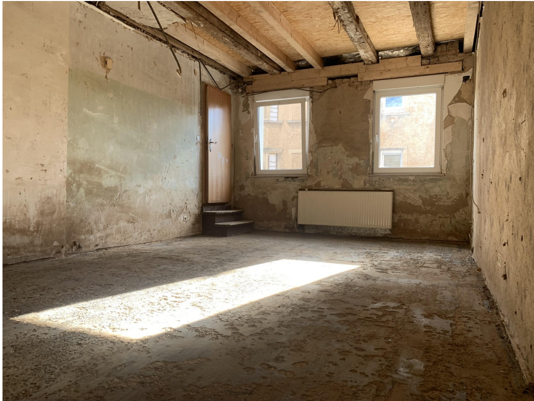
Zimmer 3 EG