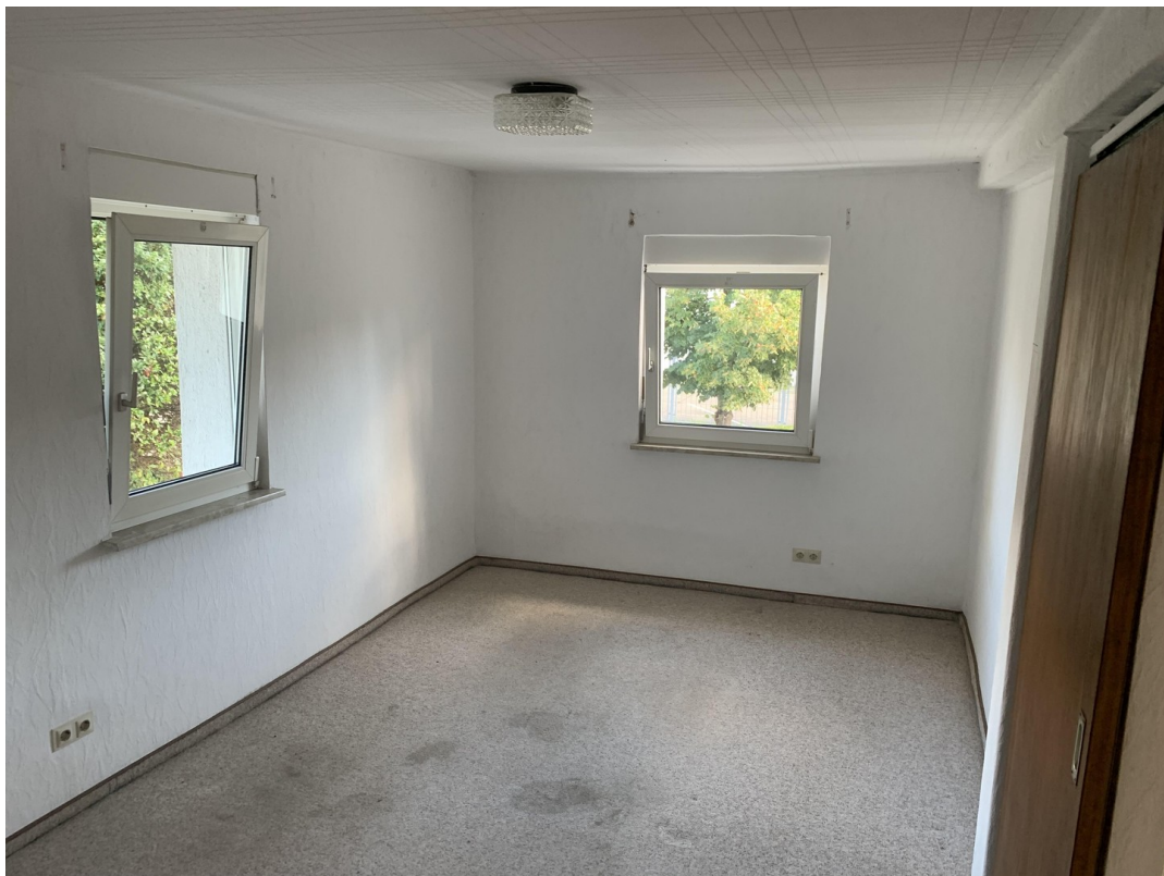
Zimmer 1 EG