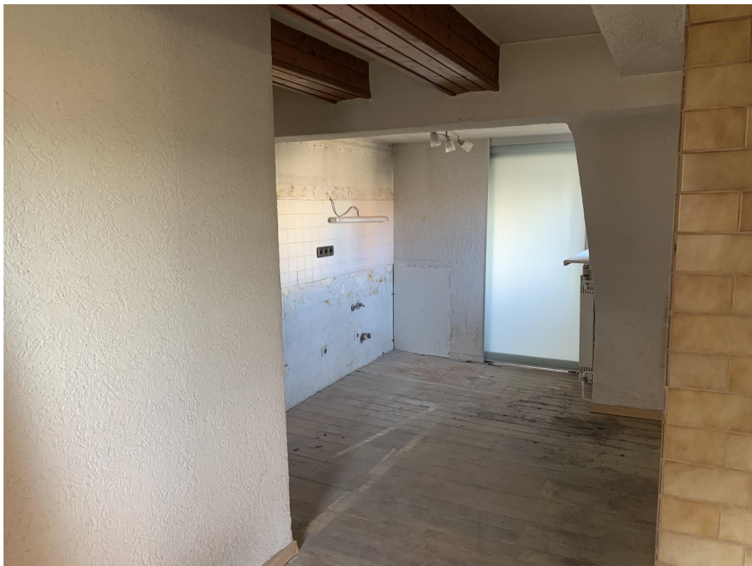
Arbeitsbereich Wohnküche OG