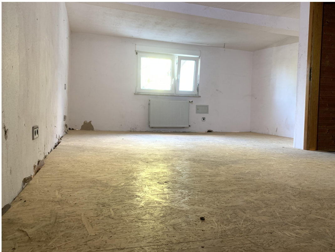
Zimmer 2 OG