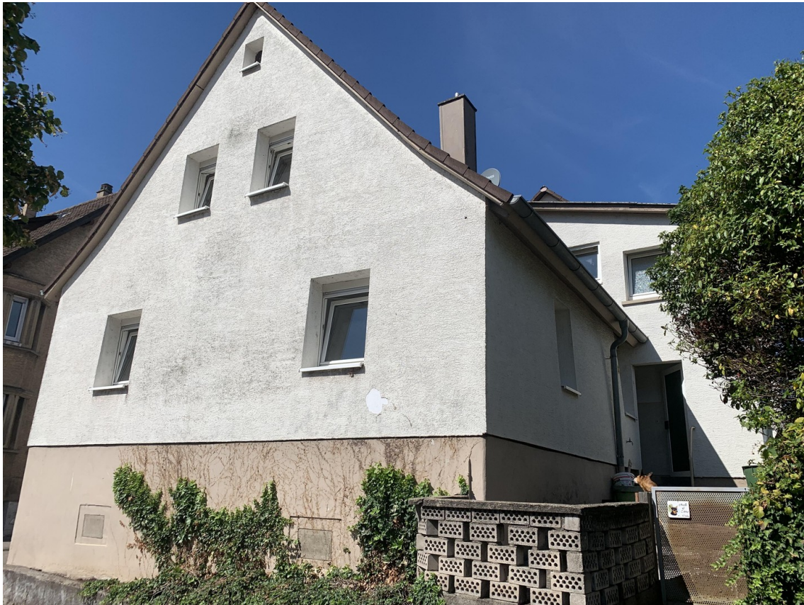
Außenansicht Schillerstraße 2