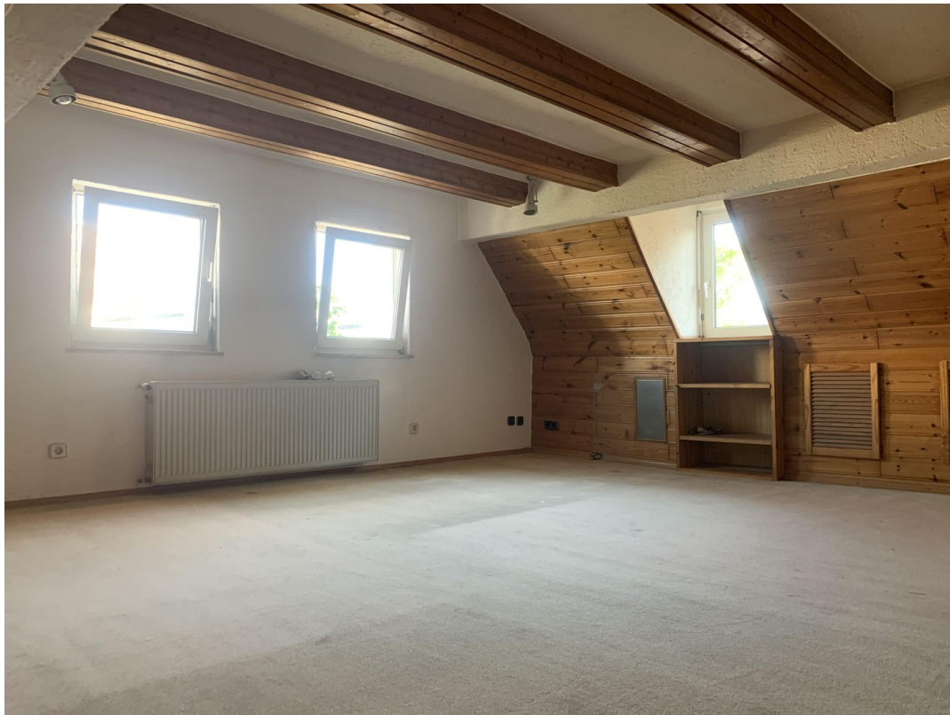
Zimmer 1 OG