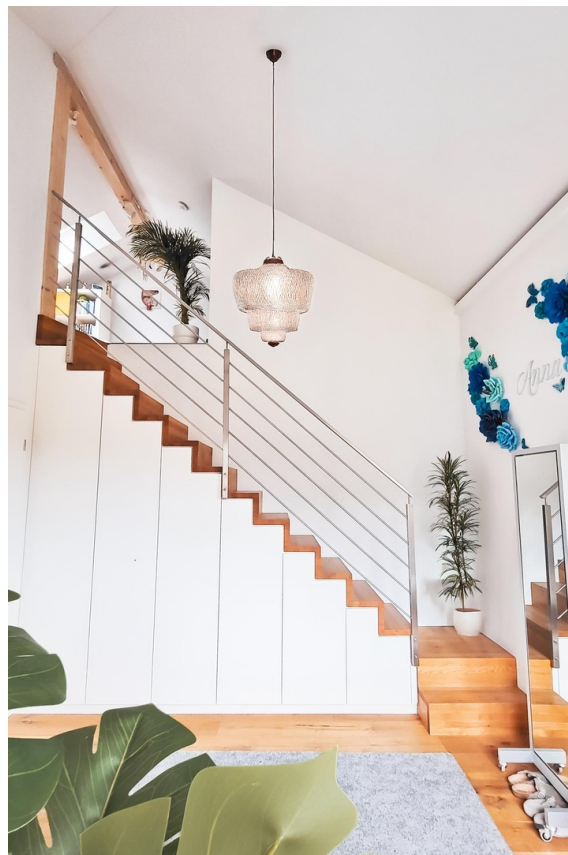
Kinderz. 2 (Aufgang zum DG)