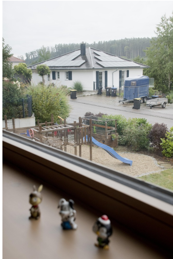
Spielplatz (Aussicht 1. OG)