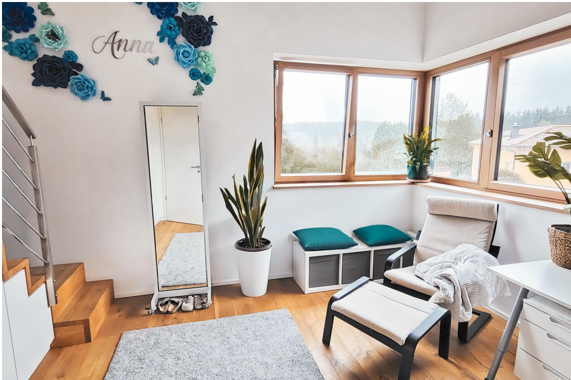
Kinderzimmer 2 (1. OG)