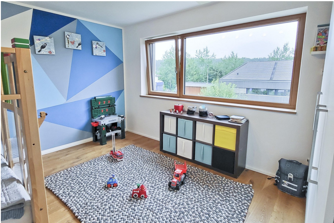
Kinderzimmer 1 (1. OG)