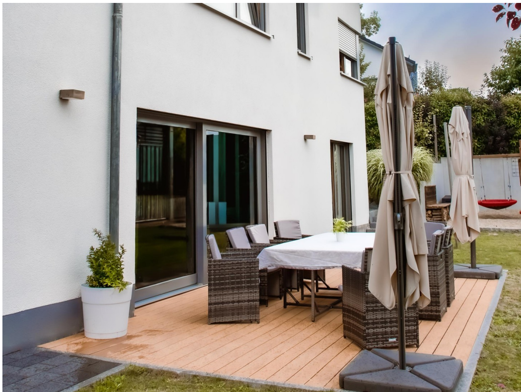
Terrasse - Süd