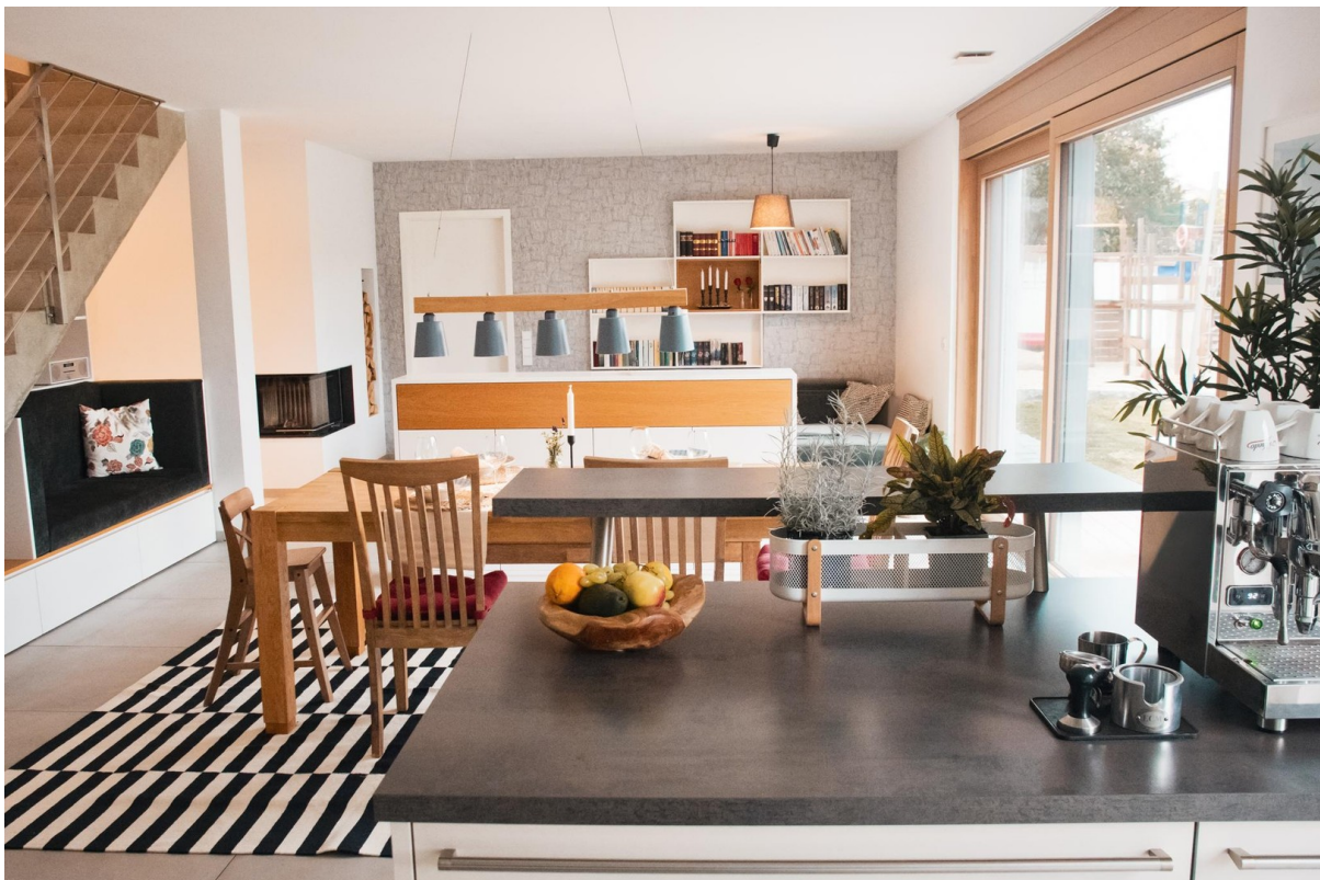
Wohn- und Esszimmer (EG)