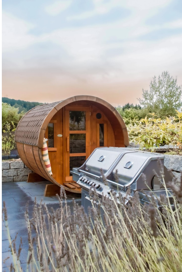
Sauna Terrasse - West