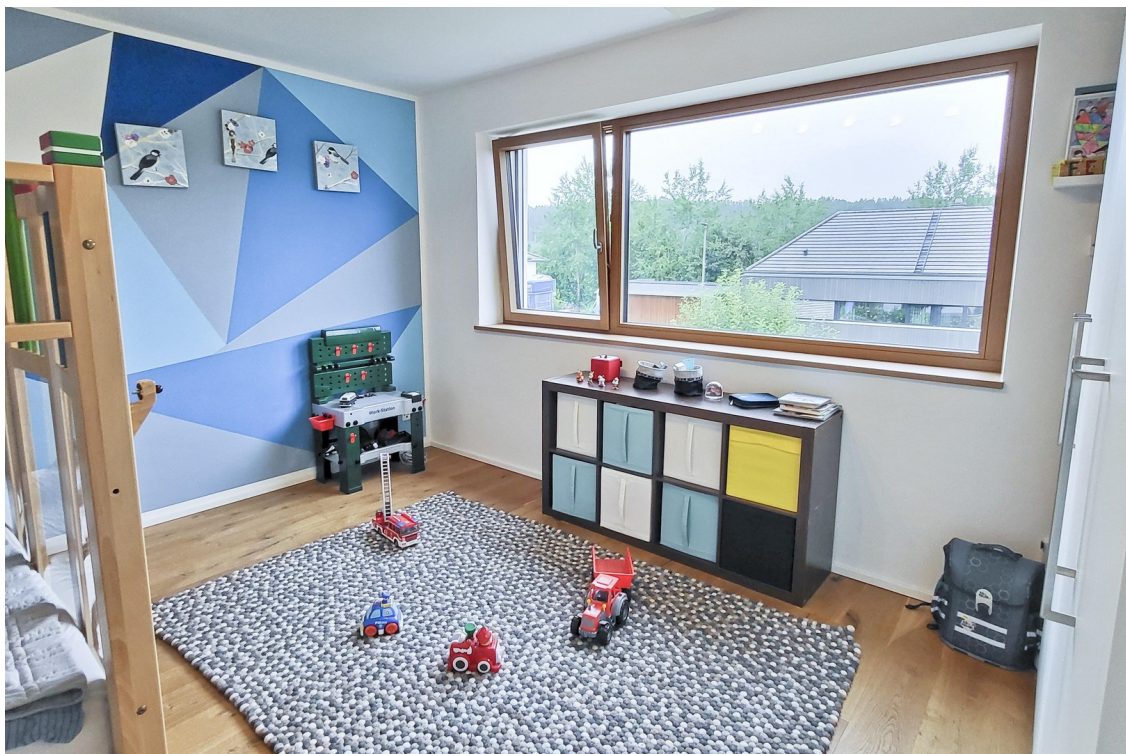
Kinderzimmer 1 (1. OG)