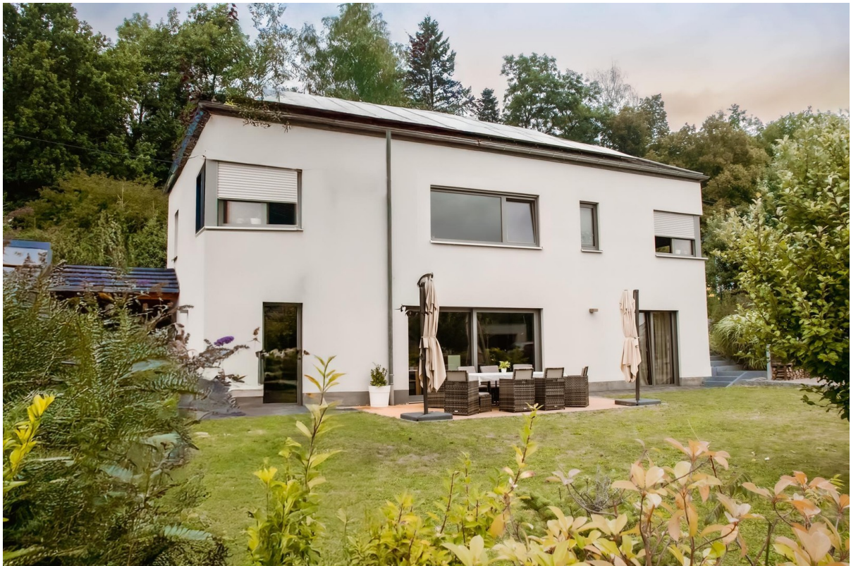
Hausansicht (Baum entfernt)