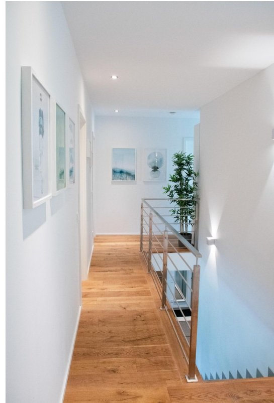
Flur (1. OG)