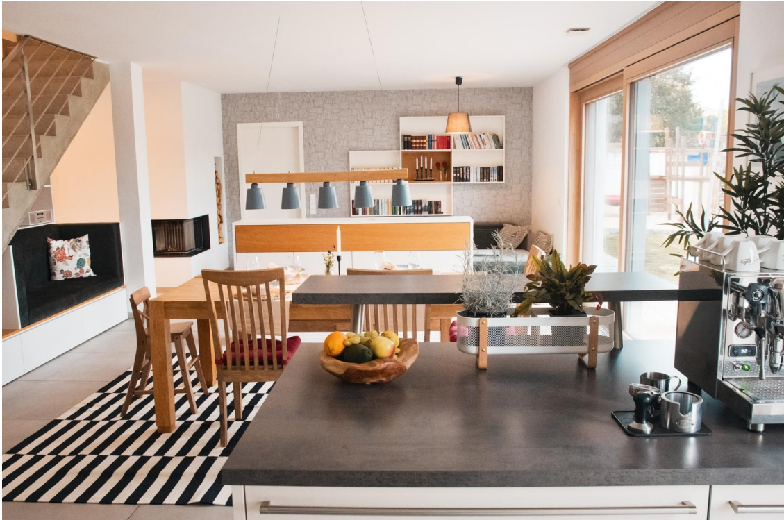
Wohn- und Esszimmer (EG)