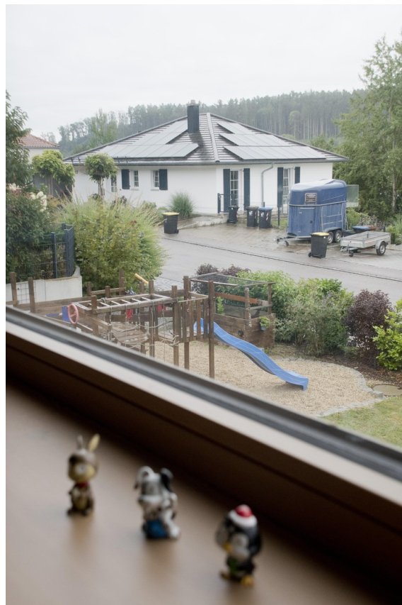
Spielplatz (Aussicht 1. OG)