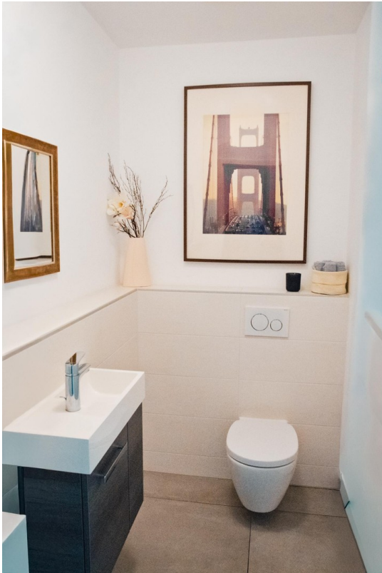
Gäste WC (EG)