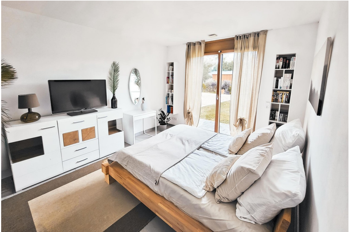
Gästezimmer / ehem. Büro (EG)