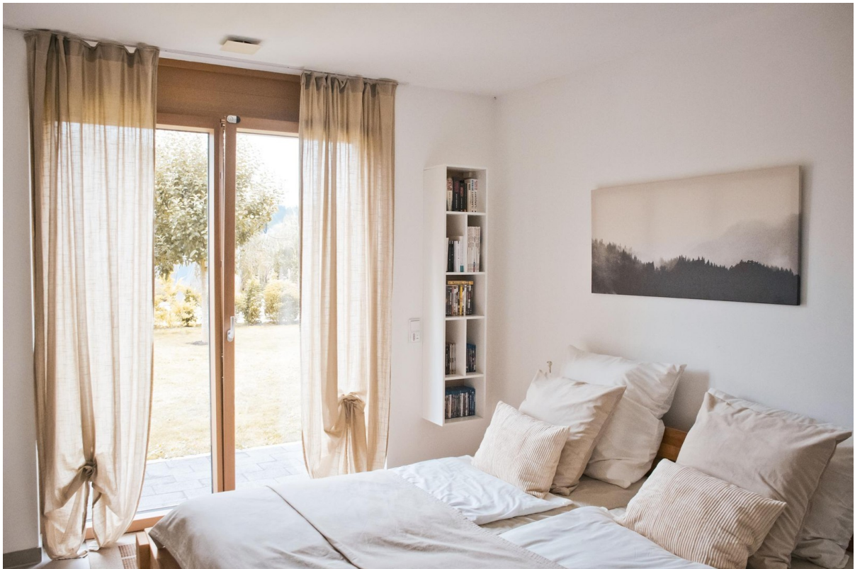
Gästezimmer / ehem. Büro (EG)