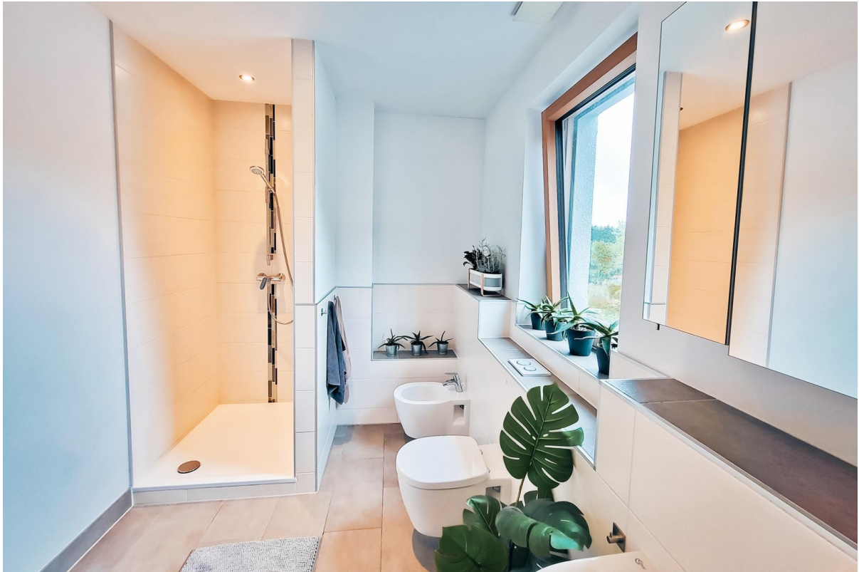
Kinder Bad (1. OG)