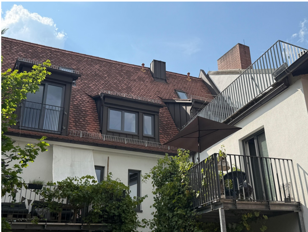
Hofseite mit Dachterasse