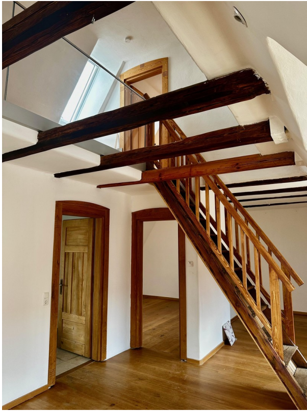
Treppe zur Galerie