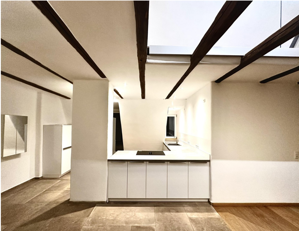
Blick auf die Küche