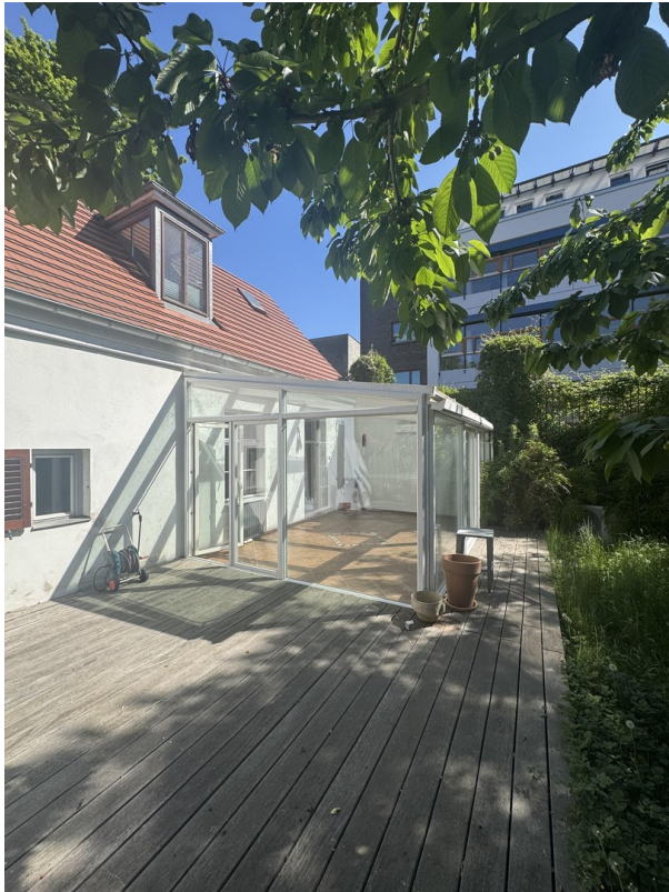
Wintergarten und Terrasse