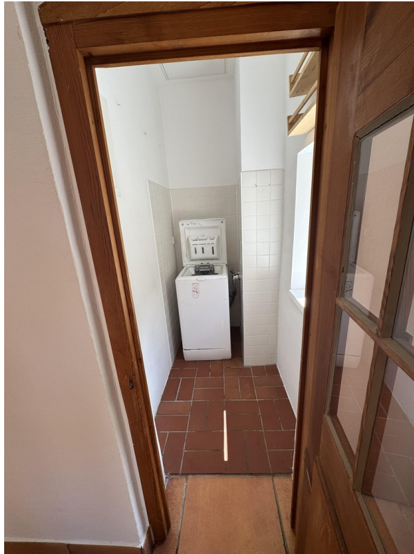
Abstellkammer mit Waschmaschin