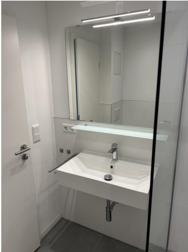
Waschbecken und Spiegel