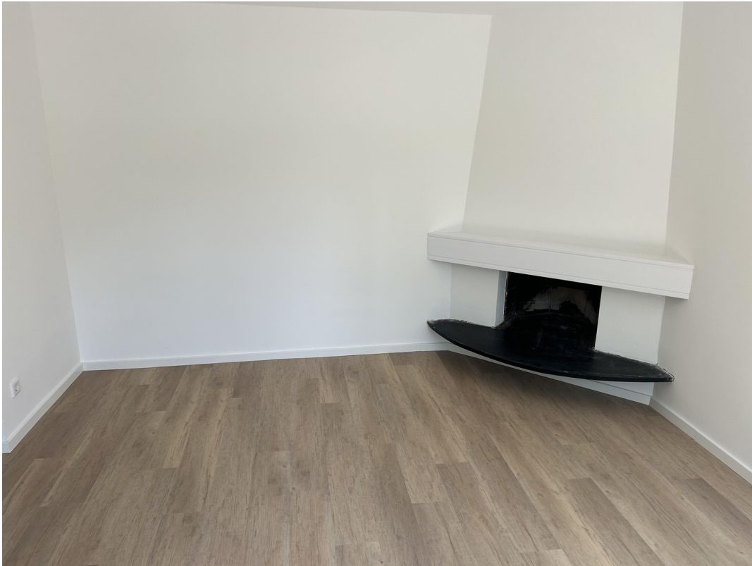
Blick ins Wohnzimmer mit Kamin