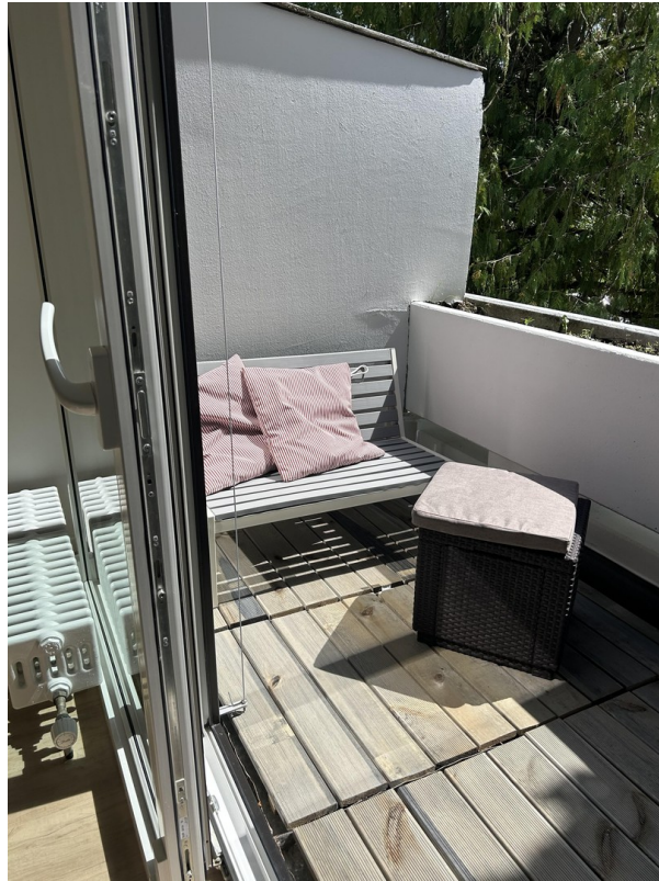
Gemütlich auf dem Balkon