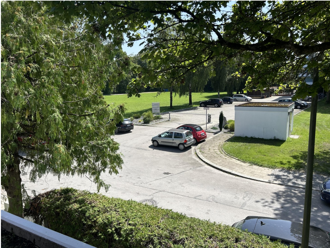
Blick über die Straße