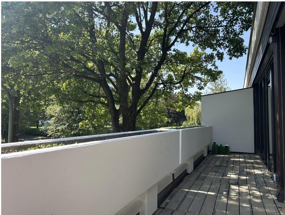
Blick von der Bank ins Grüne