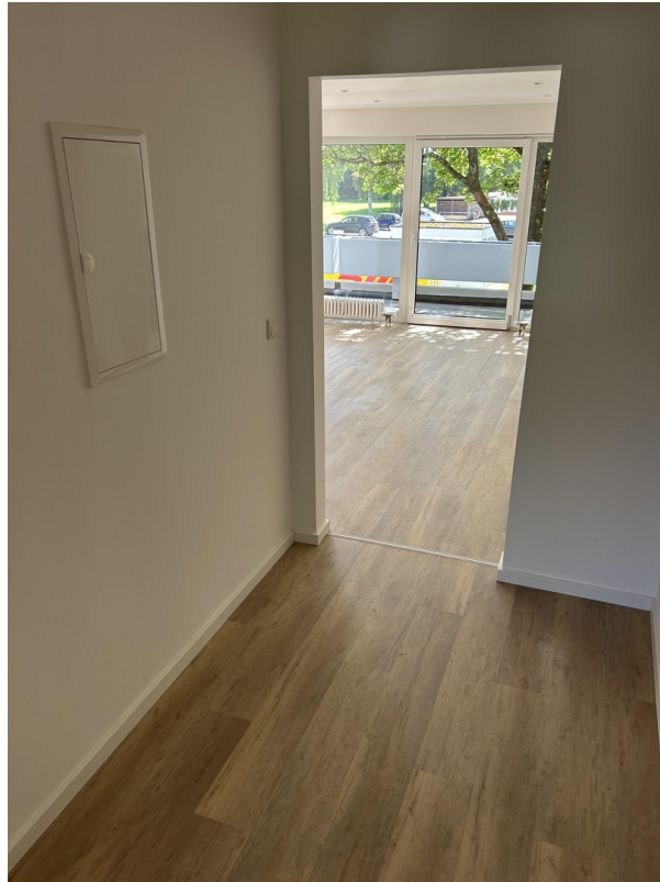
Flur mit Blick ins Wohnzimmer