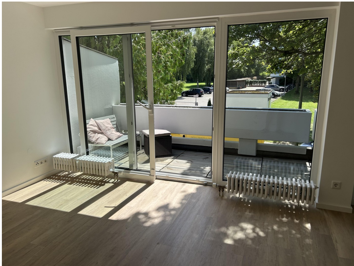
Blick aus dem Wohnzimmer