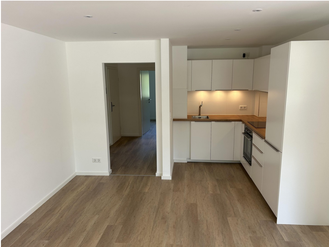
Küche und Flur