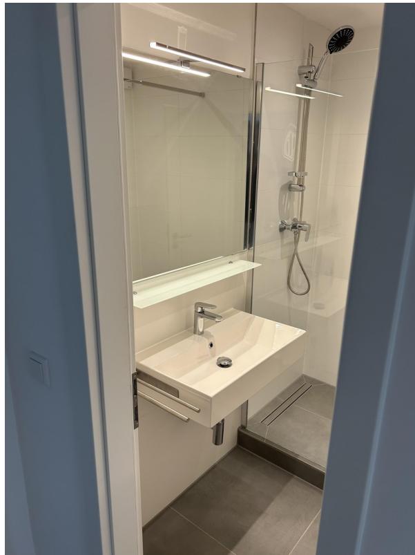
Blick ins Bad