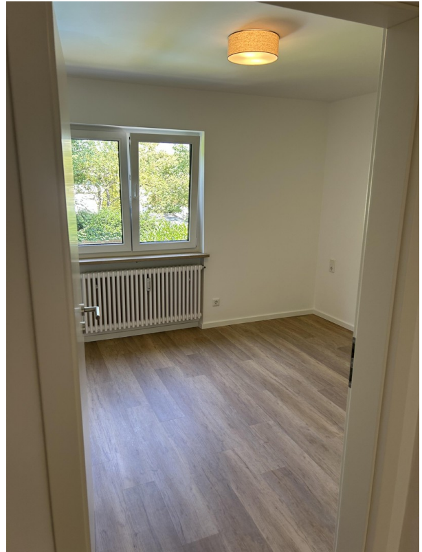
Blick ins Schlafzimmer