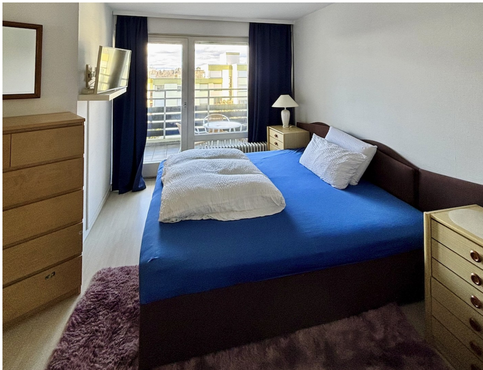
Schlafzimmer № 2