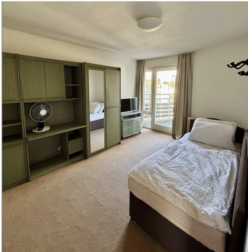
Schlafzimmer № 1