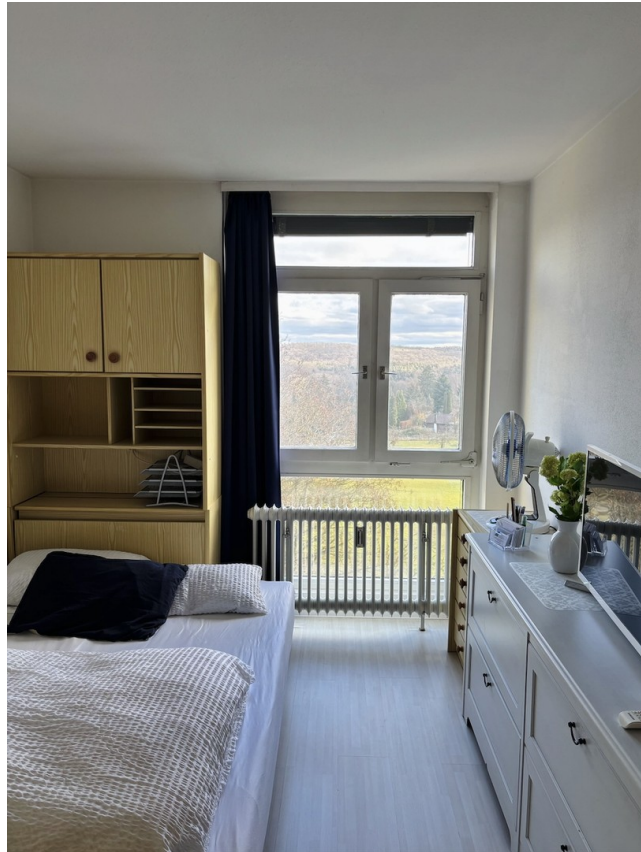
Schlafzimmer № 3