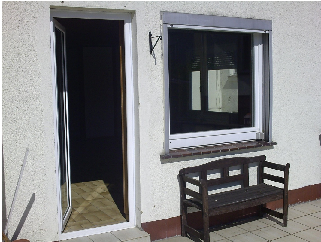
Niedervellmarsche Str. 19a