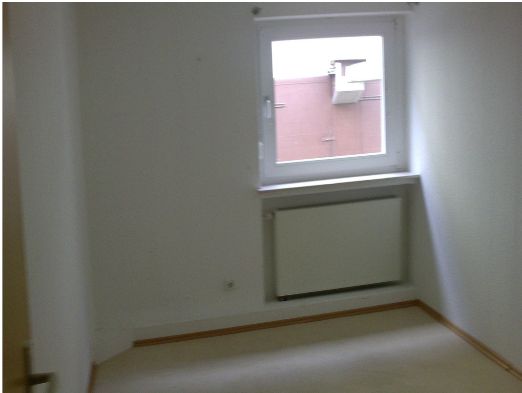
Niedervellmarsche Str. 19a