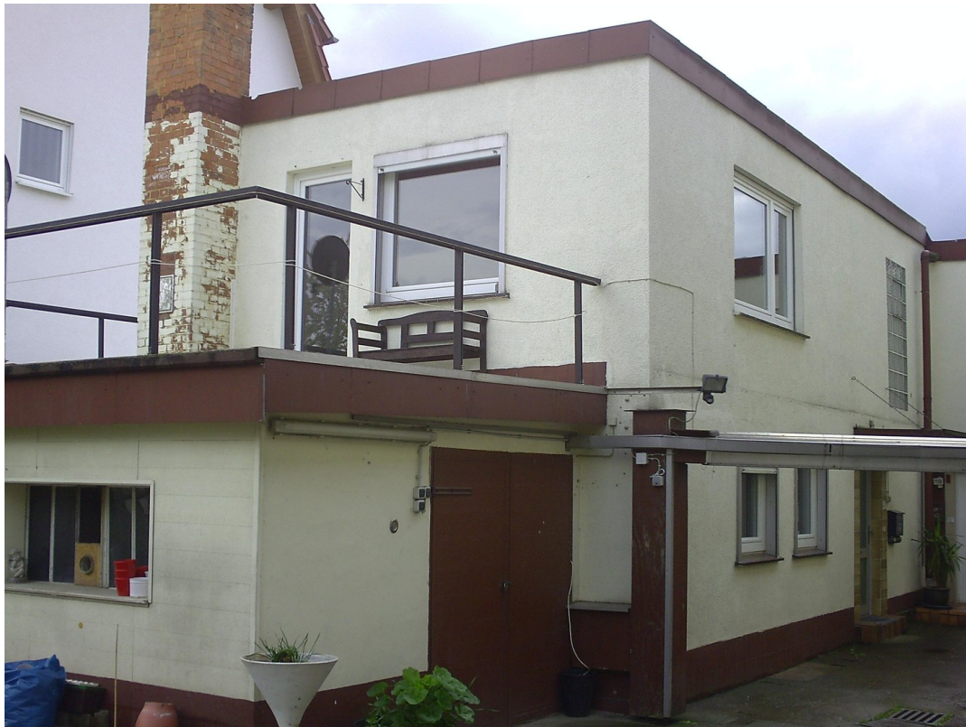
Niedervellmarsche Str. 19a