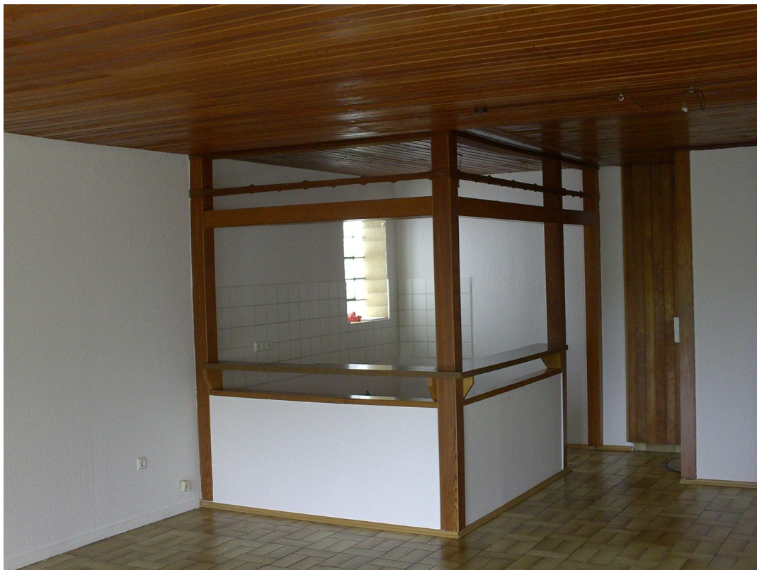
Niedervellmarsche Str. 19a