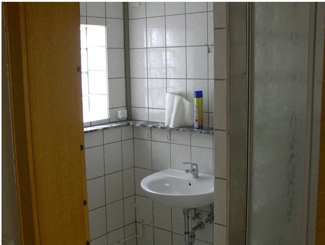
Niedervellmarsche Str. 19a