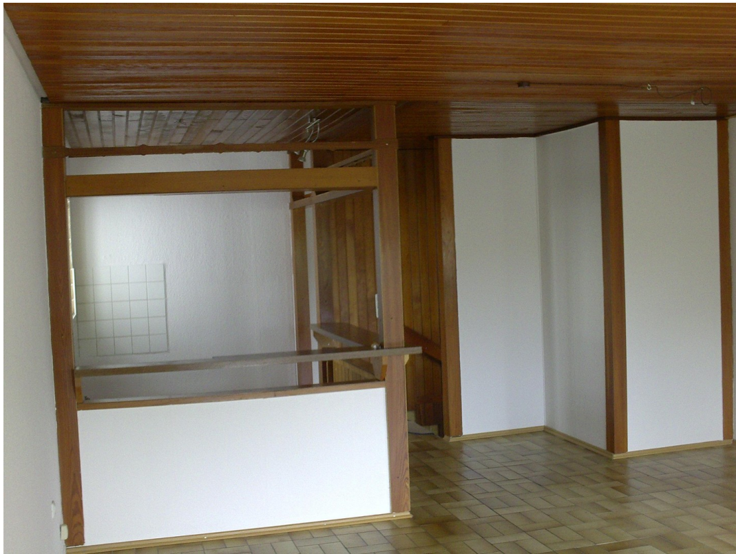
Niedervellmarsche Str. 19a