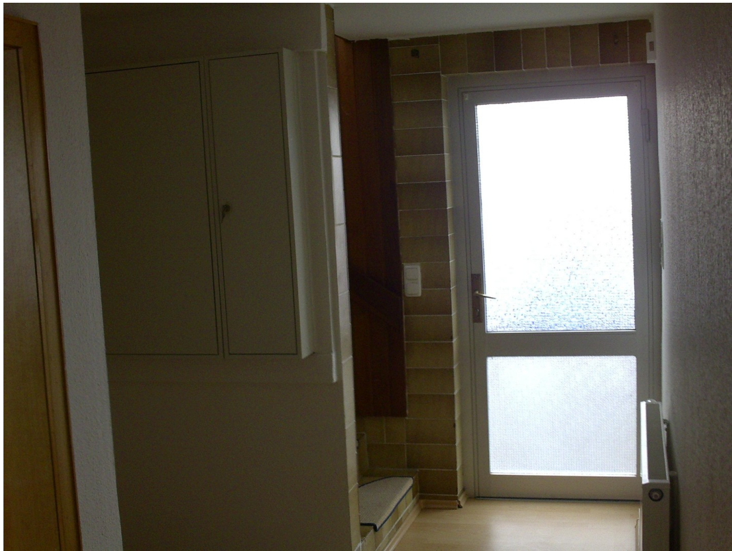
Niedervellmarsche Str. 19a