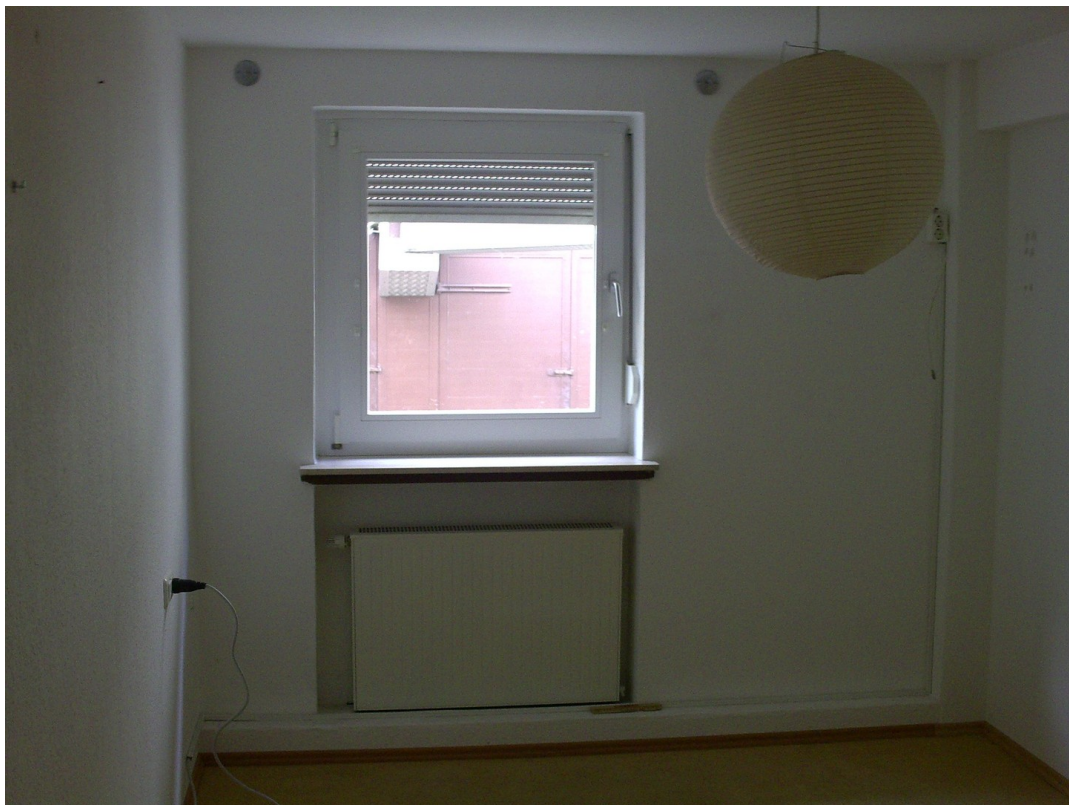
Niedervellmarsche Str. 19a