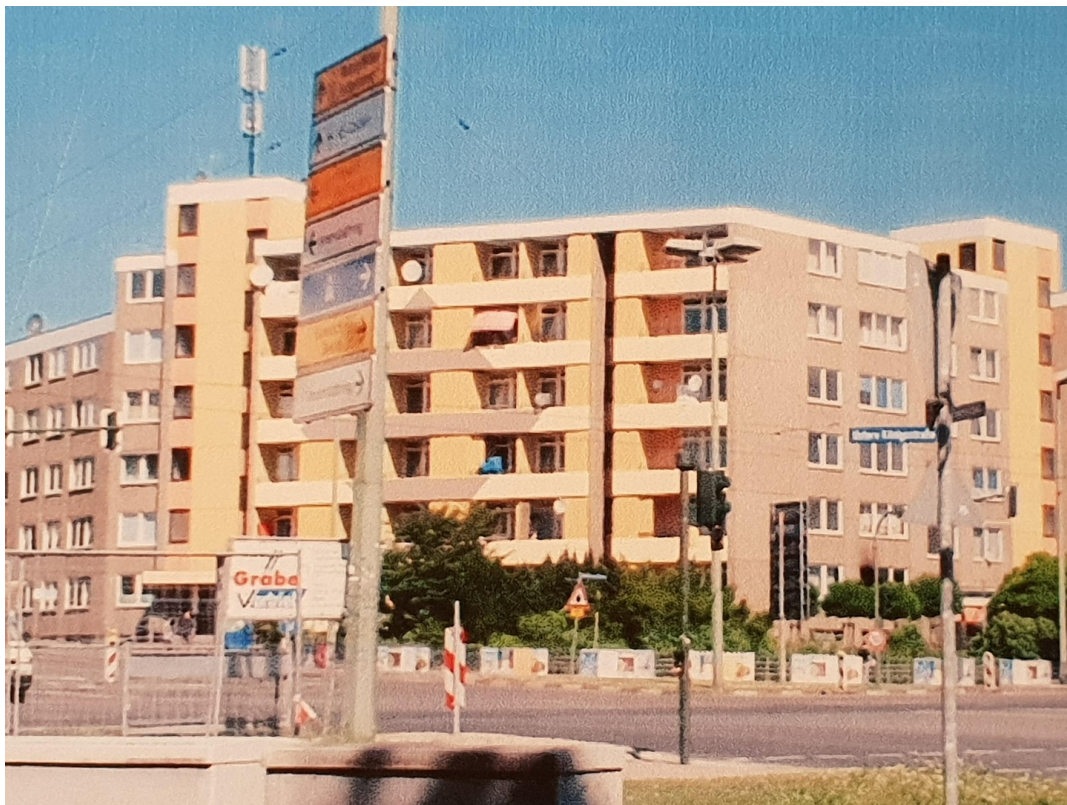
Wolfhager Str. 2