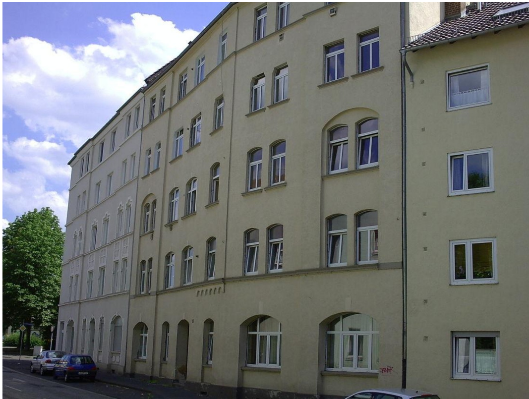
Wolfhager Str. 85