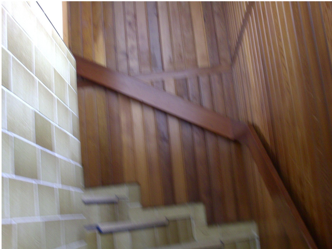
Niedervellmarsche Str. 19a