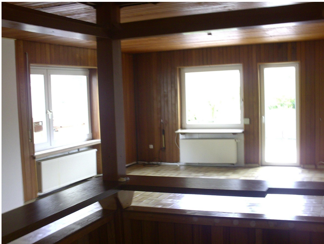
Niedervellmarsche Str. 19a