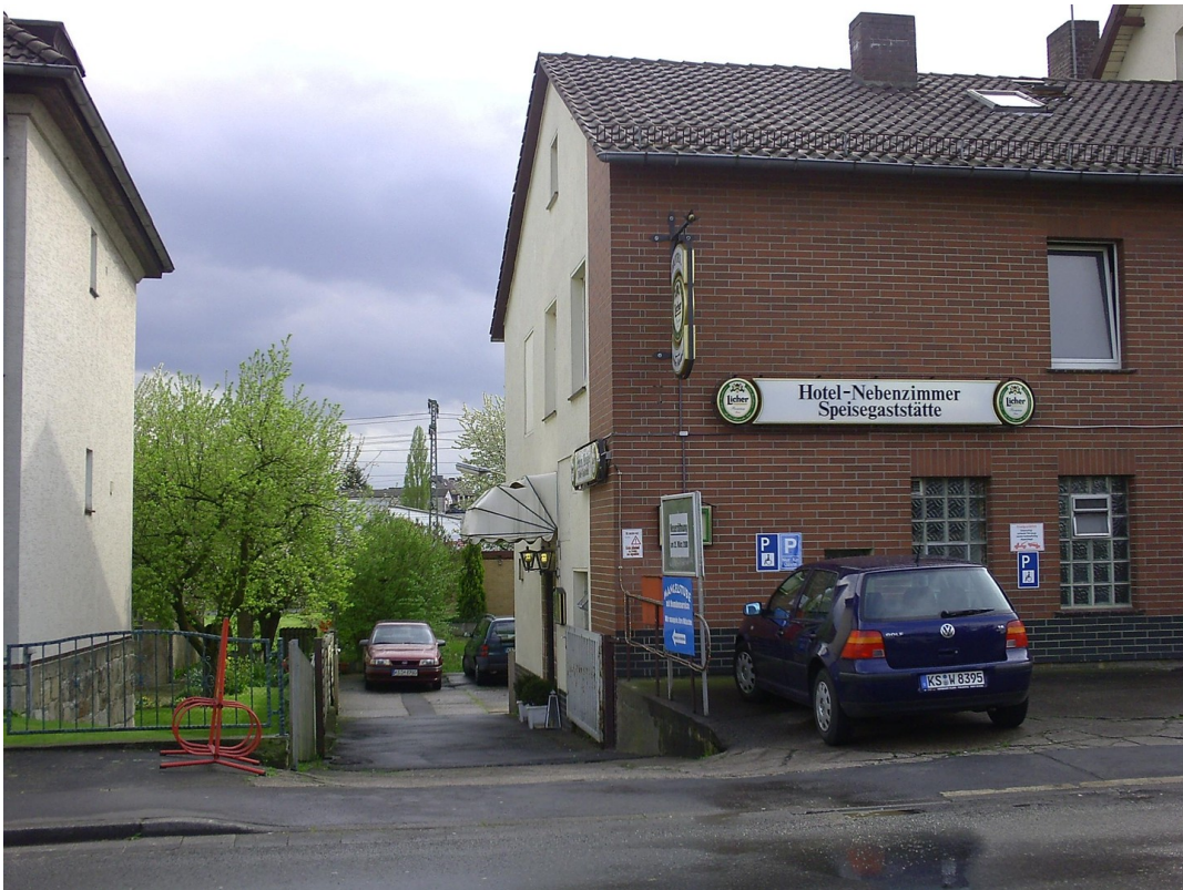
Einfahrt zum Haus 19a