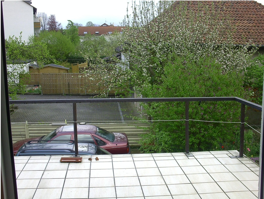
Niedervellmarsche Str. 19a