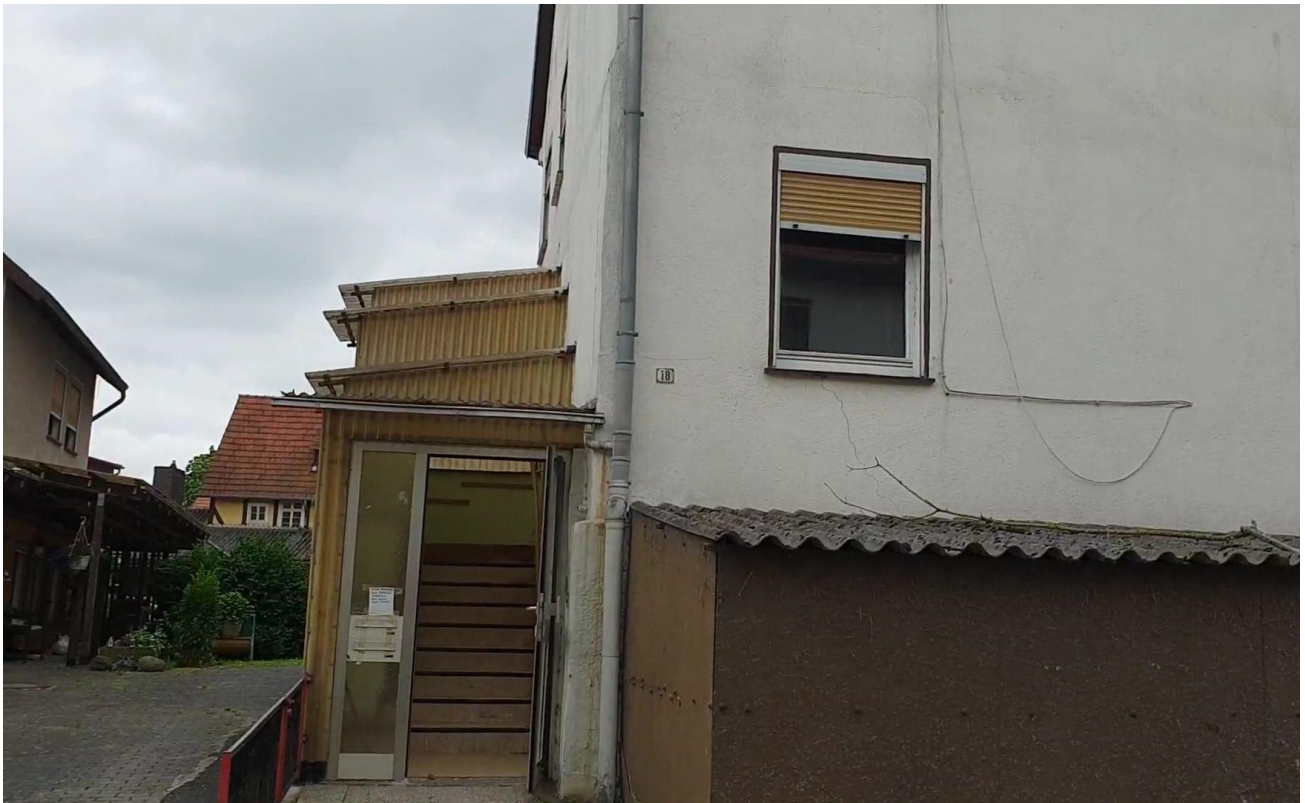
Hauptstr. 18, Hümme