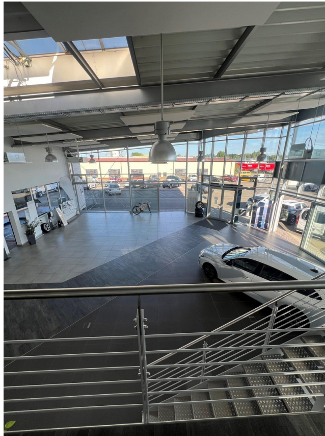
Eingangsbereich / Annahme