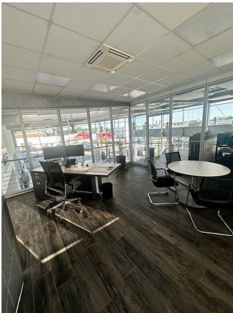
Büro / Bürofläche oben