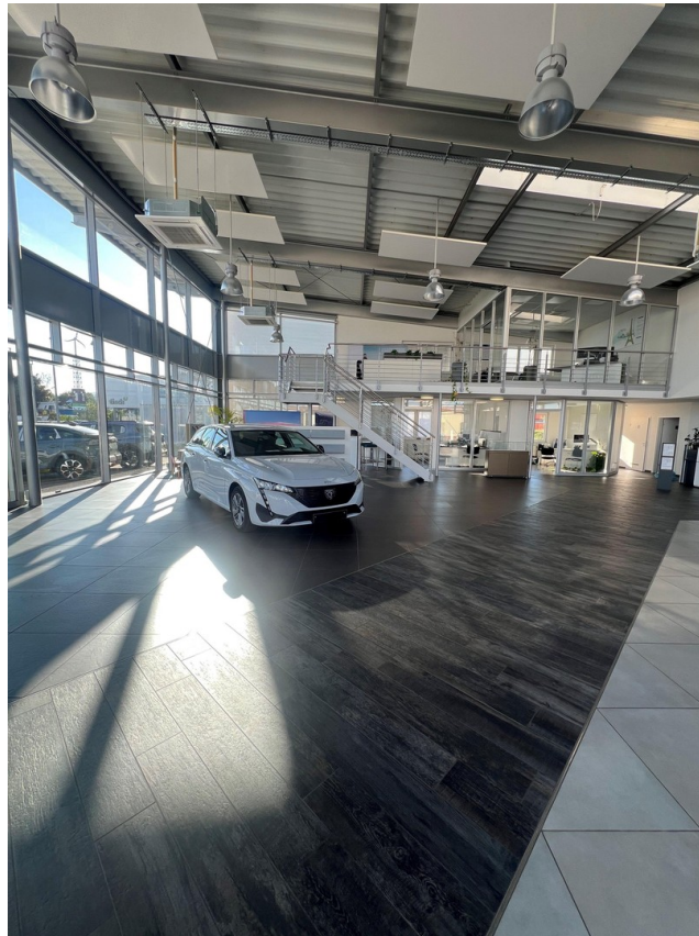
Eingangsbereich / Bürofläche