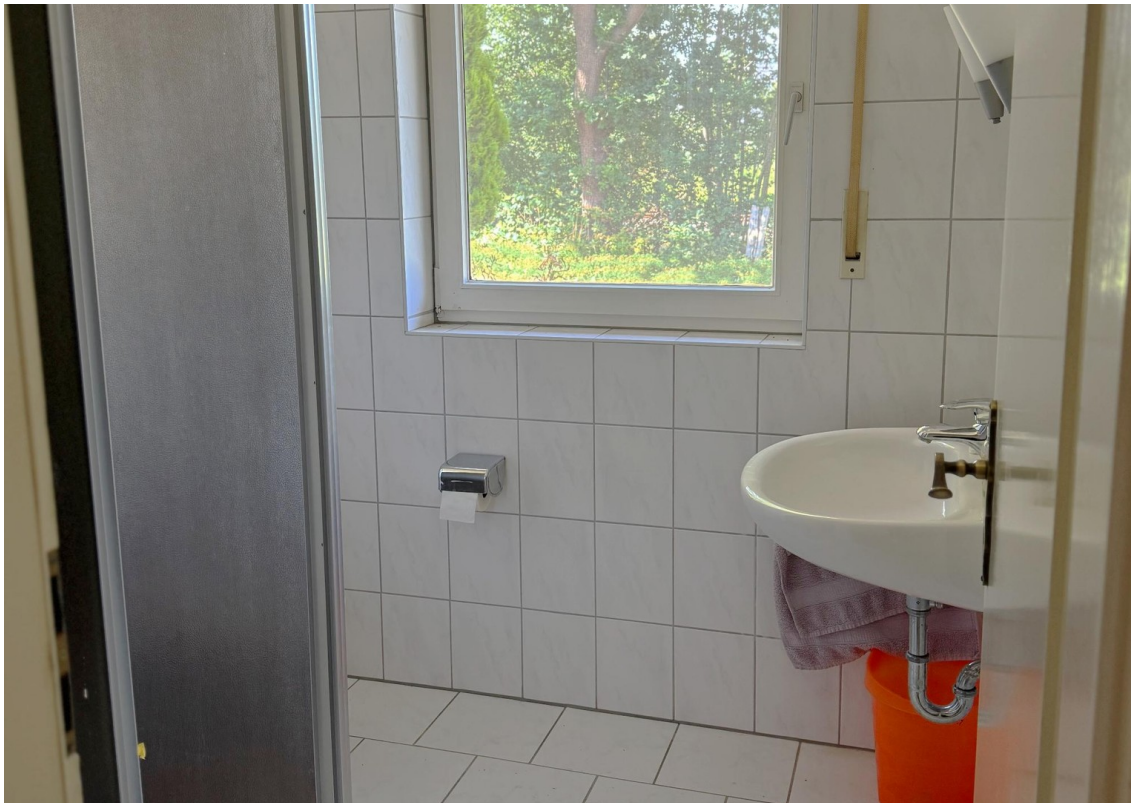
Gäste WC EG