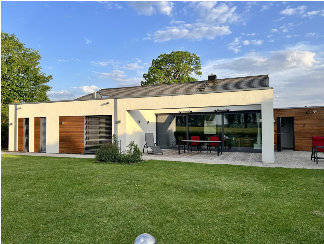
Hausansicht von hinten