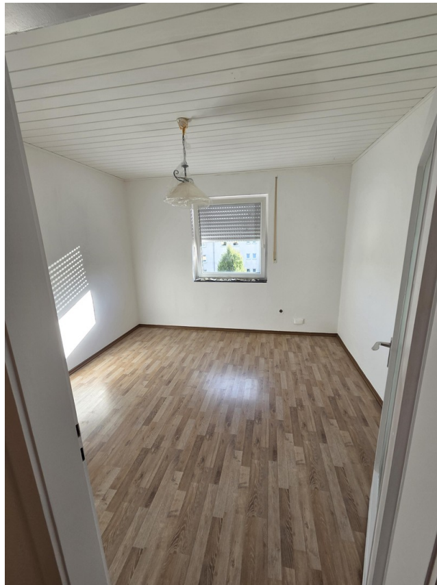
Erstes Zimmer rechts