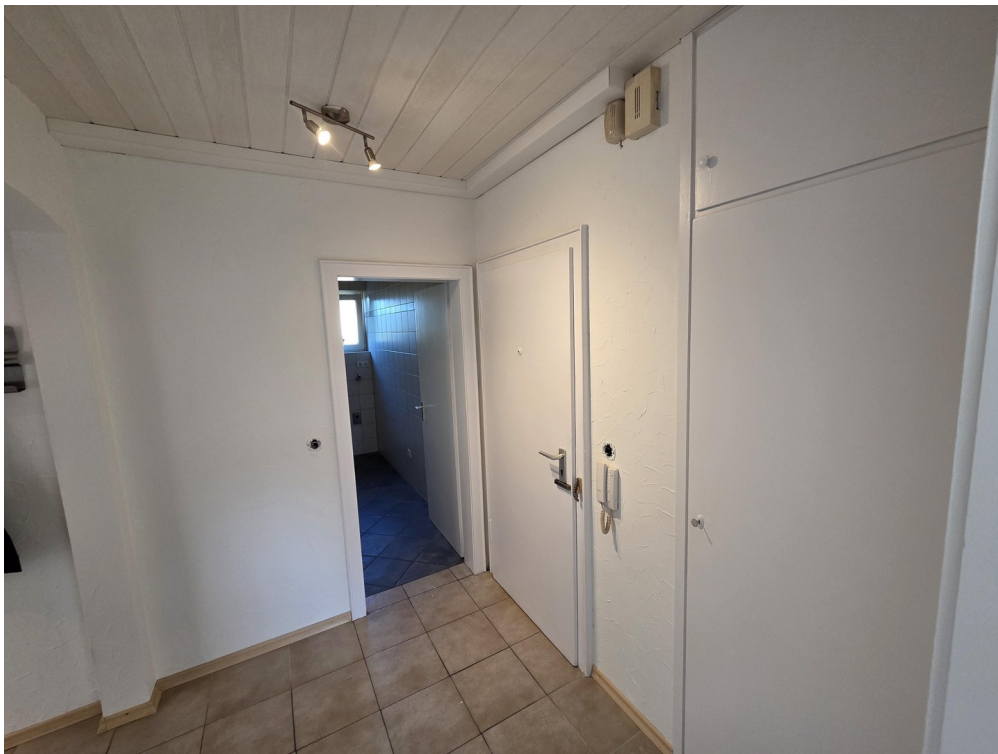
Blick aus Tür Zimmer