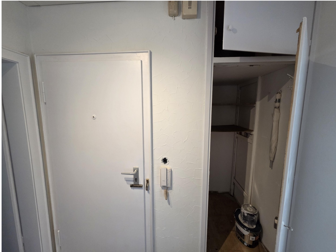
Wohnungstür und Abstellkammer