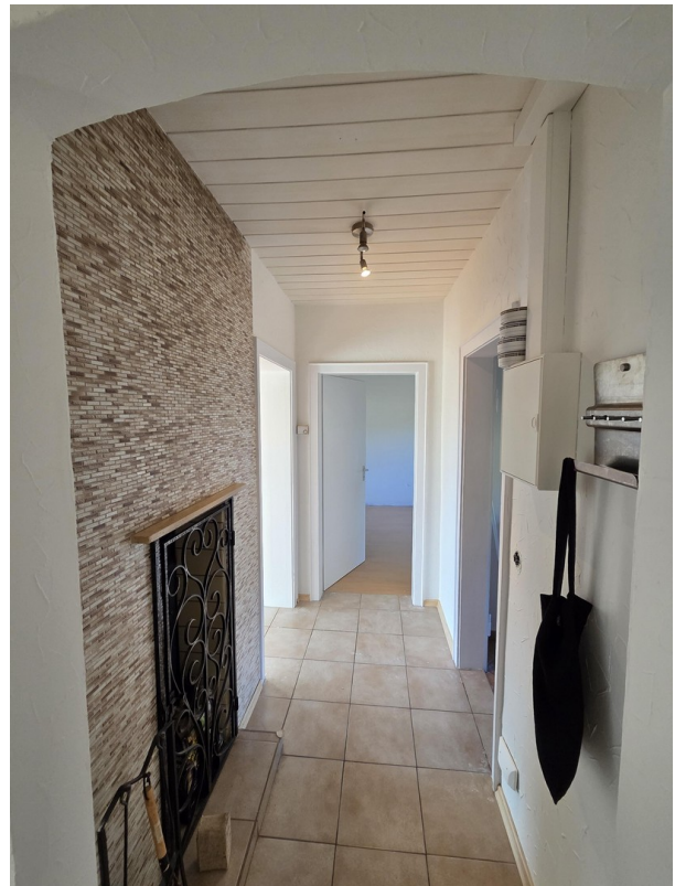
Blick in Wohnungsflur