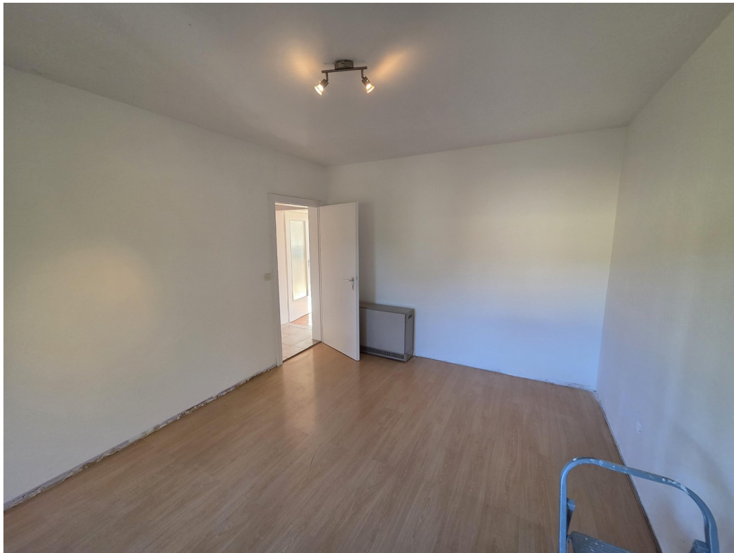
Zweites Zimmer (innen)