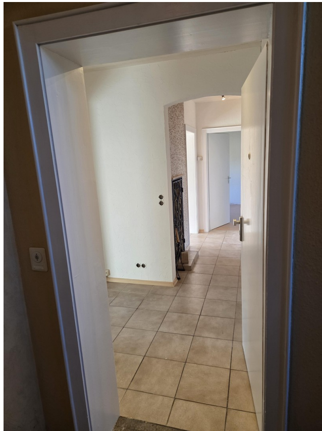
Blick vom Wohnungstüreingang