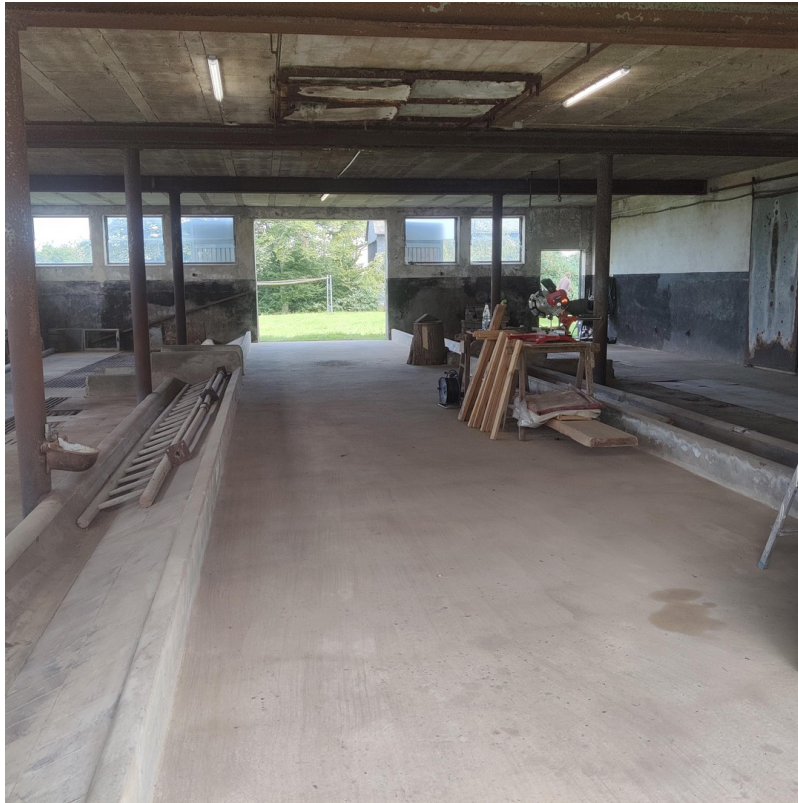
ehem. Stall Bild 1