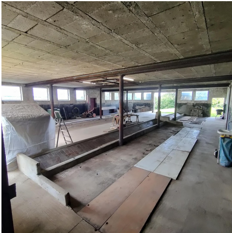
ehem. Stall Bild 2