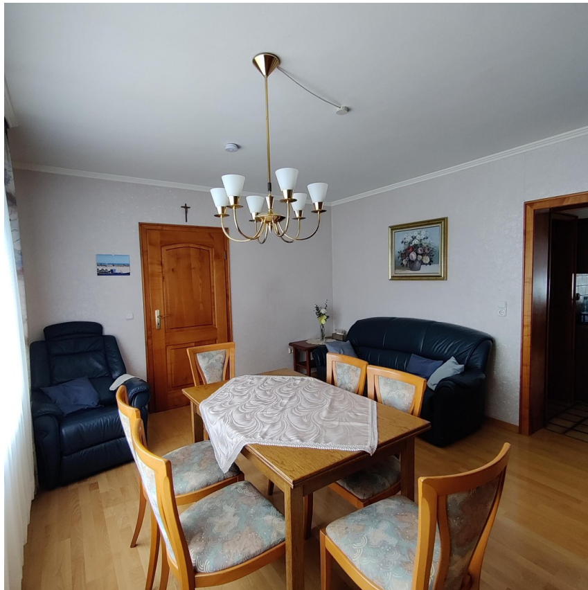
EZ Haus 1 B1