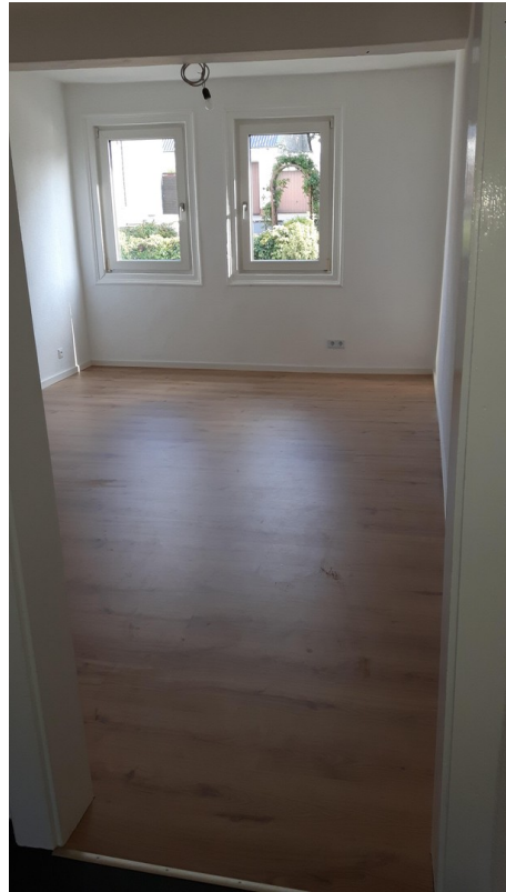
Zi 4 Haus 2