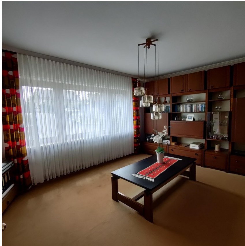
WZ Haus 1 B1