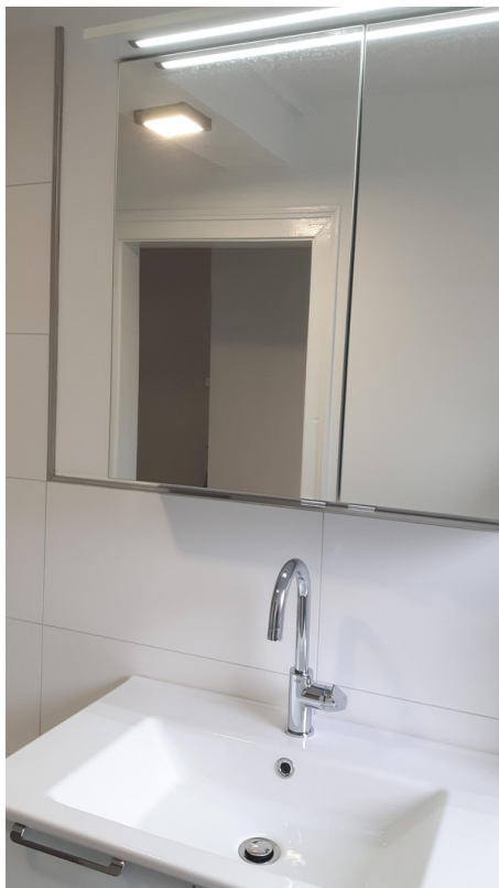
Bad Haus 2 B 2