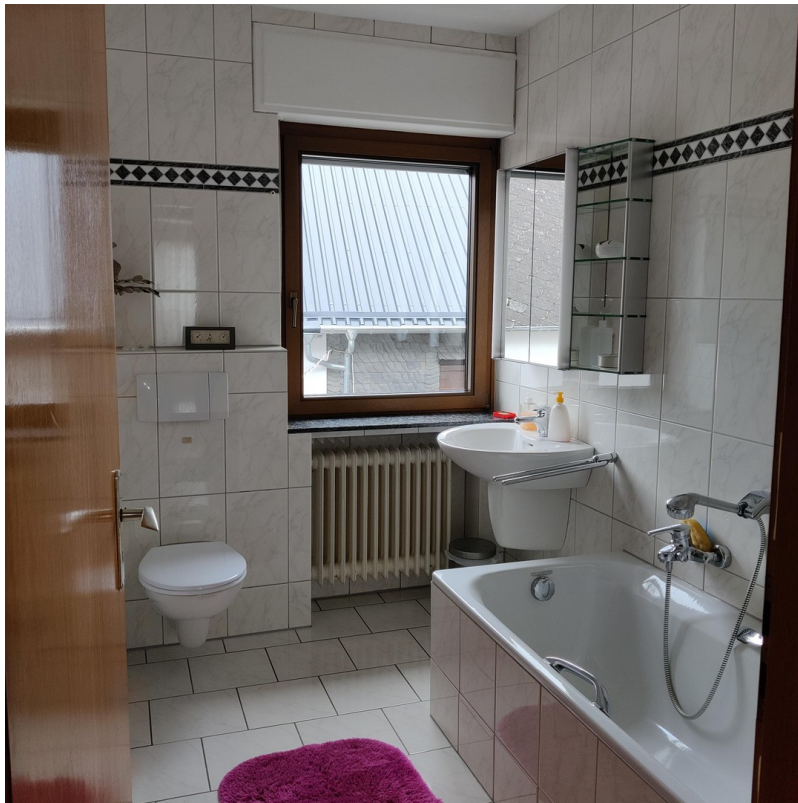
Bad OG Haus 1 B1