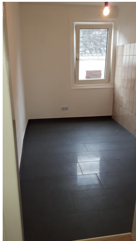
Küche EG Haus 2