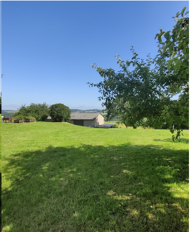
Wiese mit Aussicht B2