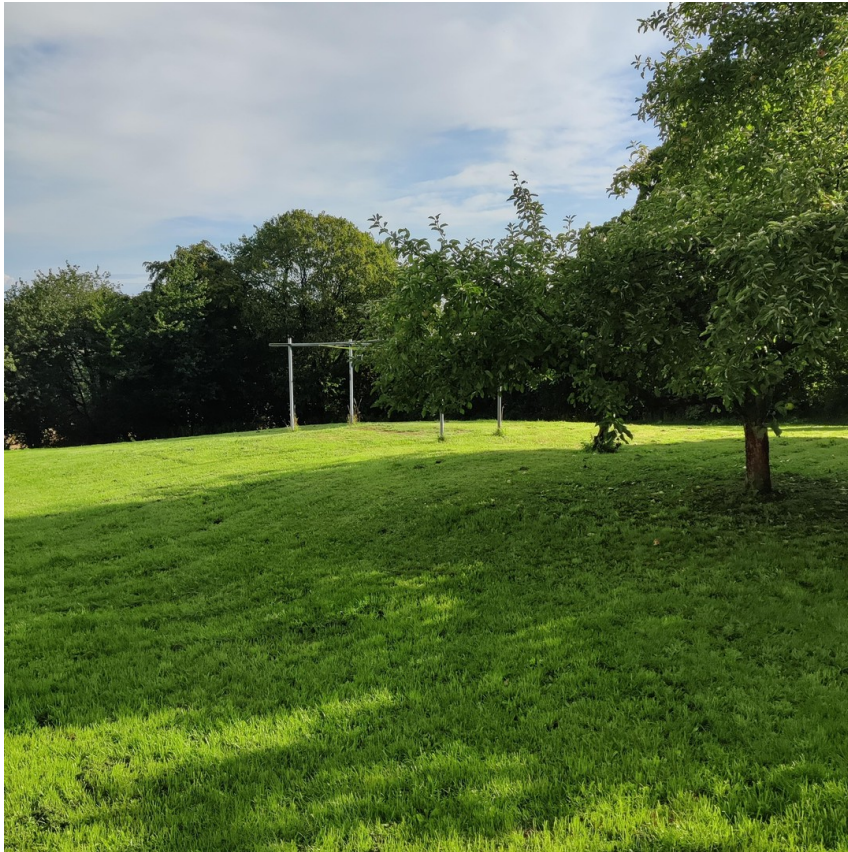
Wiese hinter den Häusern B1