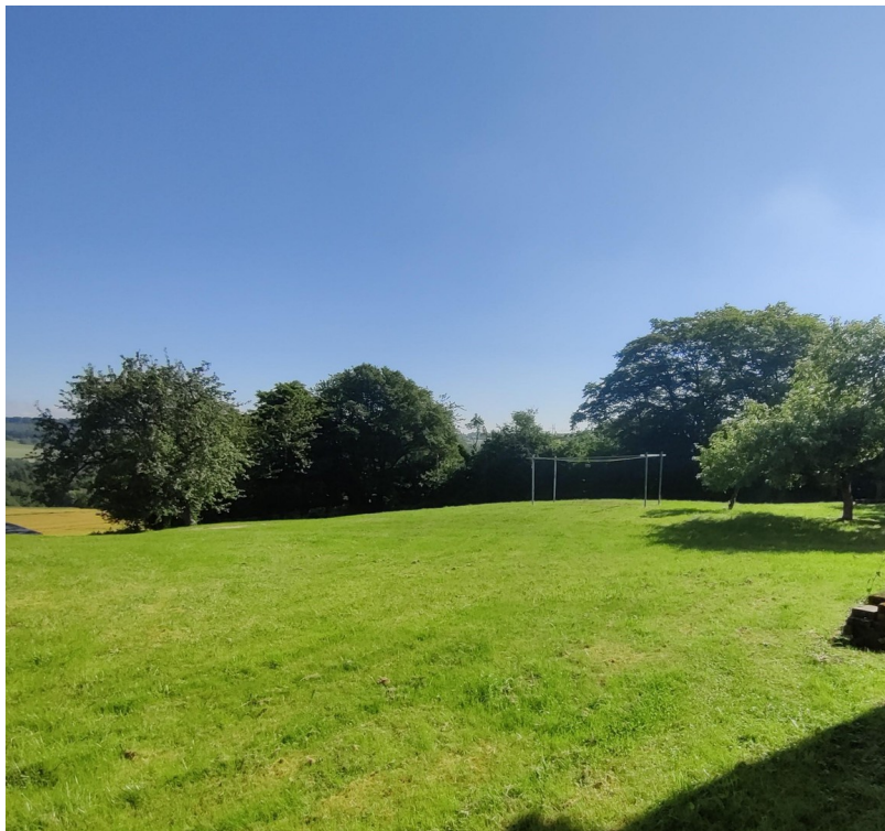
Wiese hinter den Häusern B2