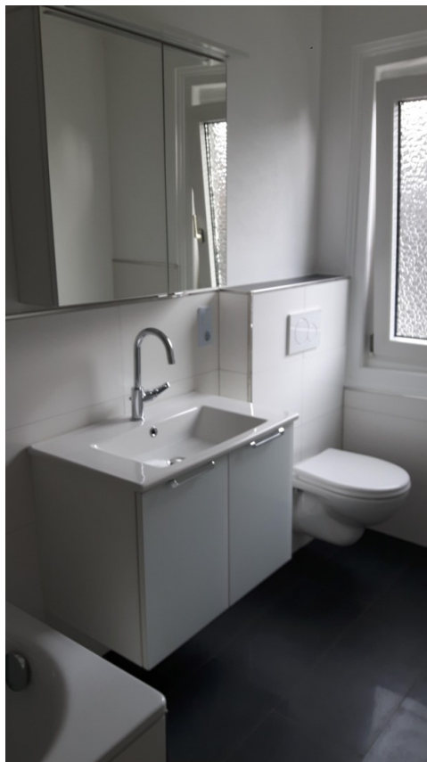
Bad Haus 2 B1