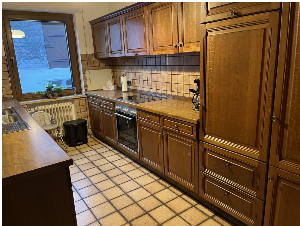
Küche Haus 1 B1