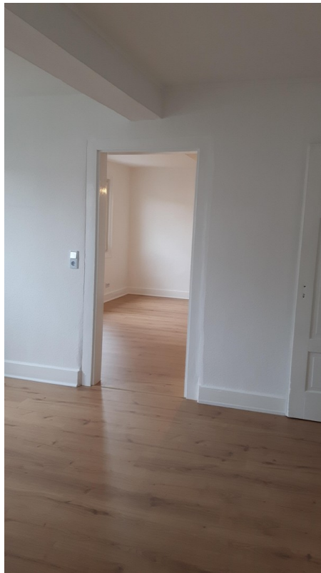
Zimmer 1 u. 2 OG Haus 2