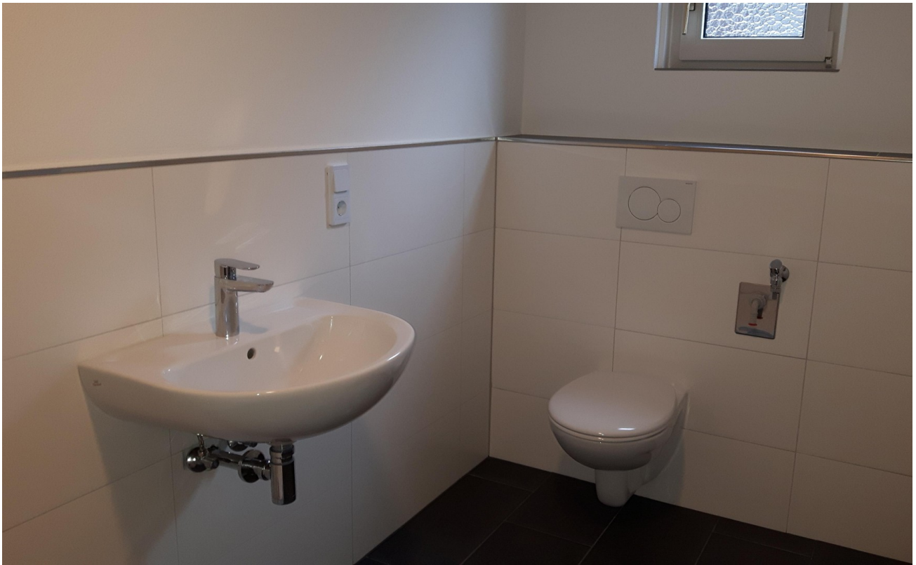
Bad Haus 2 B3