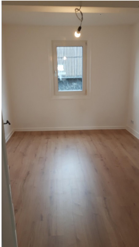
Zi 1 Haus 2