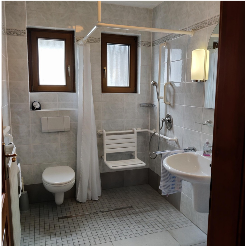
Bad EG Haus 1 B1