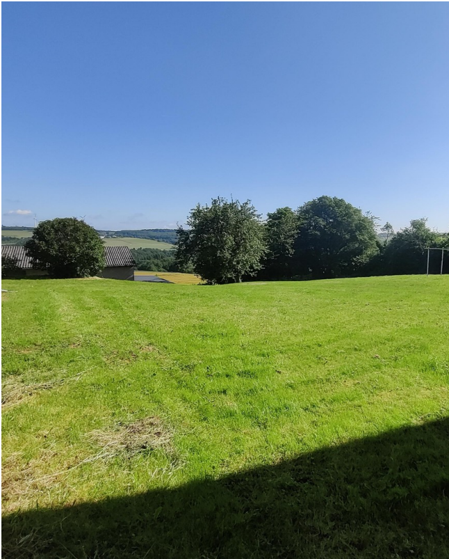
Wiese mit Aussicht B1