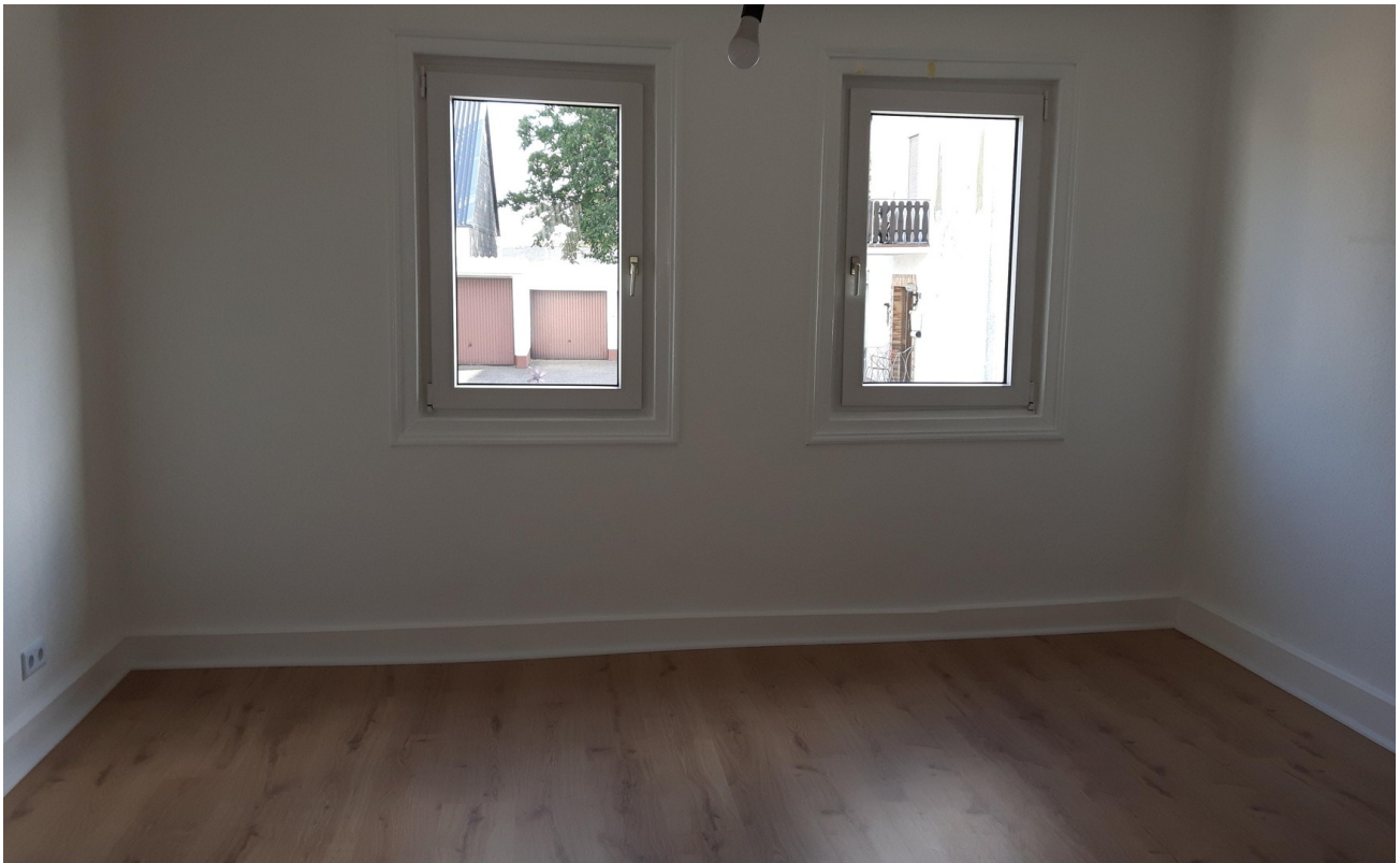
Zi 3 Haus 2