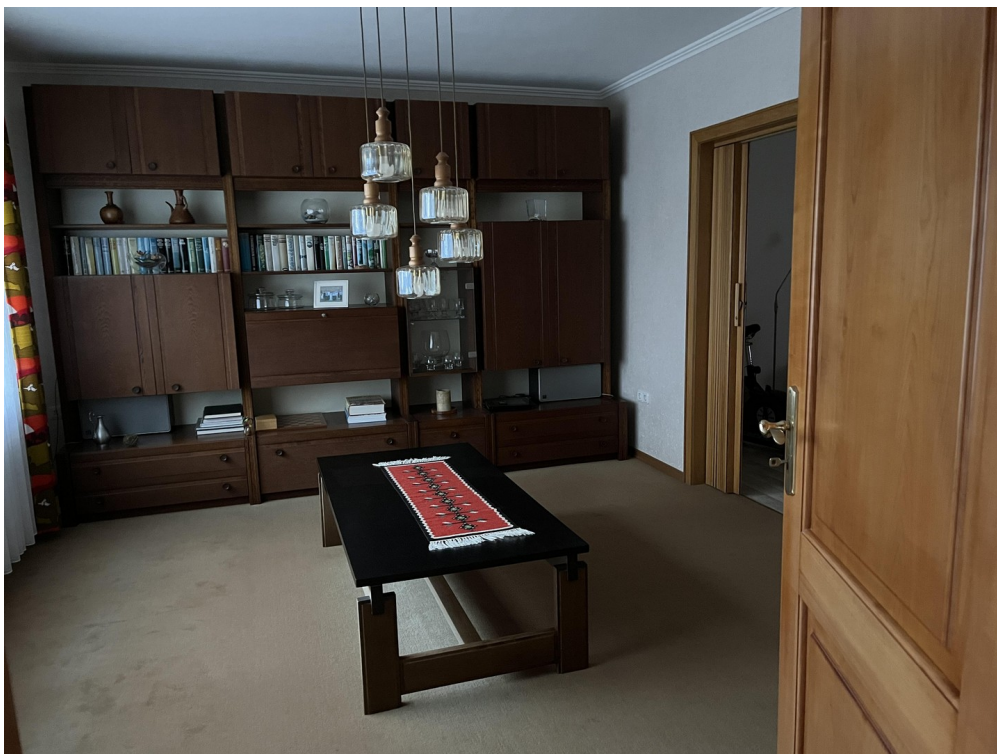
Wz Haus 1 B2