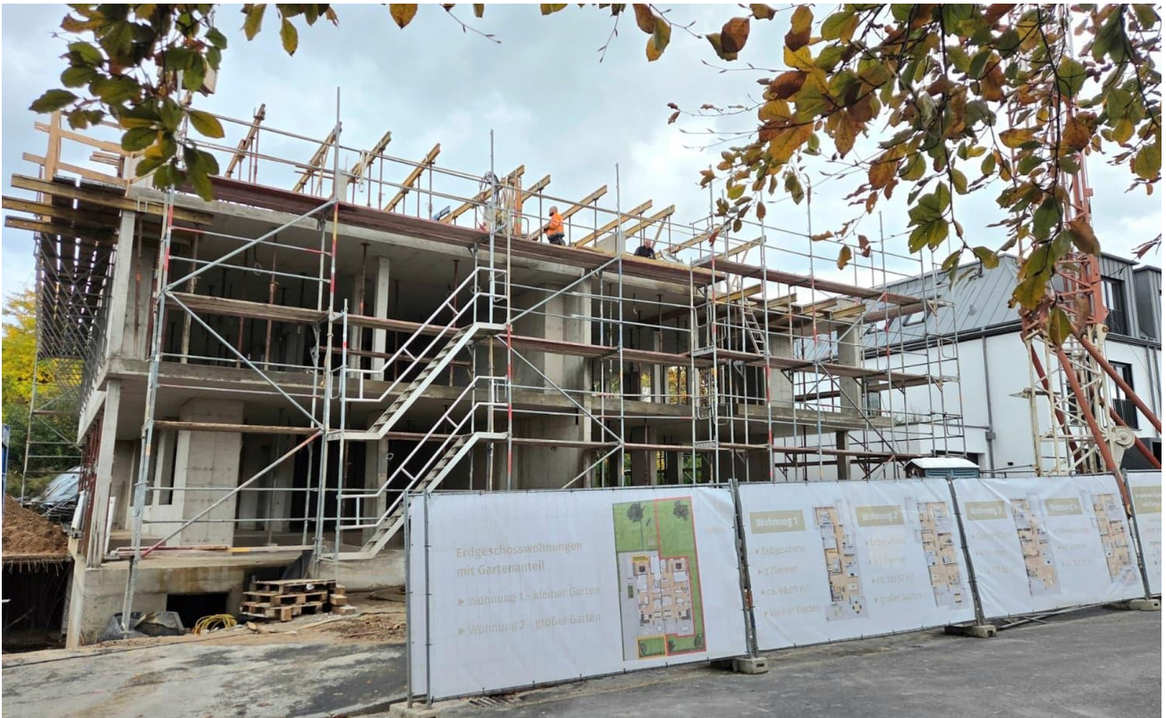
Bautenstand Oktober 2025