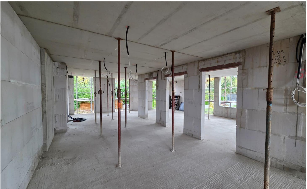
Bautenstand Oktober 2025Bauten