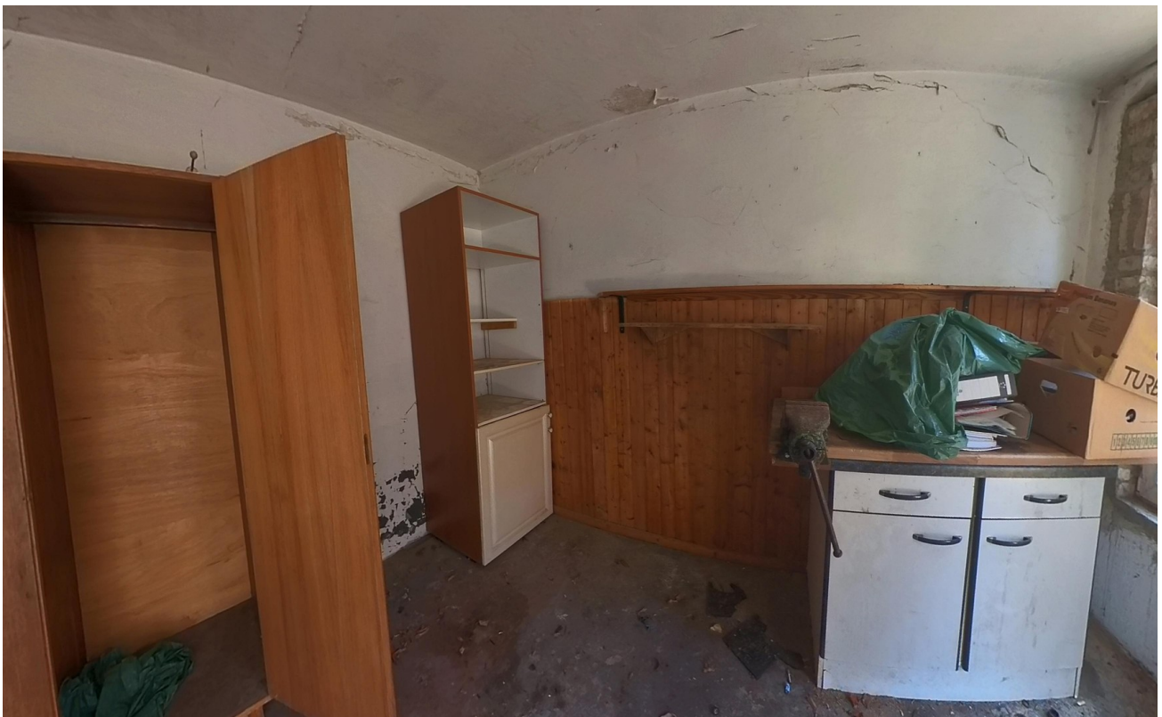
Nebengebäude Raum 1