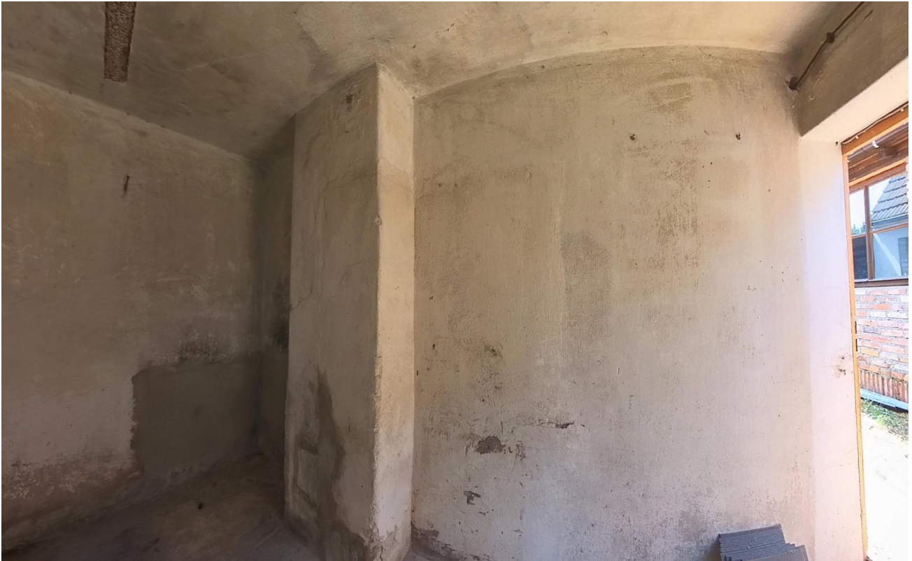
Nebengebäude Raum 2