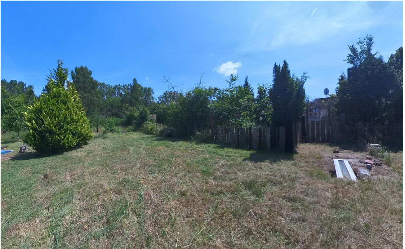
Garten auf dem Hof