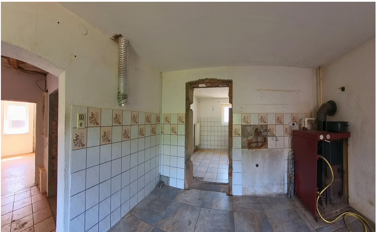
Küche zum Bad