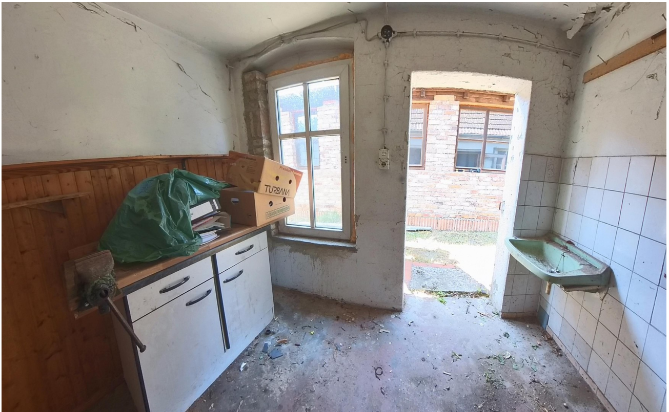
Nebengebäude Raum 1