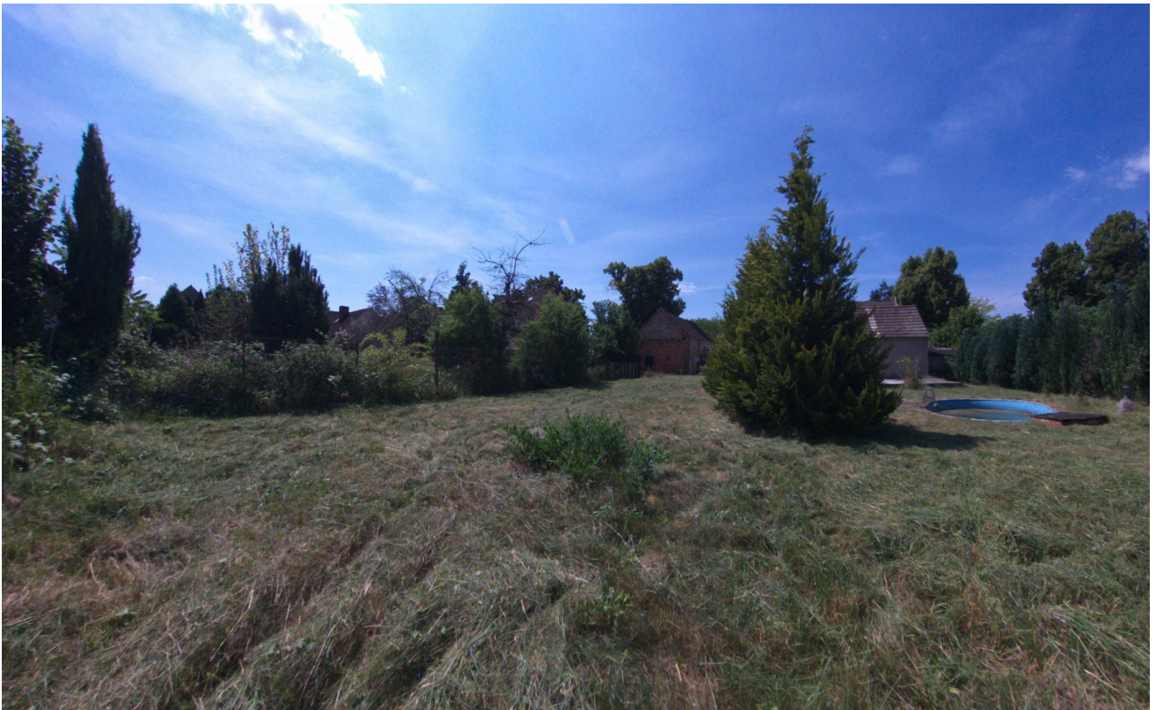
Garten zum Hof