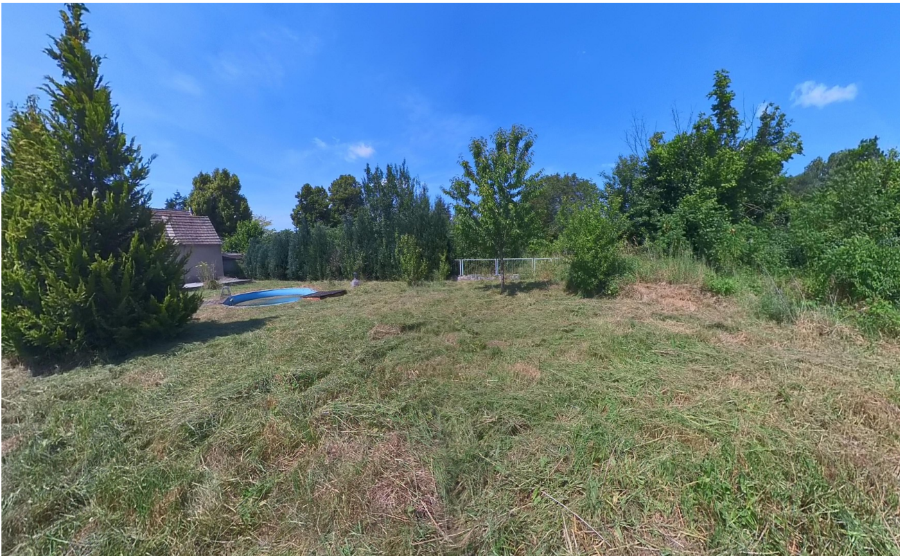
Garten zum Pool