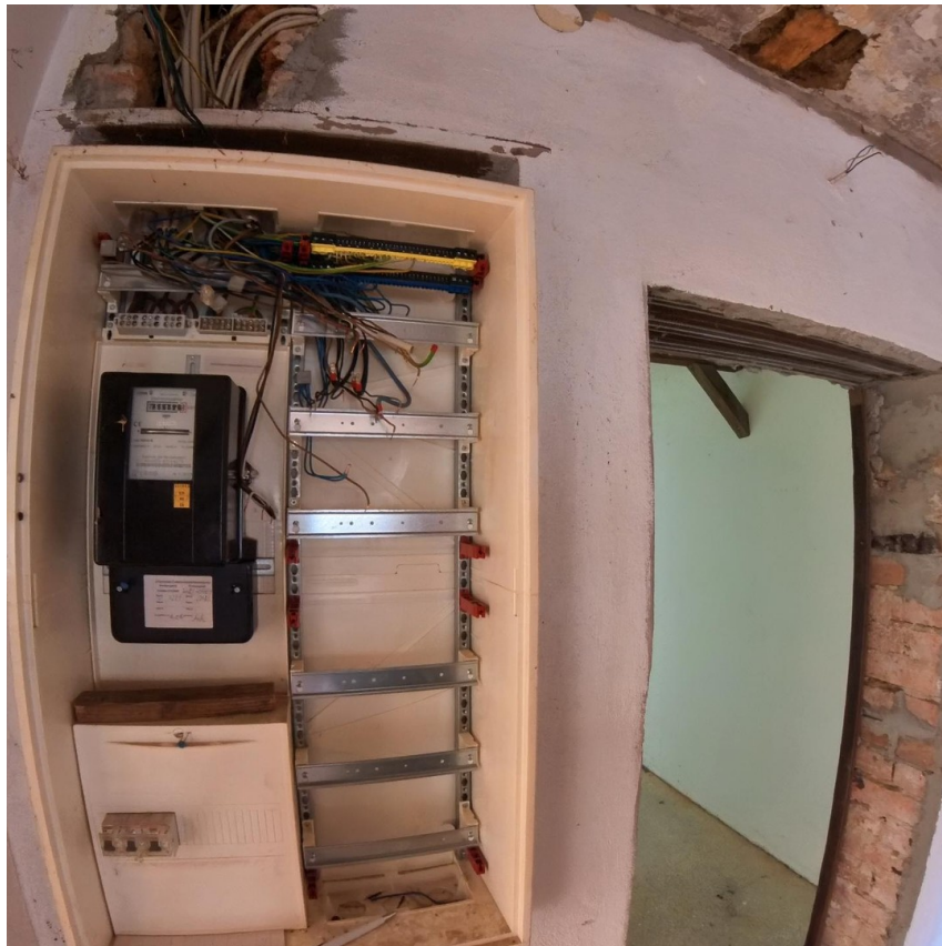
Zählerschrank zw gr. und kl. Z