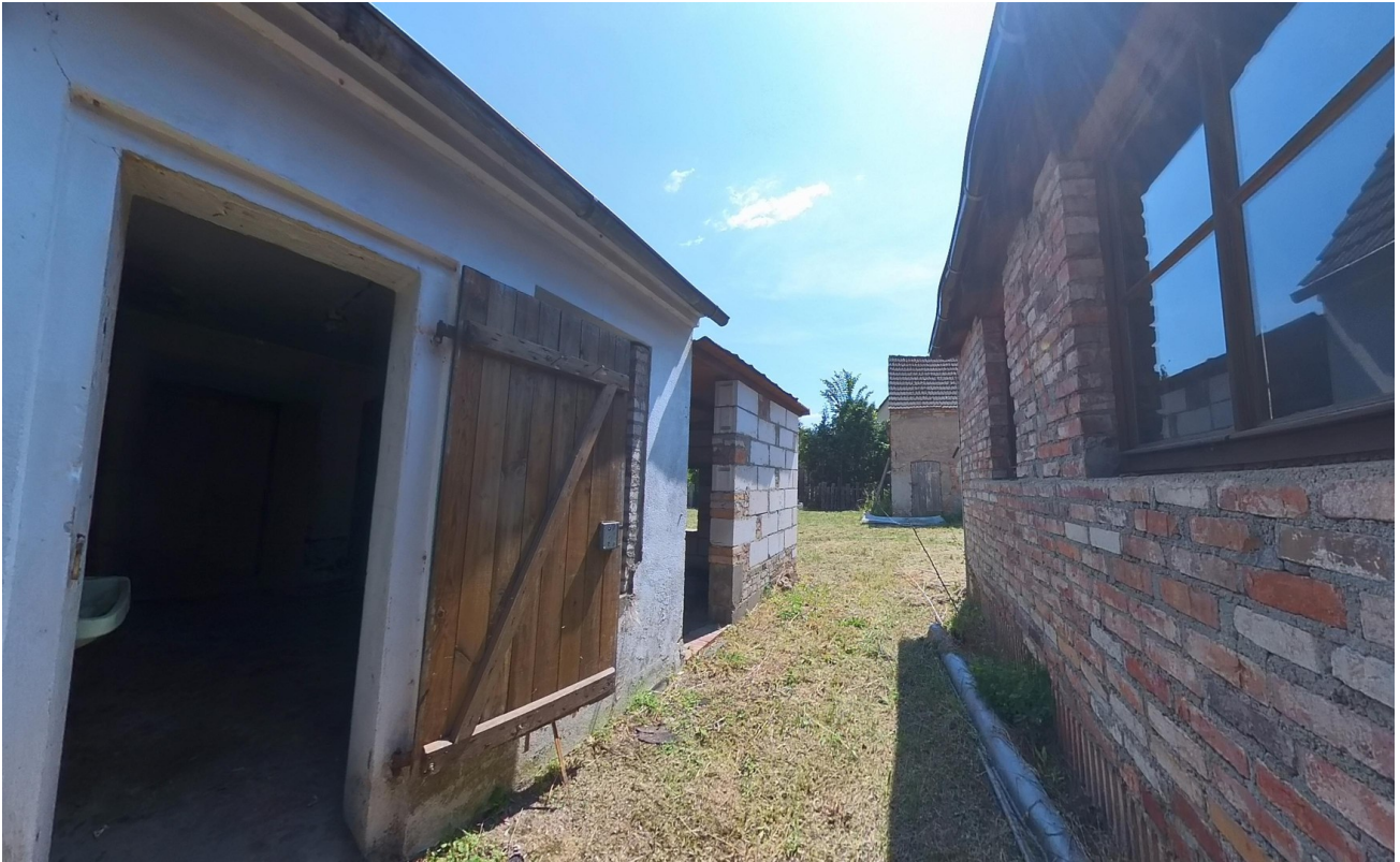
zwischen den Gebäuden