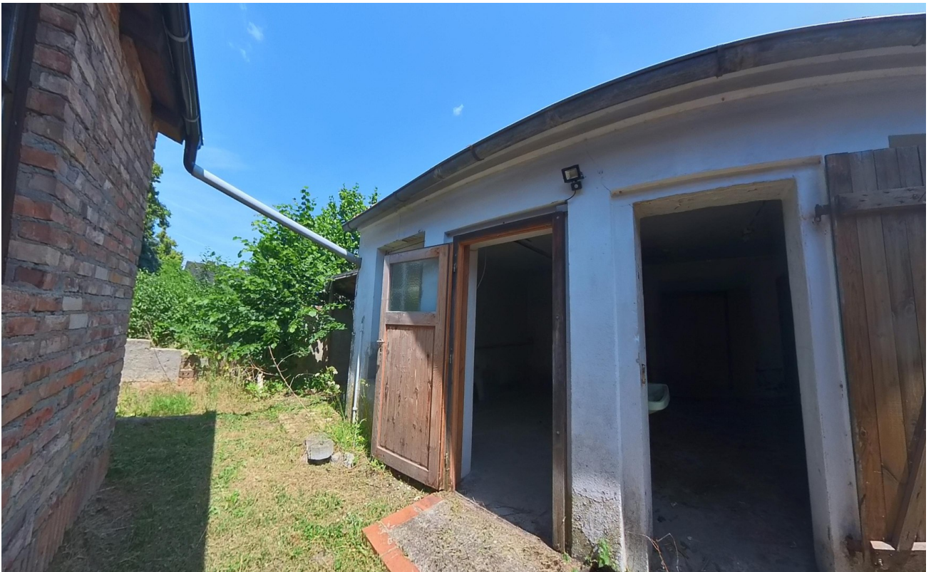
Nebengebäude Zugang R1&R2