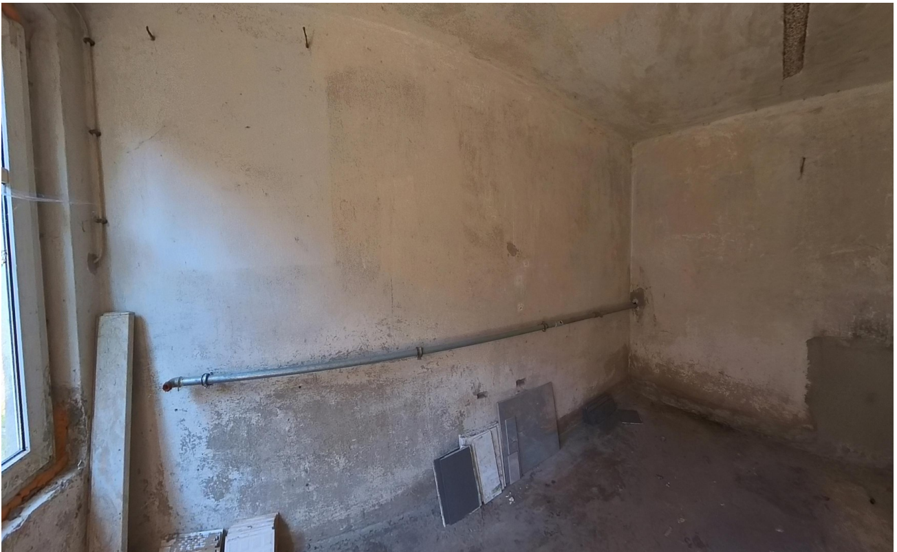
Nebengebäude Raum 2