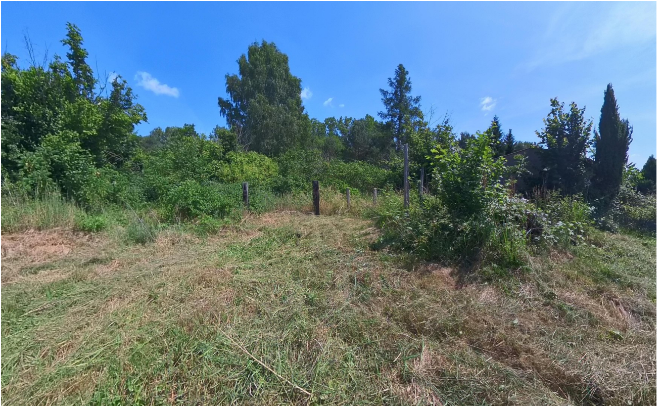
Garten zur Grundstücksgrenze