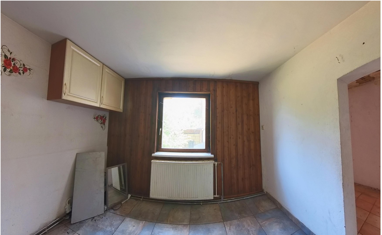
Küche zum Bad