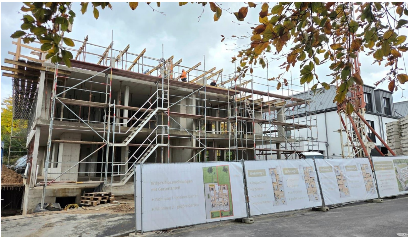
Bautenstand Oktober 2025