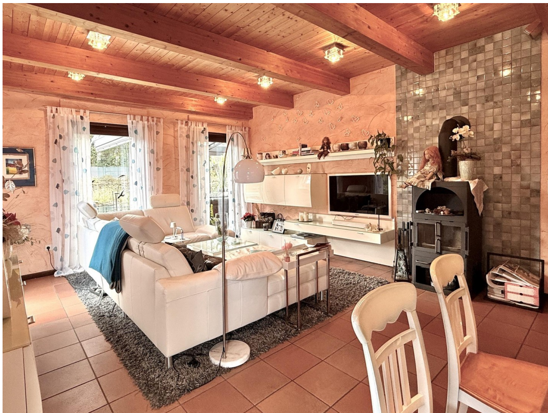
EG Wohnzimmer Bild 1