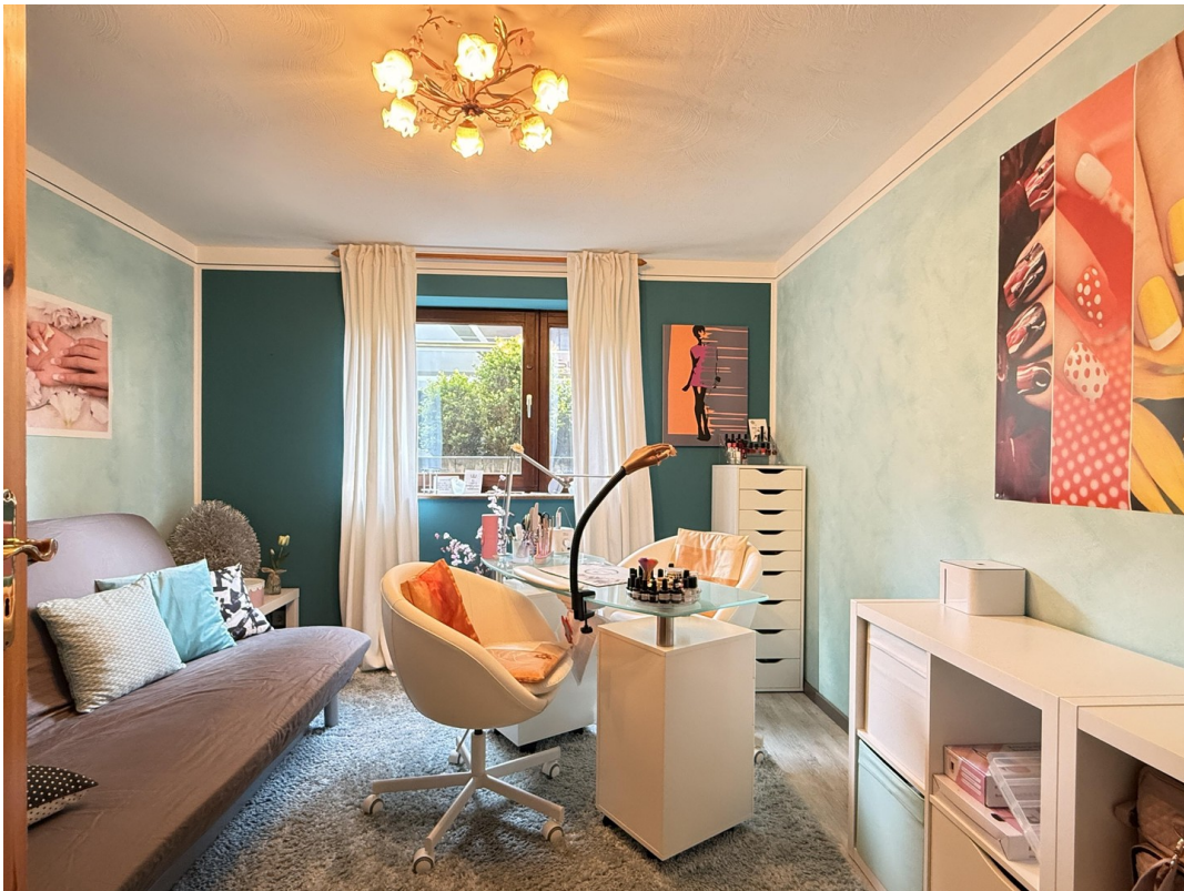
UG Gäste 1