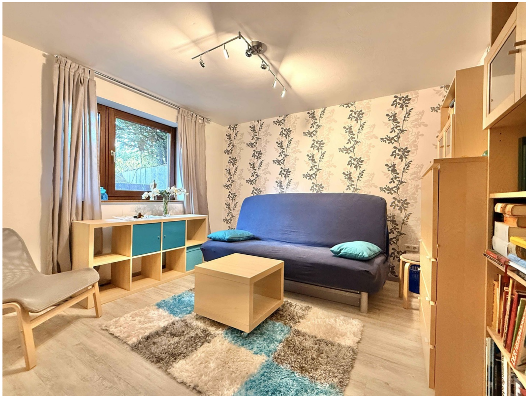
UG Gäste 2