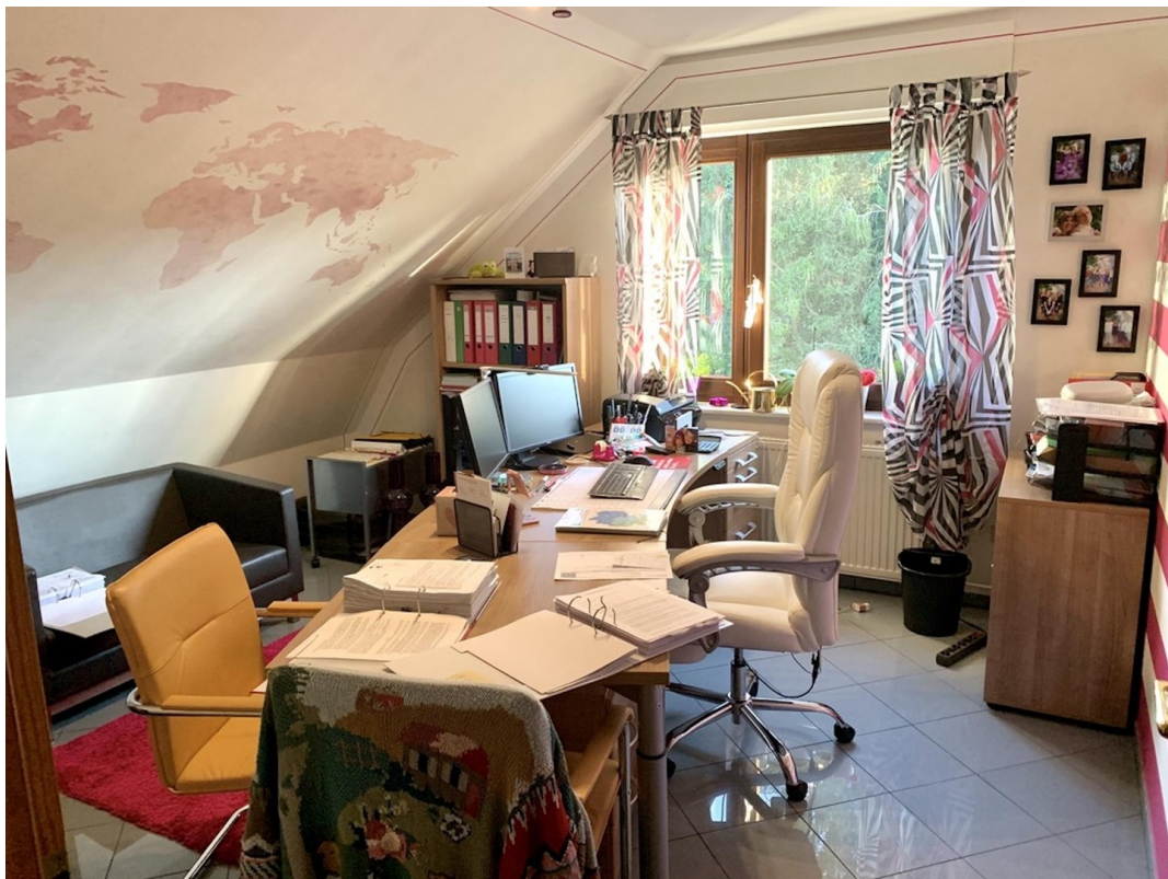
OG Büro 1