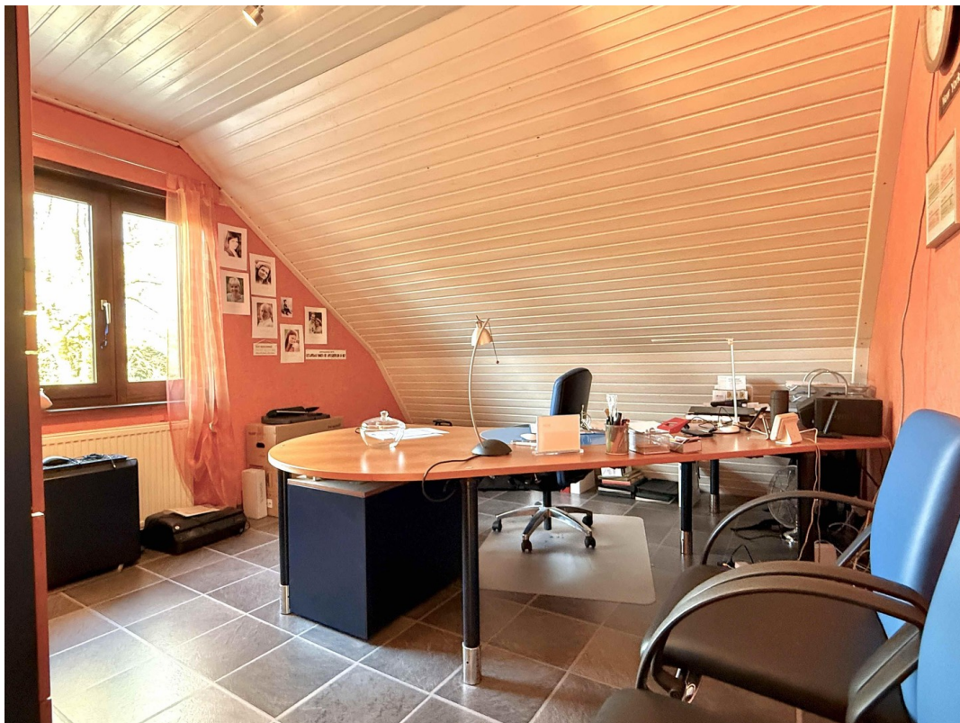
OG Büro 2