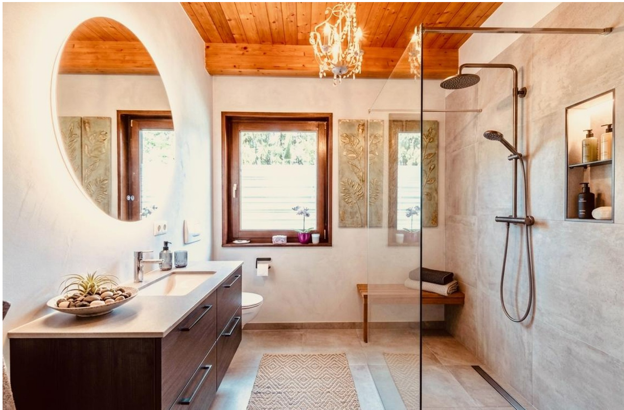
EG Bad KI generiert