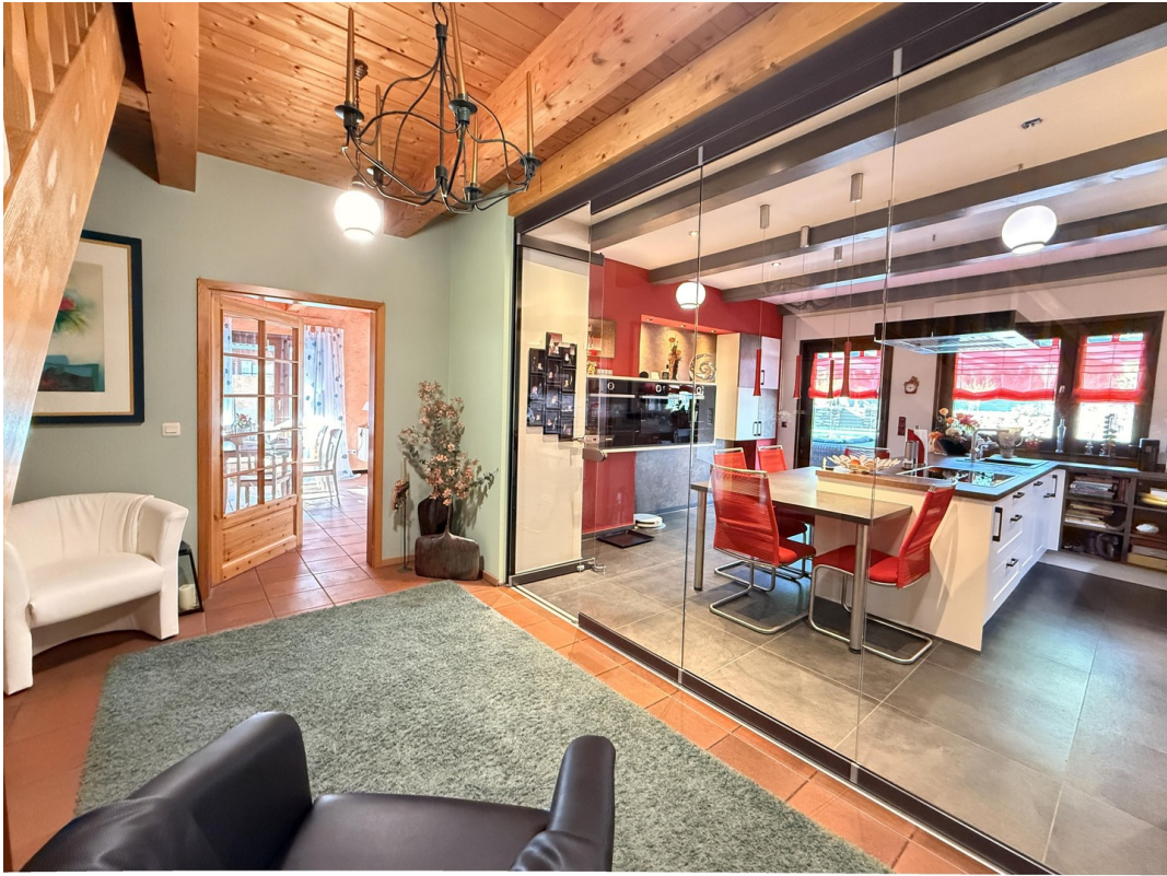
EG Diele Sicht auf Küche