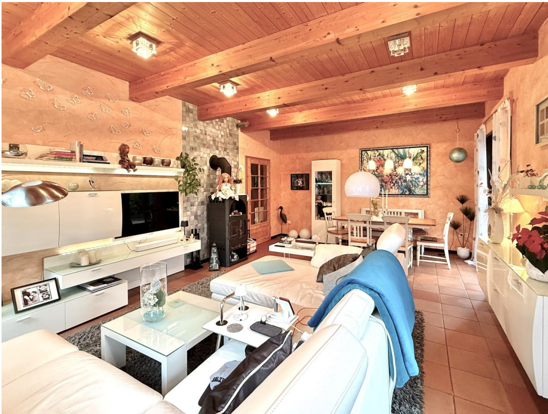
EG Wohnzimmer Bild 2