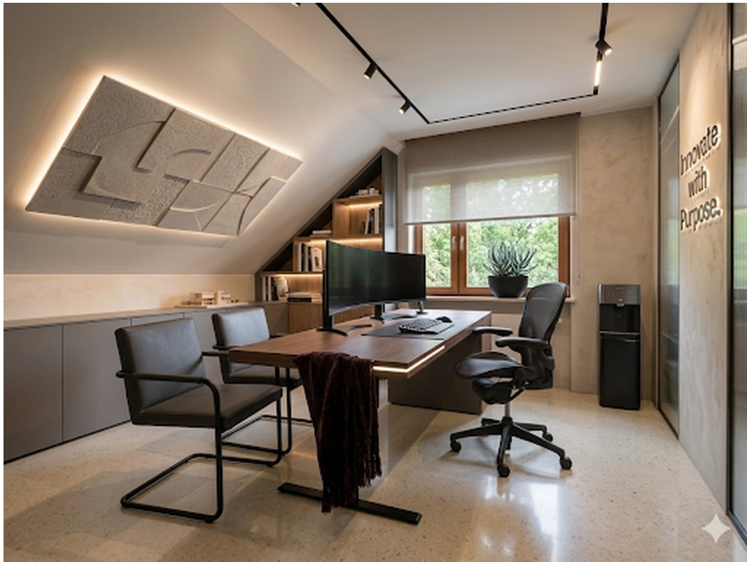
OG Büro 1 KI generiert