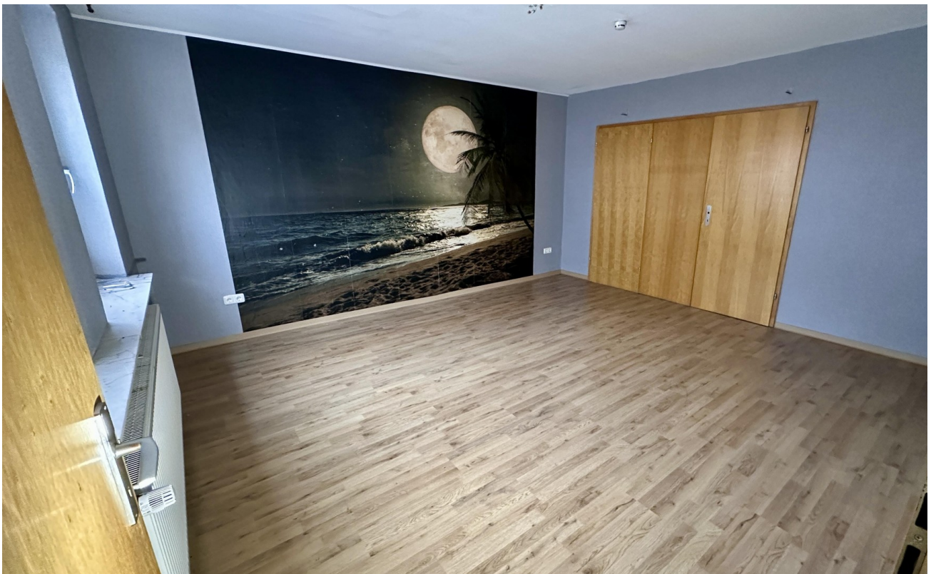
Zimmer 1 (vorne links)