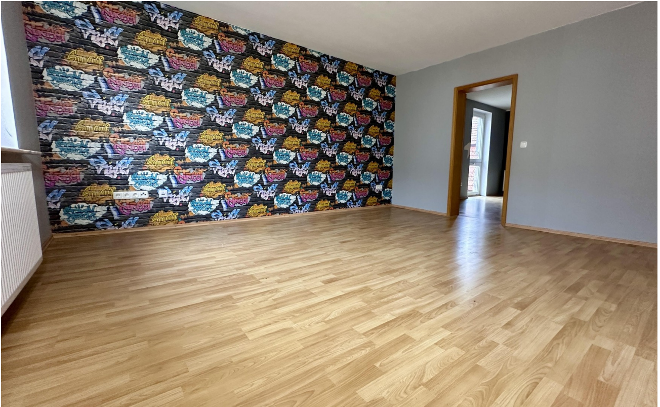
Zimmer 5 (vorne links)