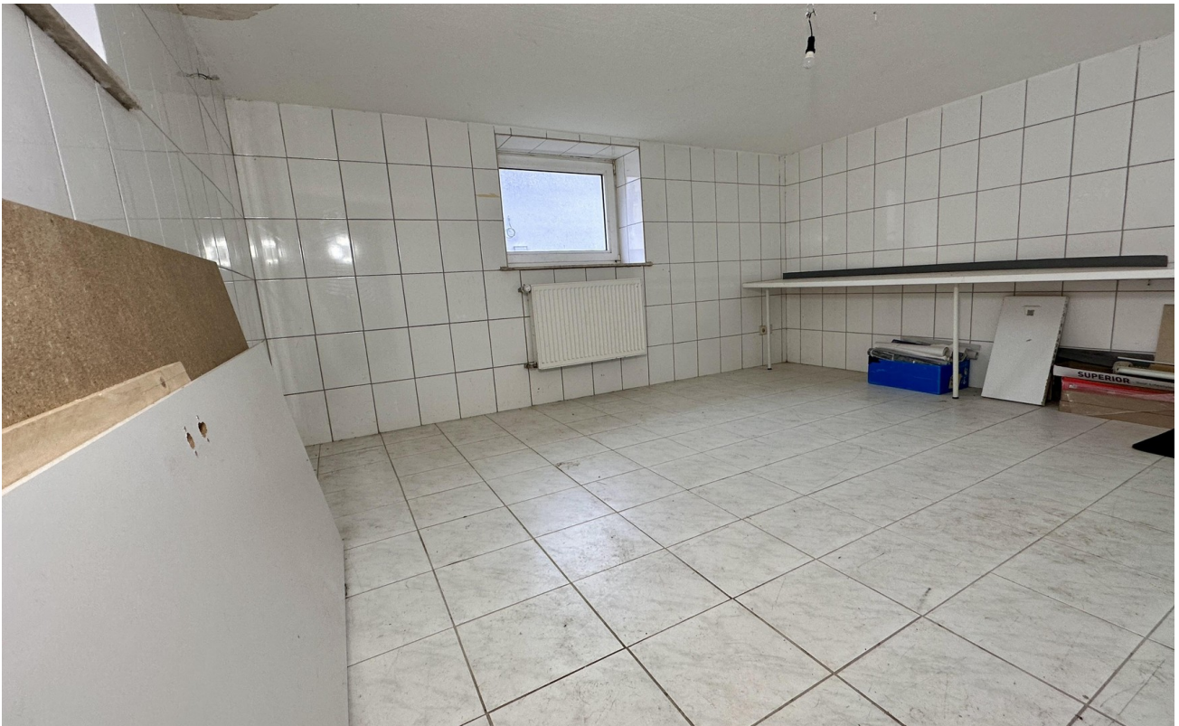
gefliester beheizter Keller