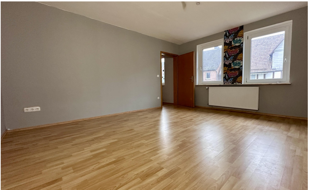
Zimmer 5 (vorne links)