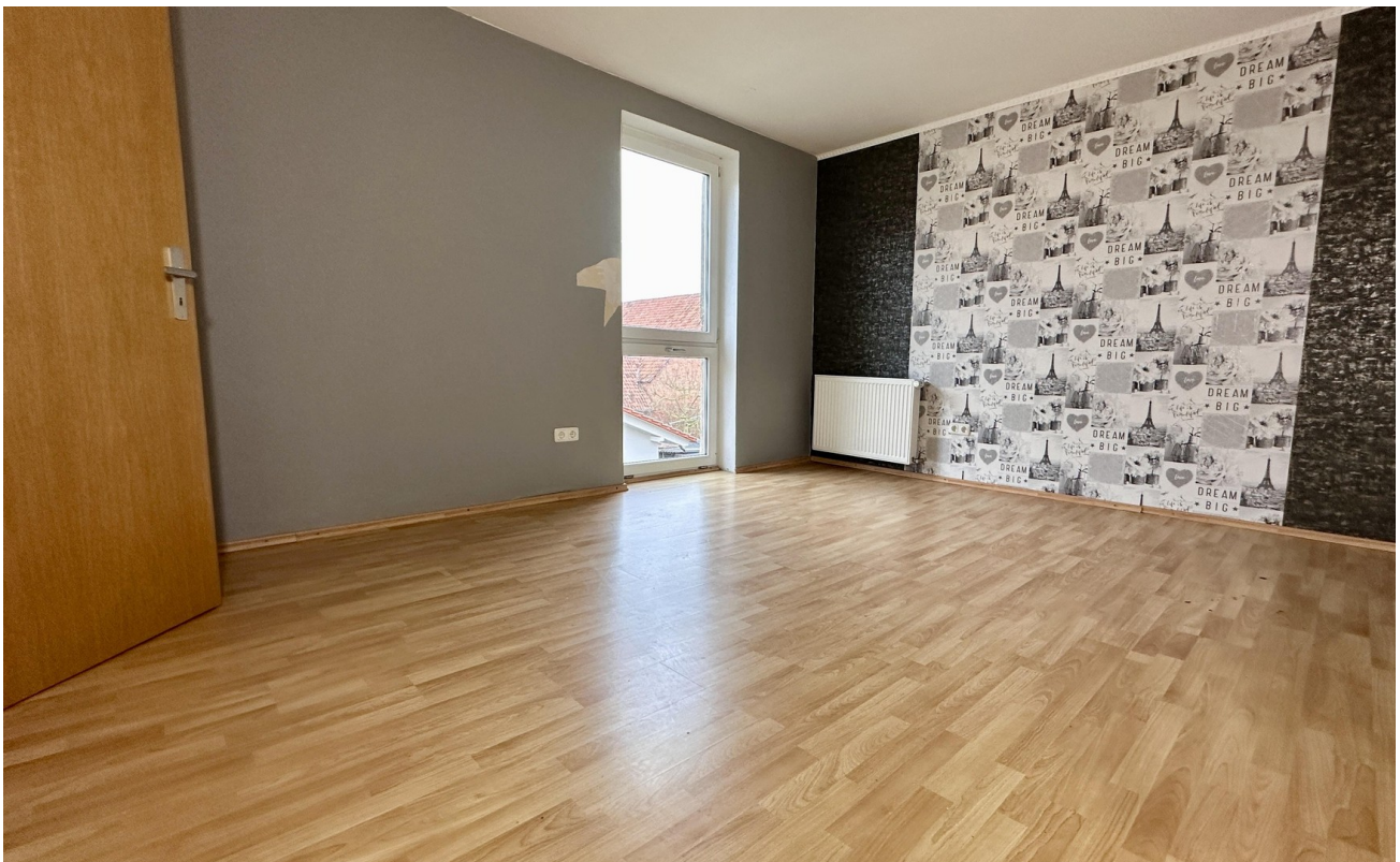
Zimmer 4 (hinten links)