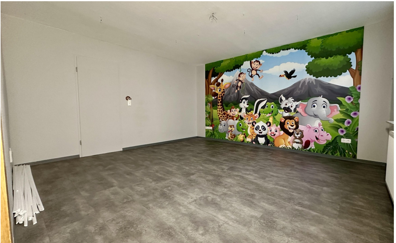
Zimmer 2 (vorne rechts)