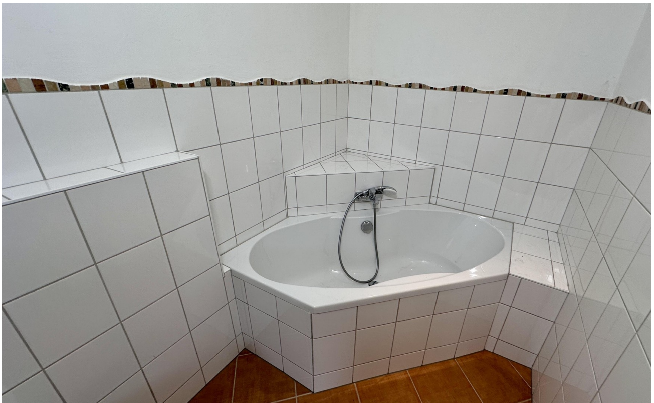
Badezimmer mit Eckbadewanne