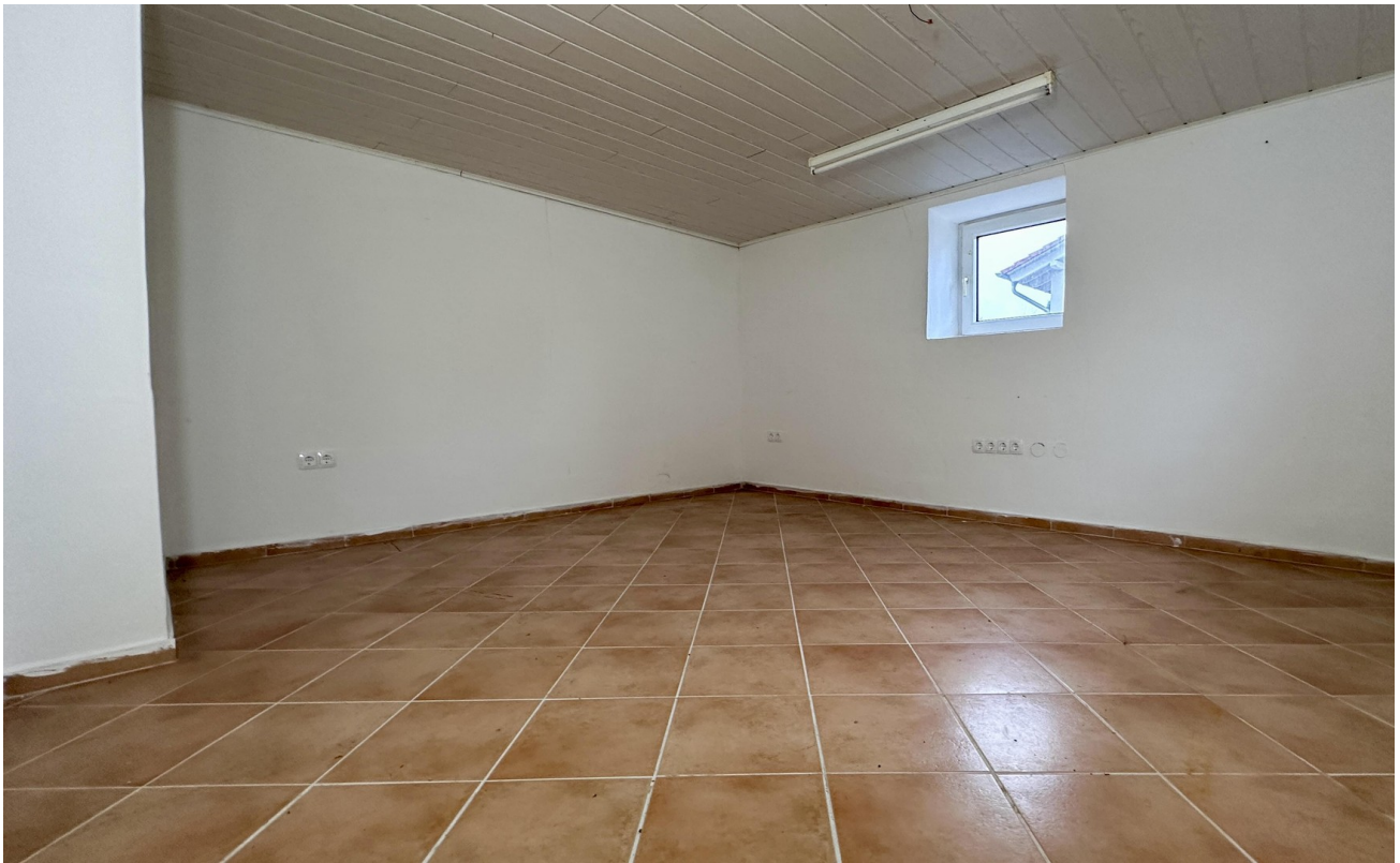
beheizter Raum (Keller)