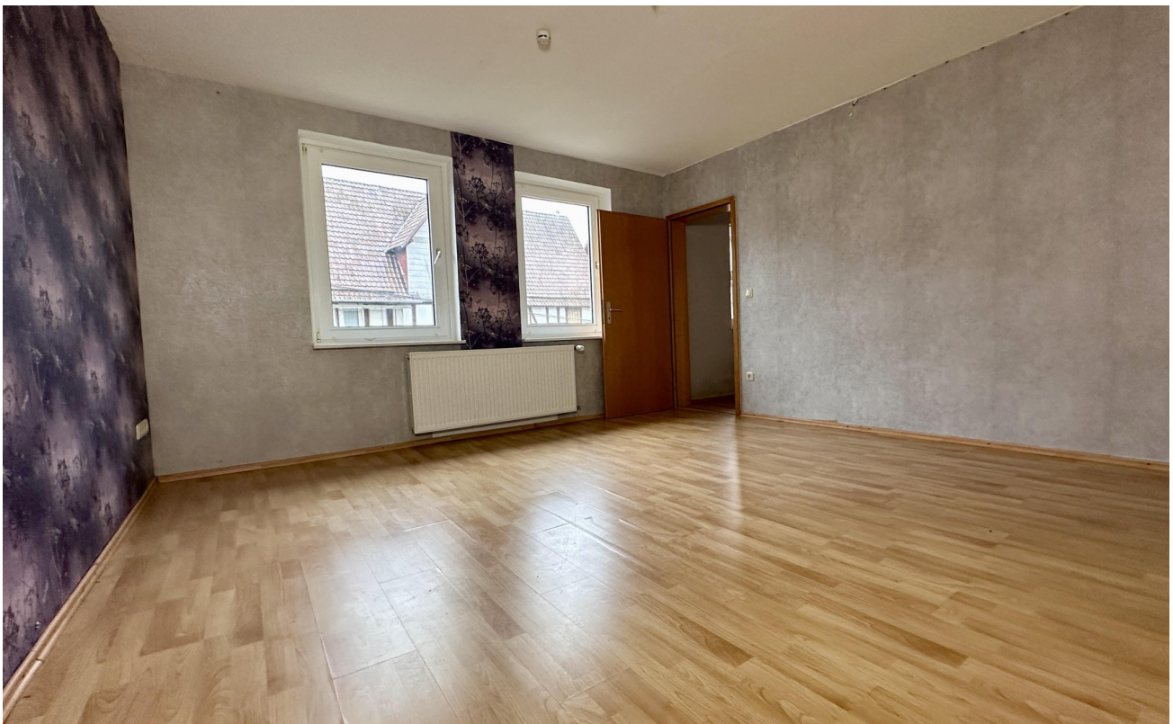
Zimmer 6 (vorne rechts)