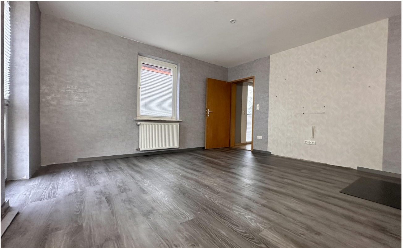
Zimmer 3 (hinten links)