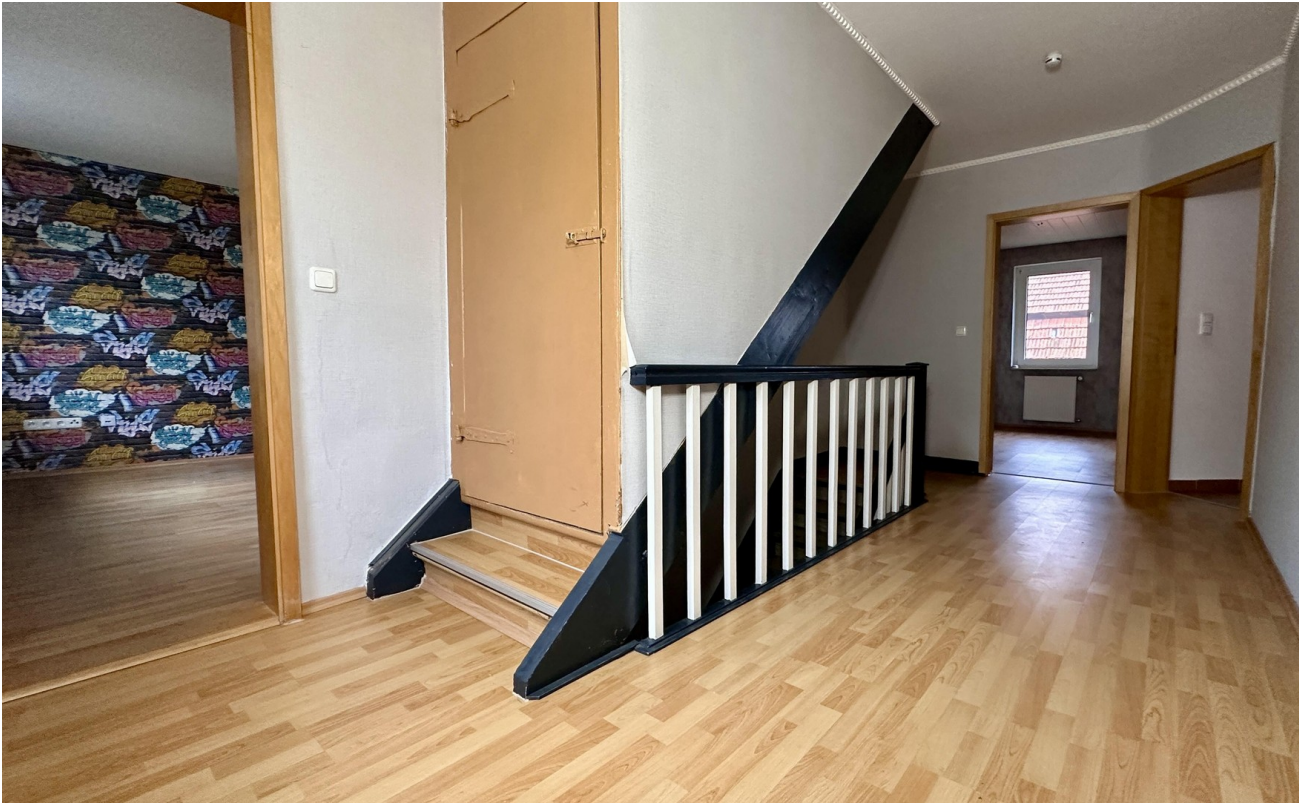
Flur & Zugang Dachboden