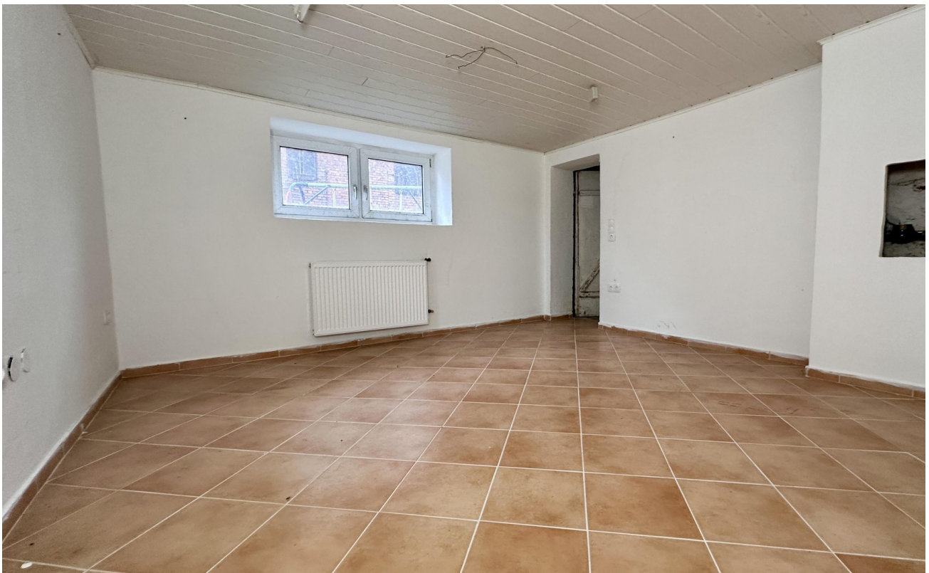
beheizter Raum (Keller)