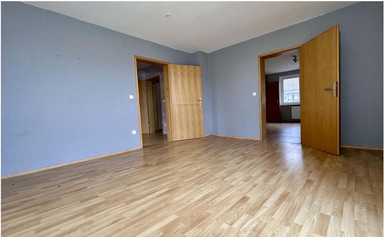
Zimmer 4 (hinten links)