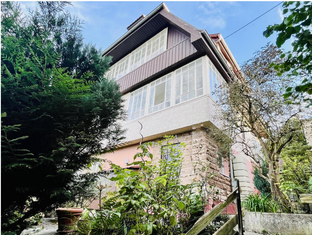
Rückansicht vom Garten