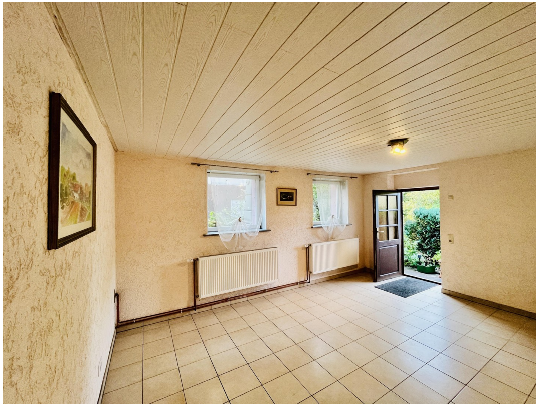
ausgebautes Zimmer 1 (UG)