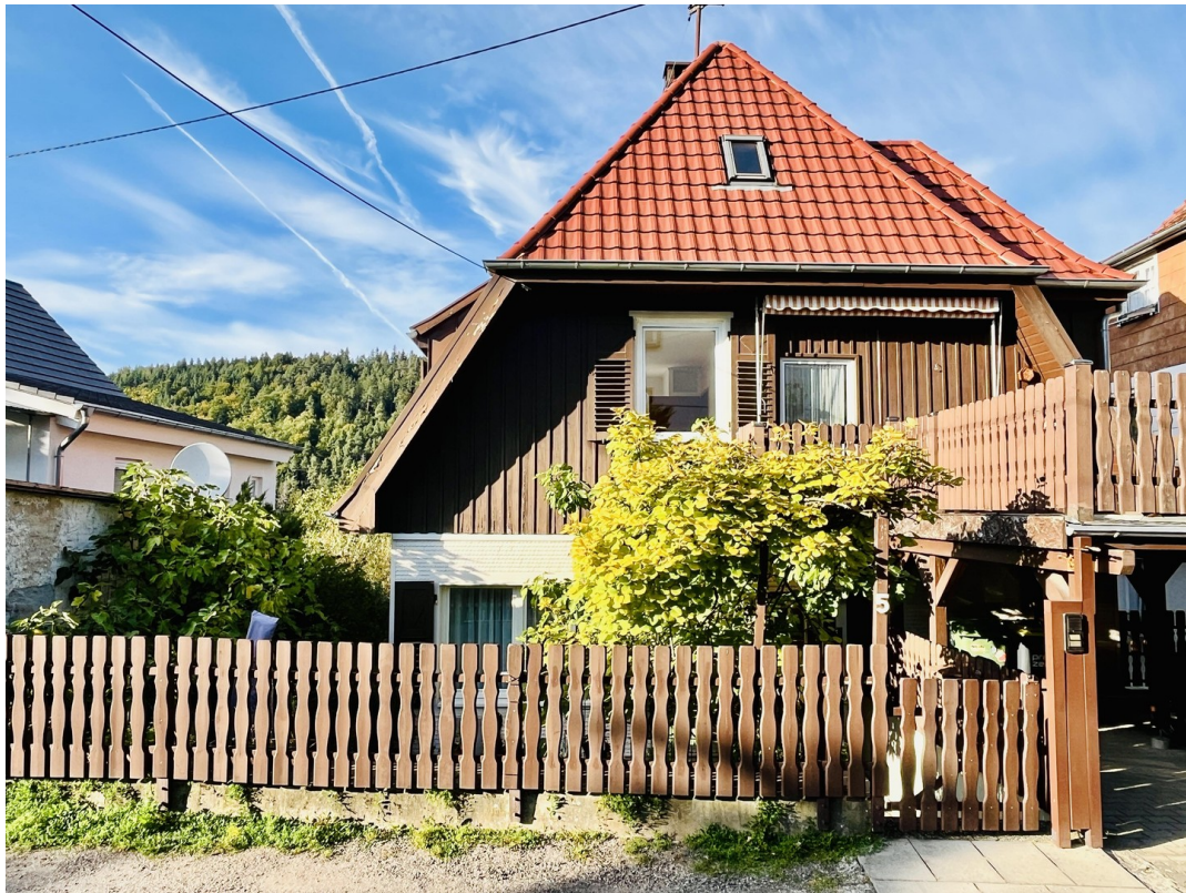
Vorderansicht von der Straße