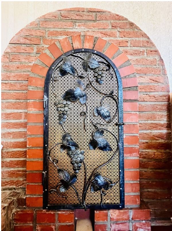
Holzofen geschlossen (EG)