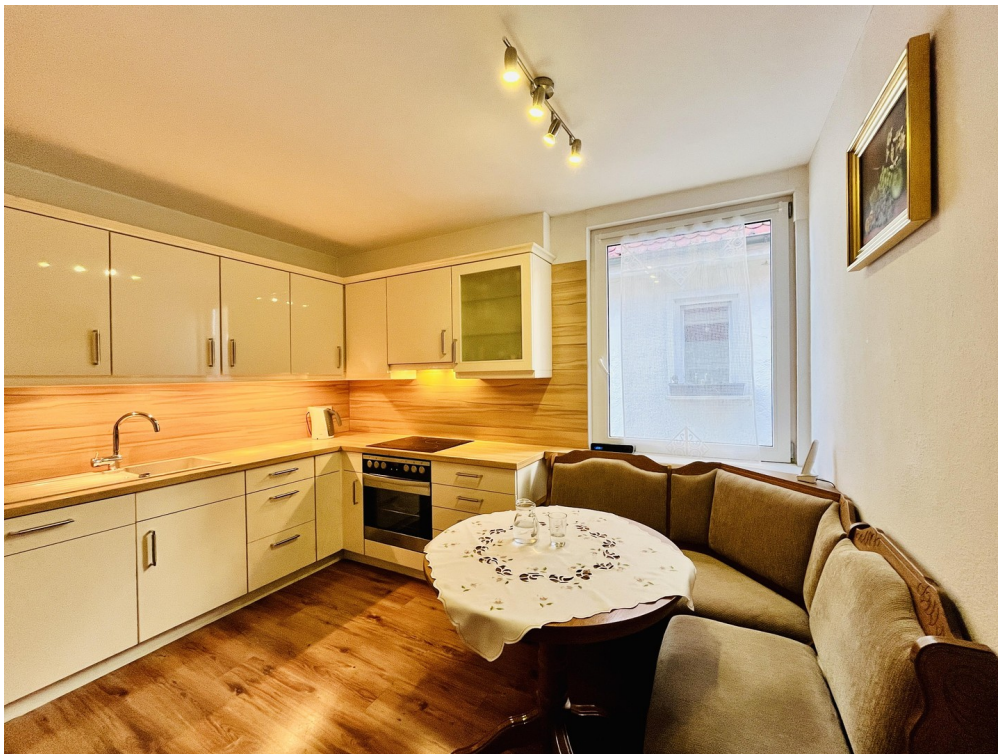
Küche inkl. Einbauküche (EG)