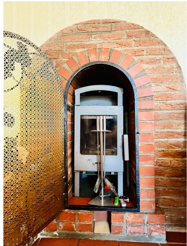
Holzofen geöffnet (EG)