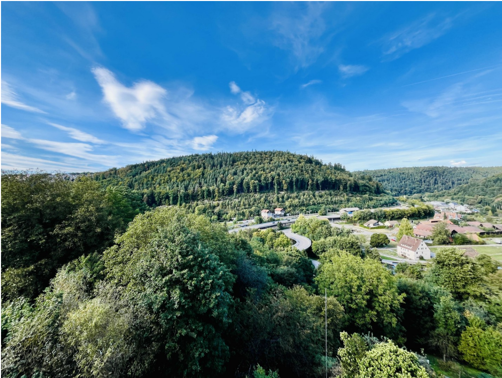
Ausblick Speicher (DG)