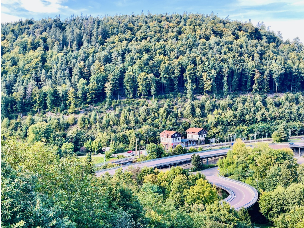
Aussicht von Wohnzimmer (EG)