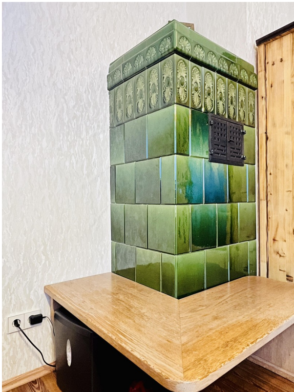
Original Kachelofen (EG)