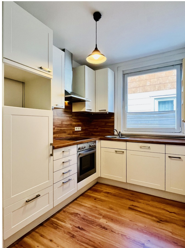
Küche inkl. Einbauküche (OG)