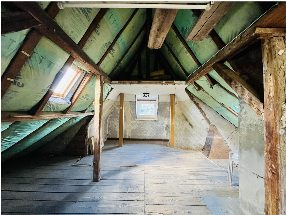
unausgebauter Speicher (DG)