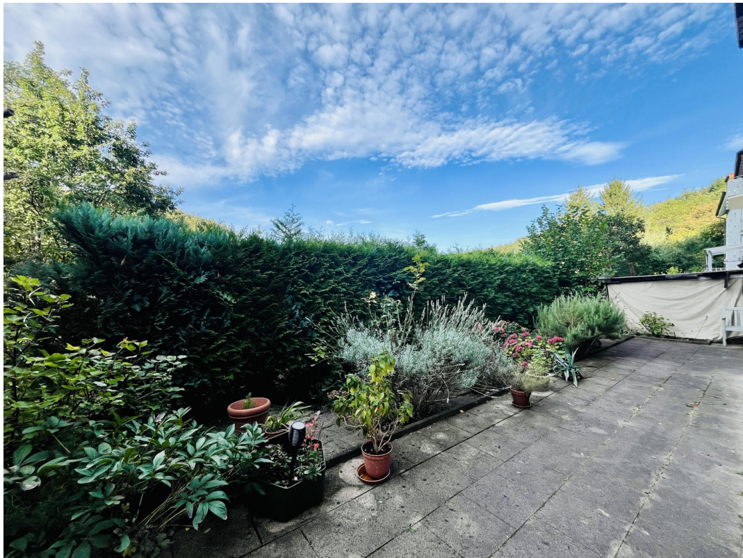
Terrasse bei Zimmer 1 UG