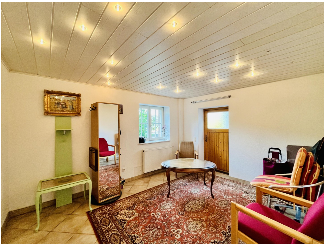
ausgebautes Zimmer 2 (UG)