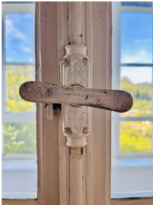
Original Fenster (OG)