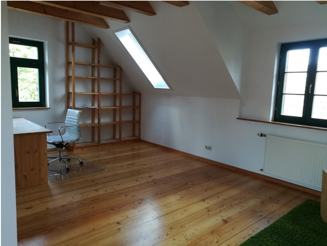
Büro / Galerie