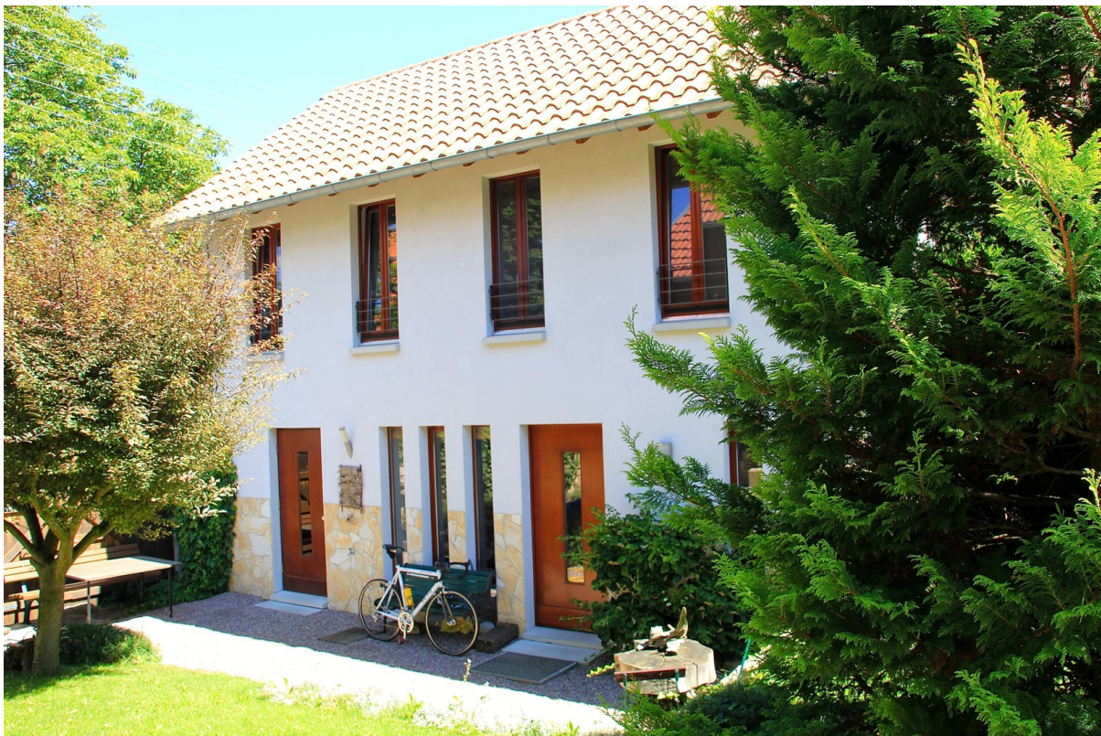
Nebenhaus mit Einliegerwohnung