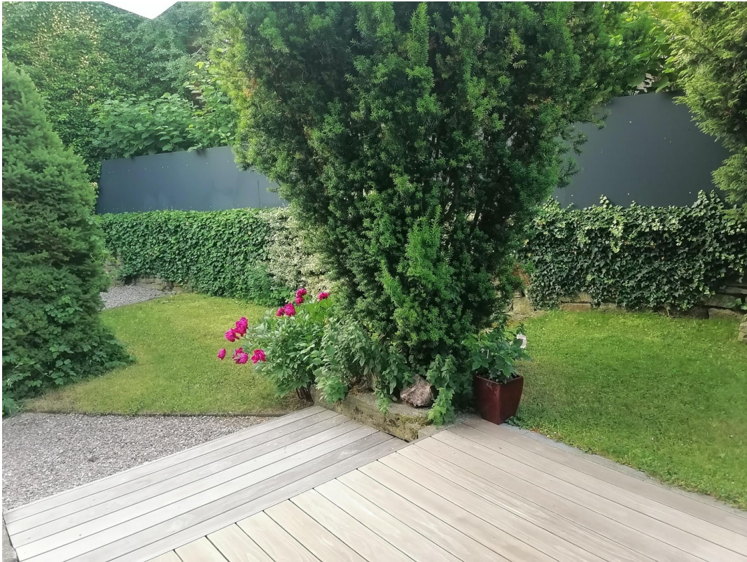
Terrasse / Garten