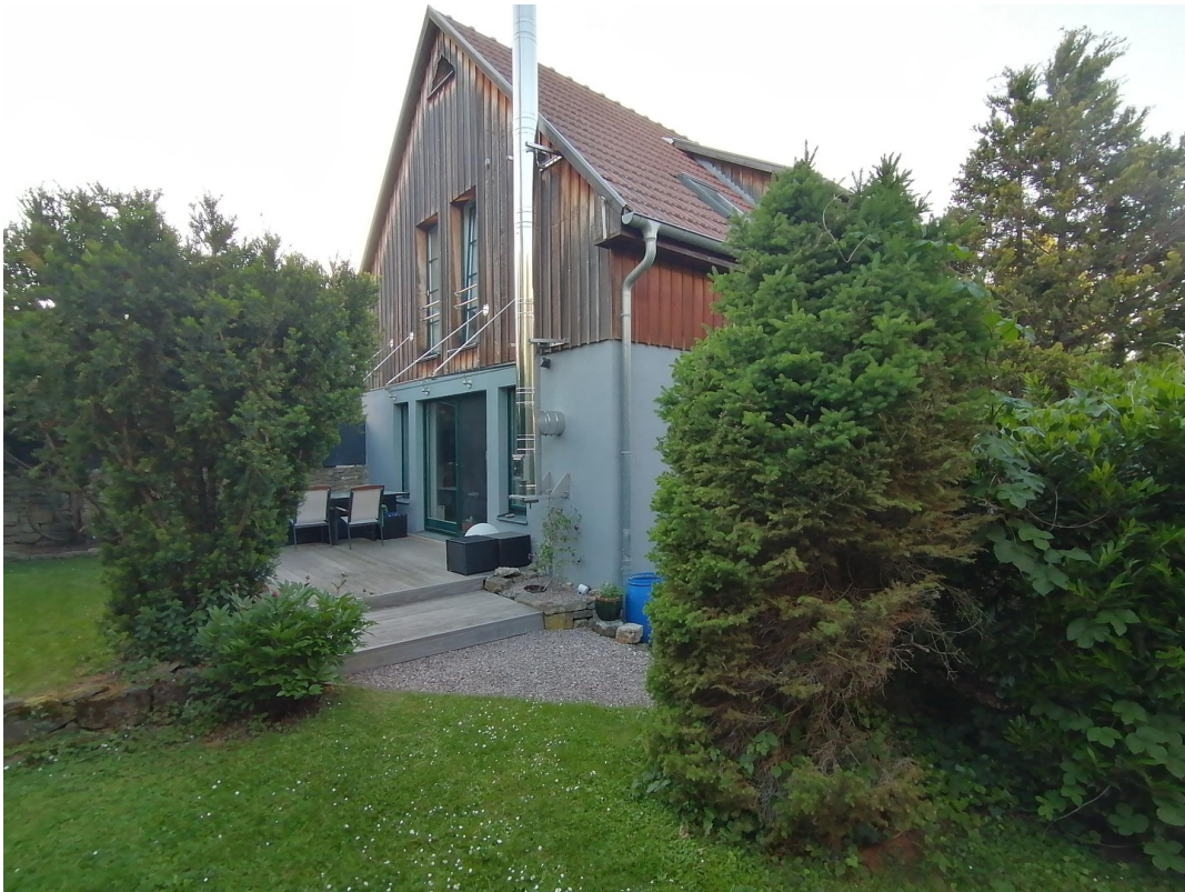
Terrasse / Garten