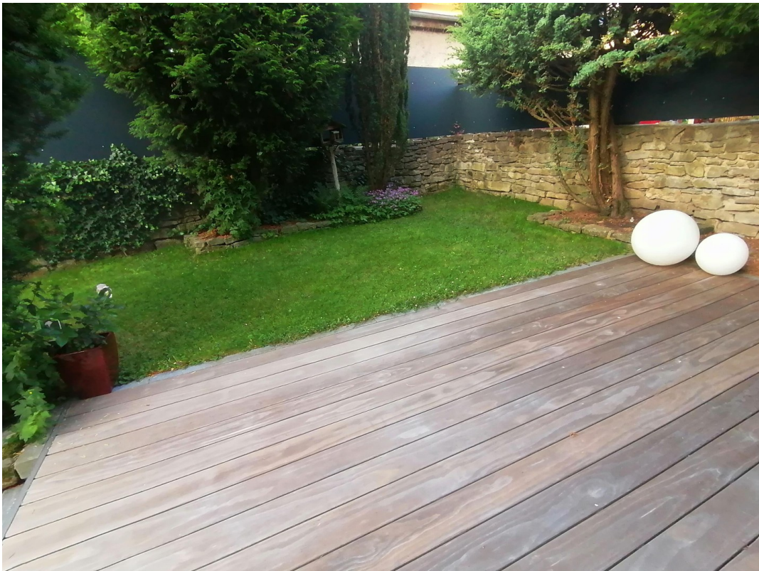
Terrasse / Garten