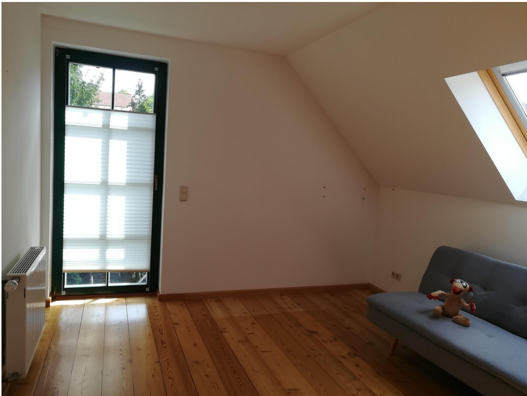
Kinderzimmer / Schlafzimmer