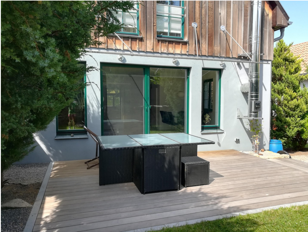
Terrasse / Garten