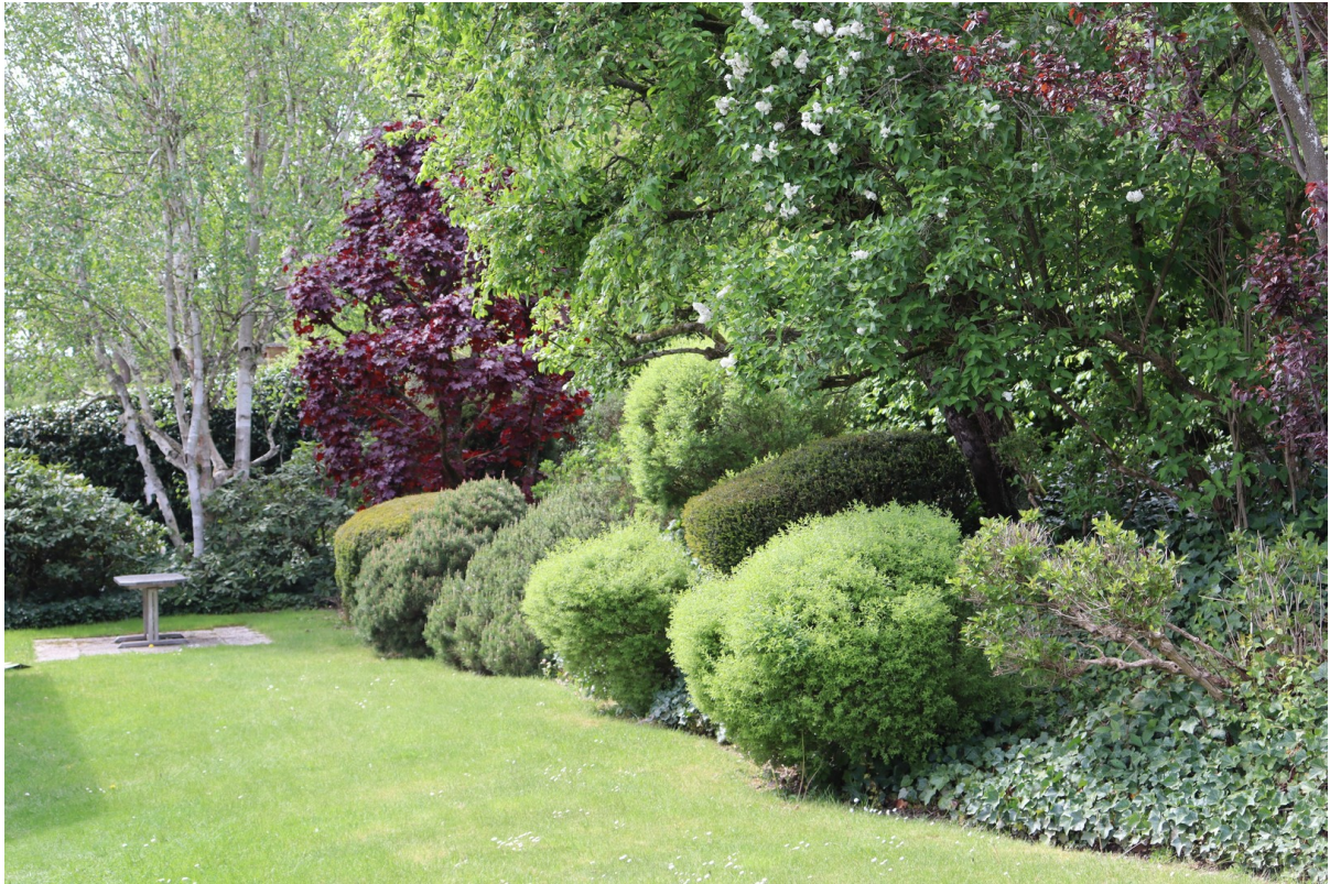
Garten mit Terrasse