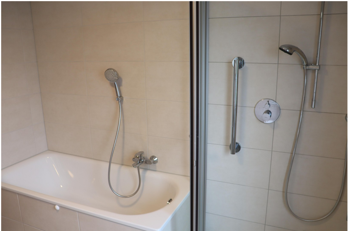
Badezimmer Dusche und Wanne