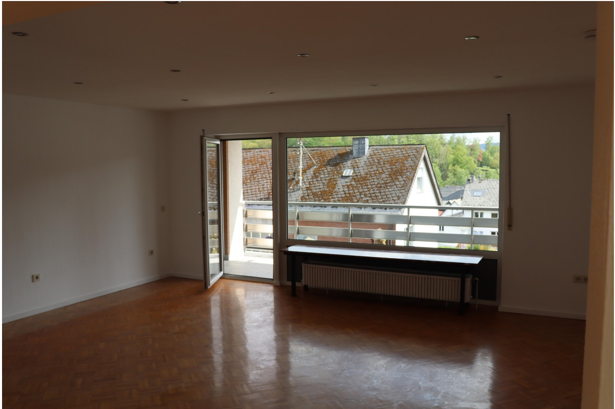
Wohnzimmer / Balkon