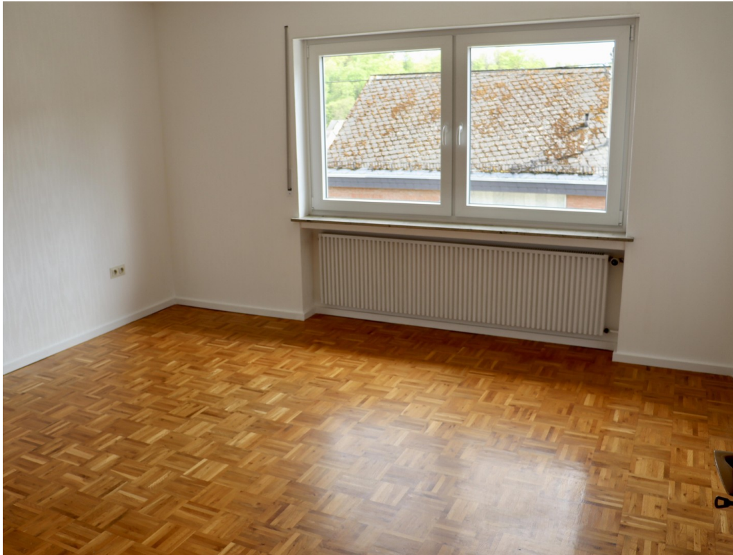
Schlafen 2 / Büro