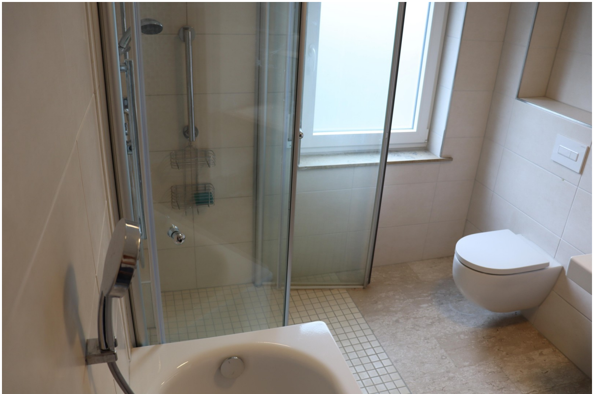
Badezimmer Dusche und Wanne