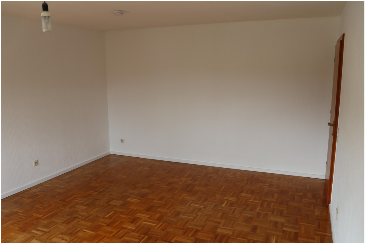
Schlafen 3 / Eltern