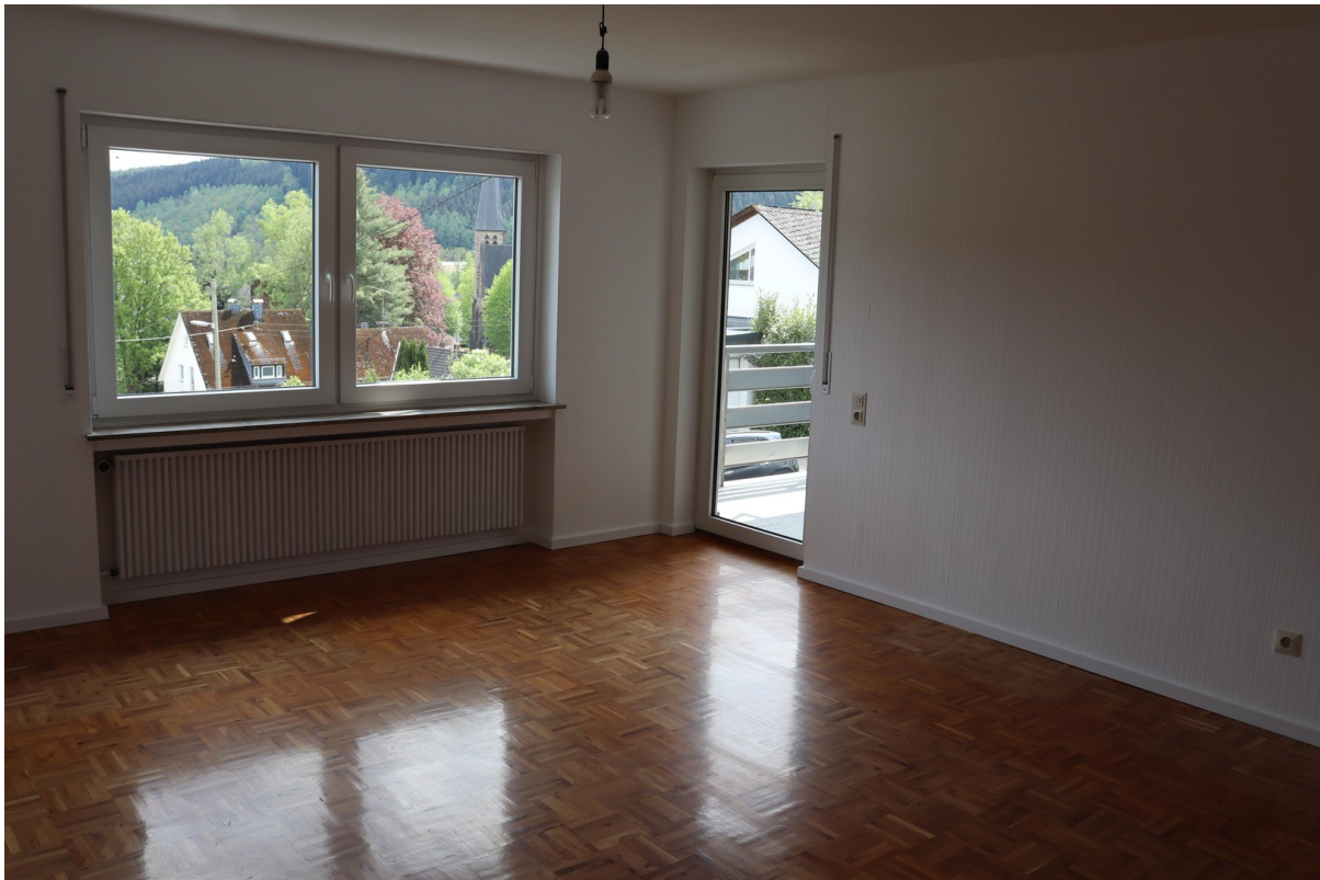
Schlafen 3 / Eltern