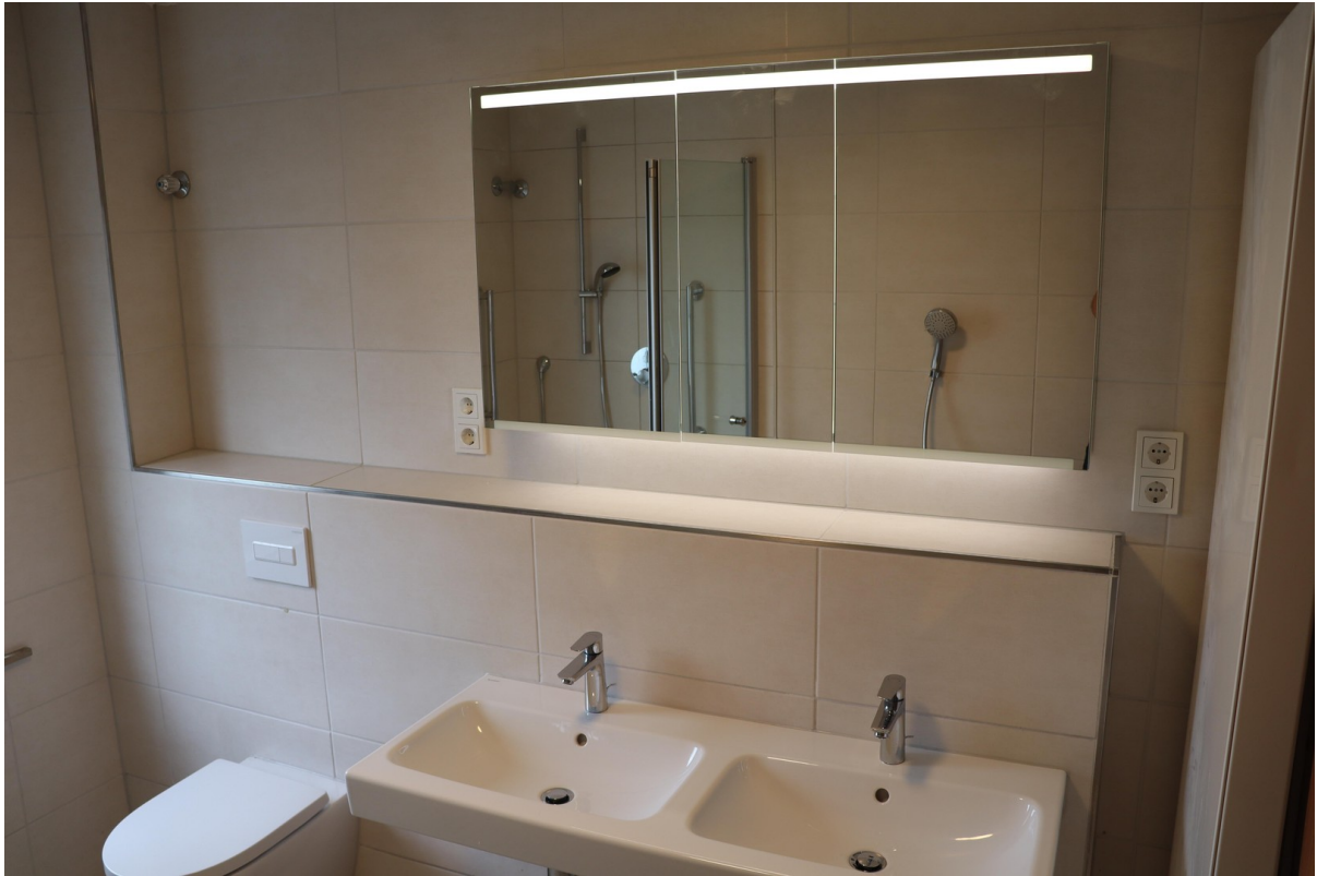
Badezimmer mit Waschbecken