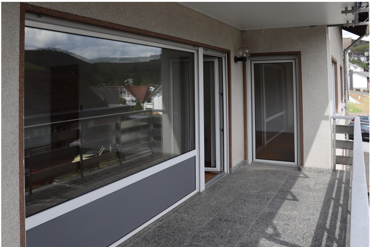
Balkon mit Blick ins Wohnz.