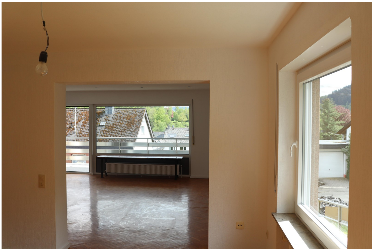
Esszimmer und Wohnzimmer