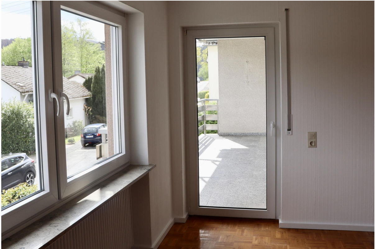
Schlafen 3 / Eltern