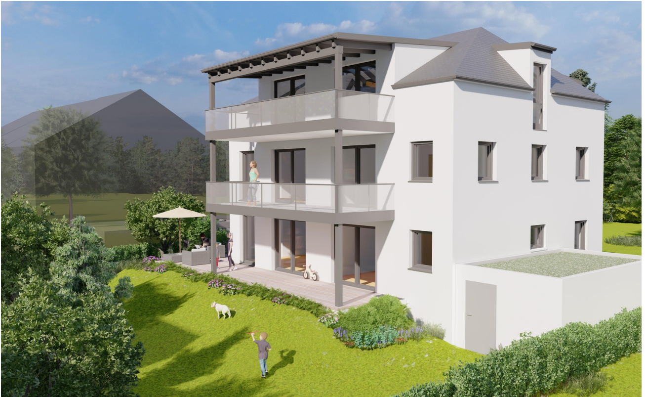
Aussenansicht - Garten