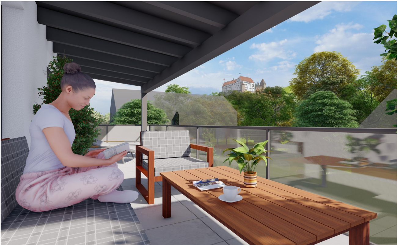
Dachgeschoß mit Balkon