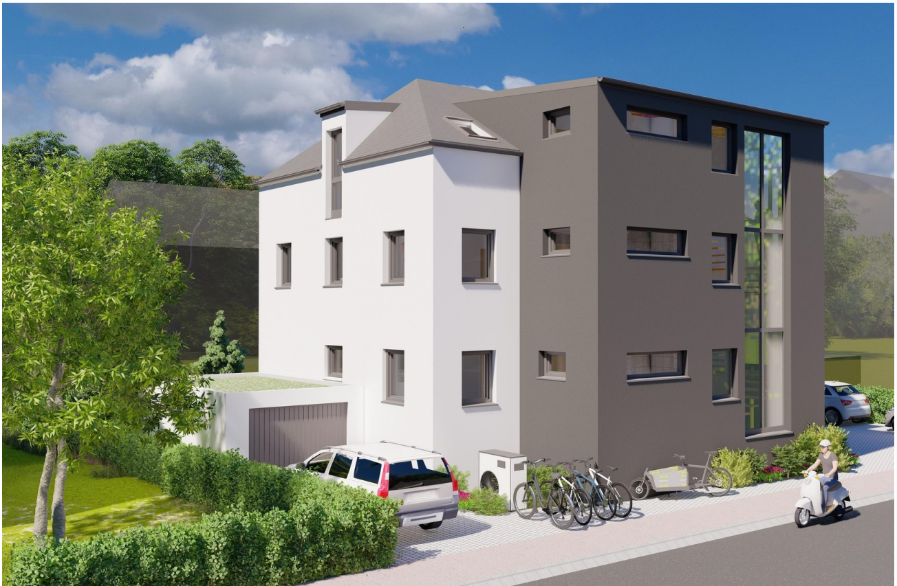
Aussenansicht - Ostseite