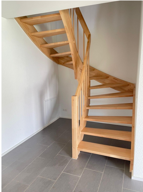
Treppe ins OG