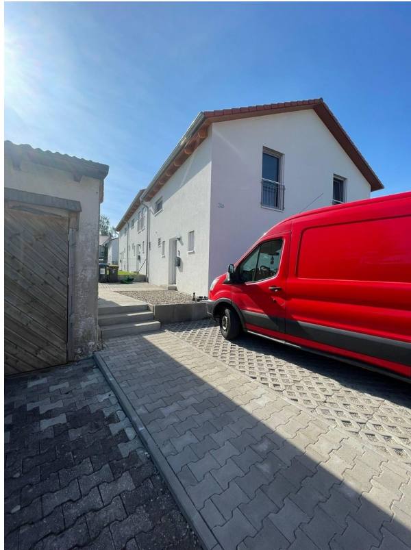
Zugang mit Stellplätzen