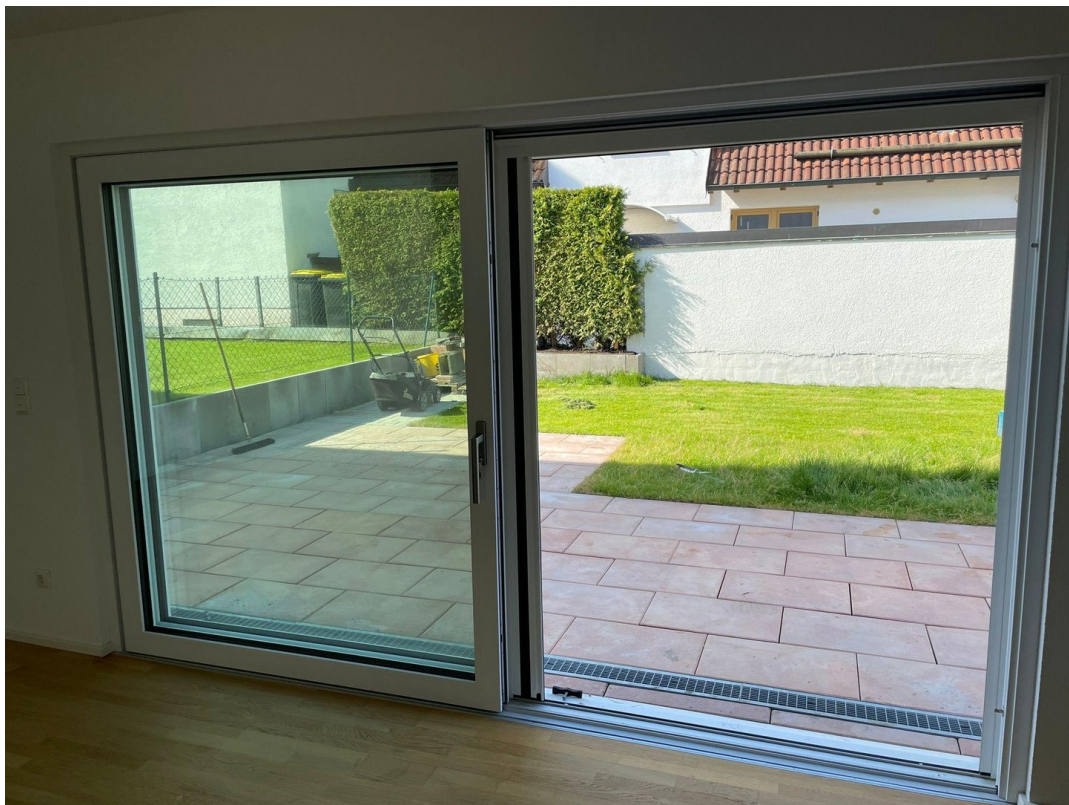
Blick auf die Terrasse