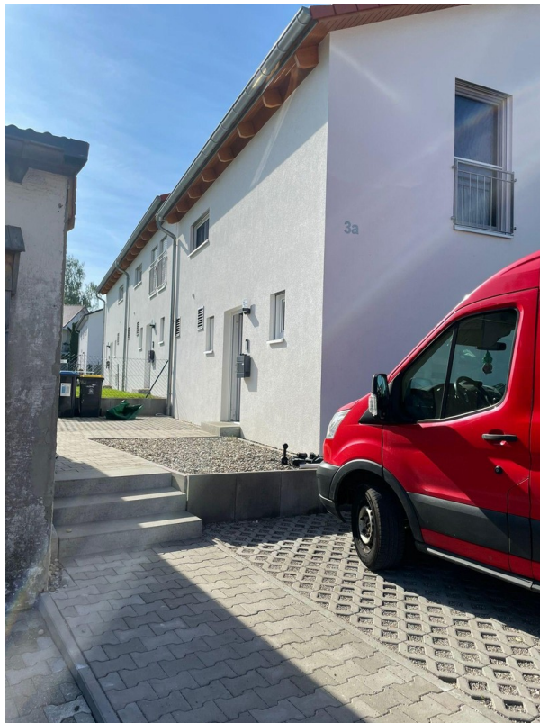
Zugang mit Stellplätzen