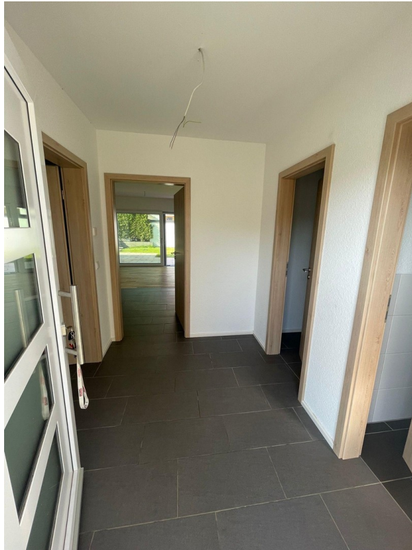
Flur EG - Eingangsbereich