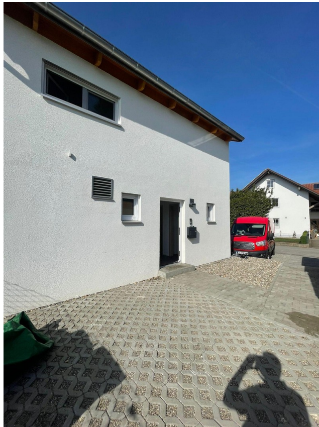
Freifläche vor Eingang