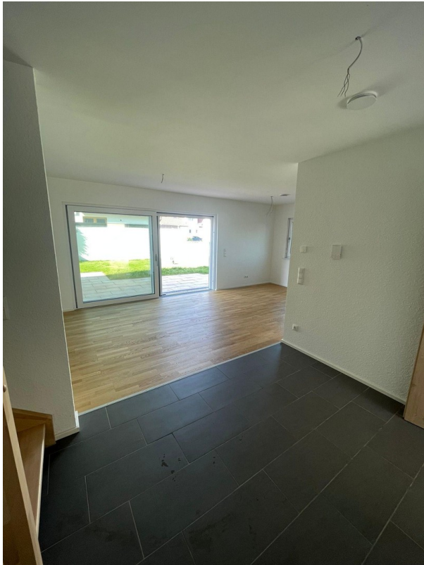
Flur mit Blick auf Terrasse