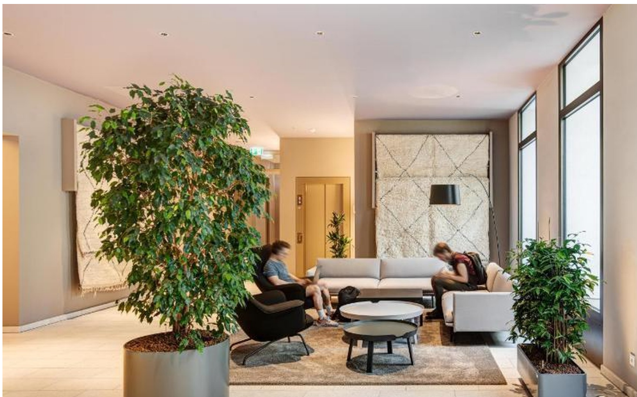
Lobby / Eingang