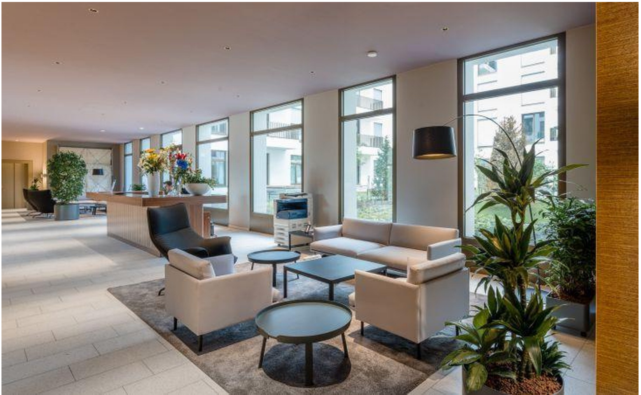
Lobby / Eingang