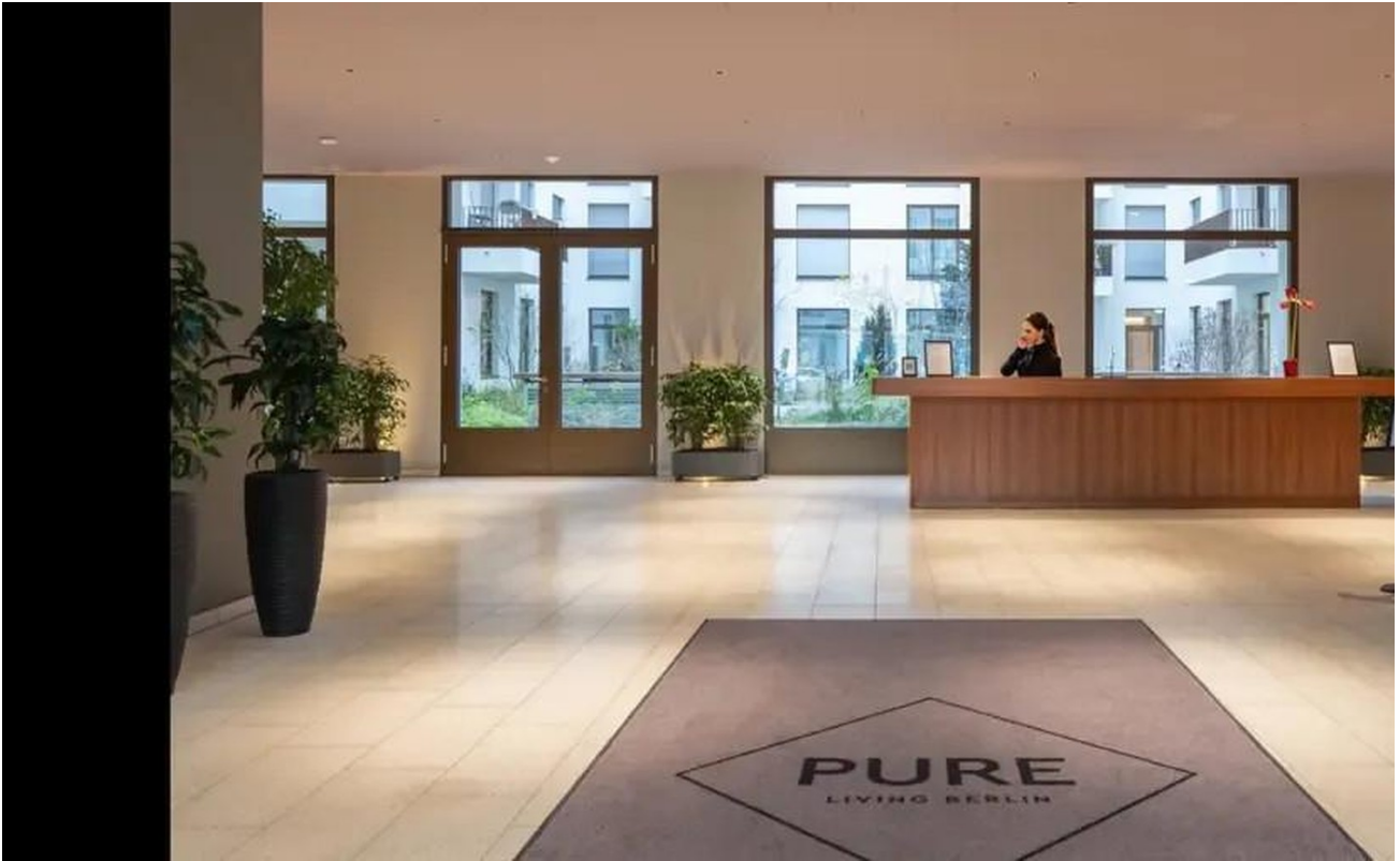
Lobby / Eingang