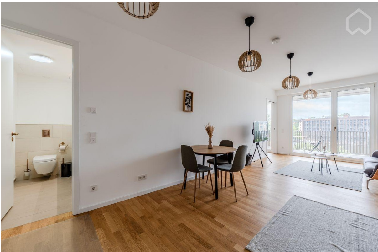
Wohnzimmer mit Gaeste WC