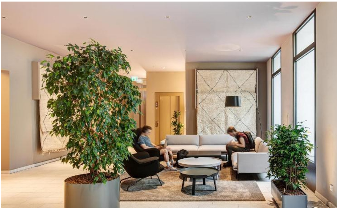
Lobby / Eingang